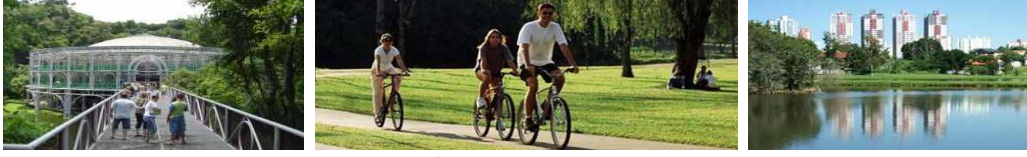
شكل رقم (3) يوضح زيادة المساحات الخضراء والأماكن الترفيهية والمتنزهات في كيريتيبيا.

الخطيرة عن طريق تحويل مياه الفيضان إلى المتنزهات وبالتالي زيادة القيمة الجمالية والترفيهية لمتنزهات المدينة. وفي عام 2007 احتلت المدينة المركز الثالث في قائمة "المدن الخضراء الـ 15" على مستوى العالم. تم وضع "قانون البيئة" الذي يحمي الغطاء النباتي المحلي (الغابات شبه الاستوائية المختلطة)، والتي قد تتعرض للتهديد من قبل التنمية الحضرية. ويؤكد على عدم قطع أشجار صنوبر بارانا في الحدائق العامة أو الخاصة.