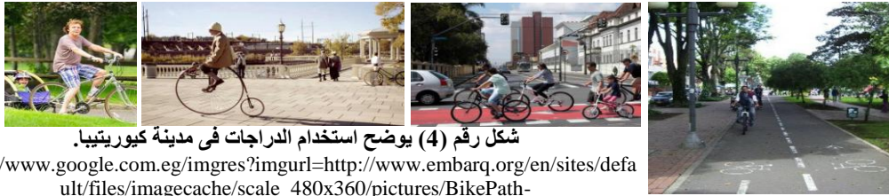
شكل رقم (4) يوضح استخدام الدراجات في مدينة كيريتيبيا.

5-6- الدراجات و طرق المشاة: خصصت المدينة ما يقرب من 26 ميل من الطرق المخصصة للدراجات، والتي يستخدمها يوميا حوالي 30000 راكب .