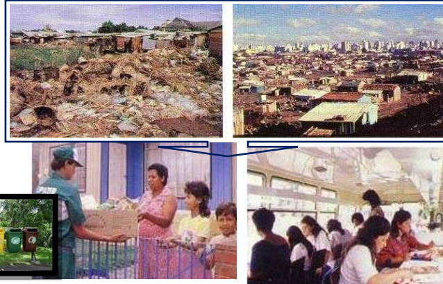
استخدام الحافلات القديمة كمكاتب وحجرات تدريس متنقلة، وكوسيلة نقل مجانية إلى المتنزهات. شكل رقم (5) يوضح حل مشكلة العشوائيات.

تقوم العائلات بفرز نفاياتها لتسهيل عملية استعادة الزجاج والمعادن والبلاستيك يقوم الفقراء بجمع النفايات وتبديلها بكوبونات لركوب المواصلات والمواد