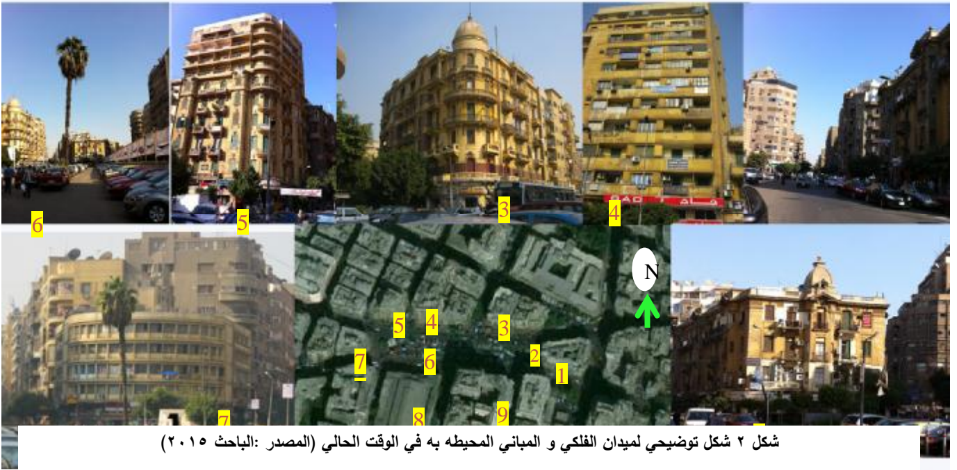
شكل ٢ شكل توضيحي لميدان الفلكي و المباني المحيطة به في الوقت الحالي