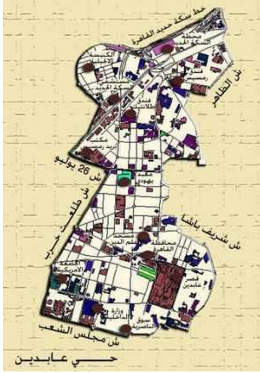
شكل (١) حي عابدين و الشوارع المحيطة به.

صدر عدة قوانين من سنة ١٩٦٢-١٩٨١ بموجبها تم تحديد القيمة الإيجارية الجديدة منسوبة إلى تكلفة البناء و ثمن الأرض وكذلك تم إقرار امتداد الأيجار تلقائياً إلى المستأجر ثم إلى أقاربه حتى الدرجة الثالثة (راجح، ٢٠٠٧)