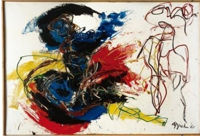
شكل رقم (٣) الفنان: كاريل ايبيل اسم العمل: شكليين (١٩٦١) الأدوات: زيت على قماش

وعلى الرغم من ابتعاد الفنانين عن القصديّة أو اللغّة الفنيّة المحددة، فقد بدأ تكريسهم للجماليّة البدائيّة واضحا للعيان في جميع المعارض التي أقامتها الحركة، وحتى بعد انقراط عقد الجماعة، فإن هؤلاء الفنانين استطاعوا تحويل الموجة التعبيريّة الجديدة التي احتضنوها، إلى عاصفة مفاجئة هزت أركان الفن الأوروبي في خمسينات القرن الماضي، فكانت حركة (كوبرا) تطمح دائما إلى تعميم نظرية مفادها ضرورة خوض غمار الحياة، والمساهمة الفعالة في صنعها ورسم ملامحها الجديدة، غير أن إعراض المؤسسات عن دعمها، وقيام عدد من تجار الفن الأمريكيان، مدعومين بعدد من فناني باريس بمحاربتها، إضافة إلى المرحلة الفلقة التي جاءت فيها؛ لم يسعفها في تحقيق ما كانت تصبو إليه. وبناءً على كل ما سبق يظل الفنان هو المفكر والمبدع وواضع اللبنة الأولى في كل عمل فني مبتكر. وفيما يلي عرض التجارب التصميمية الخاصة بموضوع الدراسة وهي تصميمات متأثرة بالفكر الفني لفناني مدرسة "الكوبرا" واستخدامها في عمل تصميم تجارب لمعلقات نسجية مطبوعة وعمل معالجات فنية لكل تجربة تصميمية بمجموعات لونية وتأثيرات مختلفة .