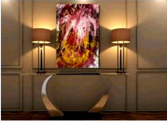
تم توظيفها كمعلق يصلح لغرفة استقبال