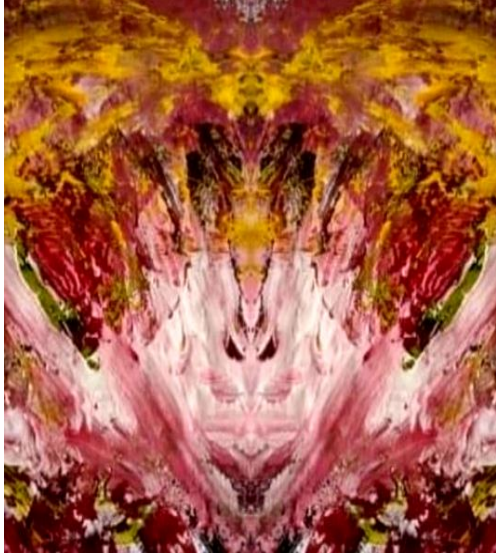
التجربة التصميمية رقم (٣- ب)