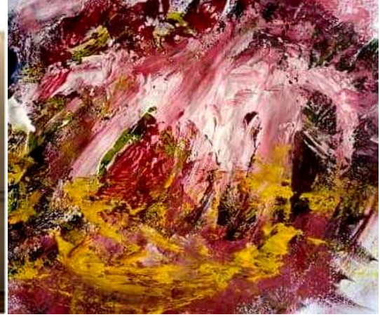
التجربة التصميمية رقم (٣)