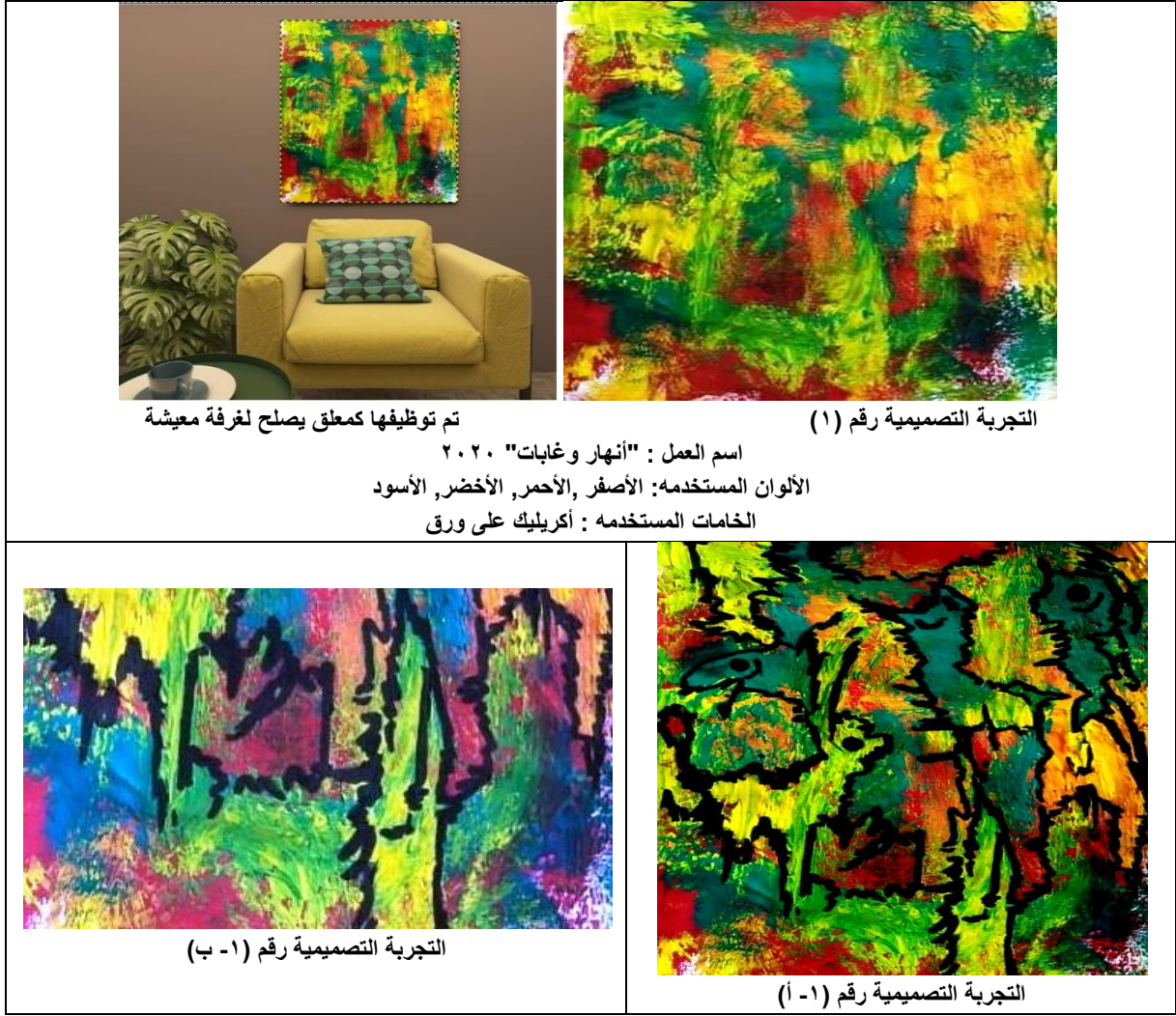
تم توظيفها كمعلق يصلح لغرفة معيشة