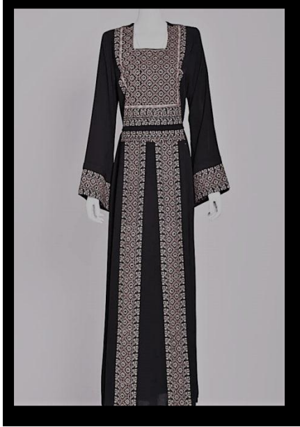
صورة رقم (٥) توضح التصميم النسائي المقترح الخامس

الخيوط: الحرير والقصب. الخامات: الخرز والترتر والزركون. الألوان: الأحمر والأسود والأصفر.