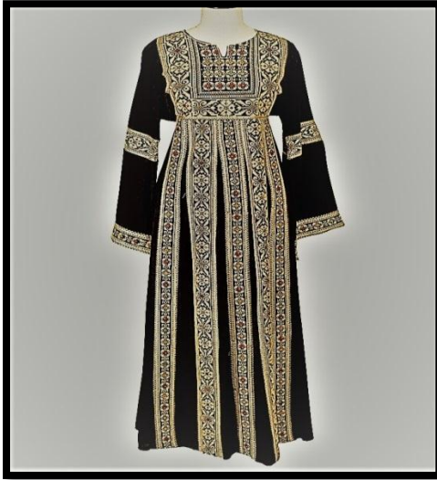
صورة رقم (٧) توضح التصميم النسائي المقترح السابع