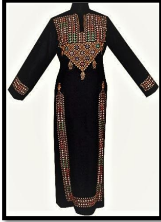
صورة رقم (١) توضح التصميم النسائي المقترح الأول

الخيوط: الحرير والقصب. الخامات: الخرز والترتر والزركون. الألوان: الأحمر والأخضر والأسود.