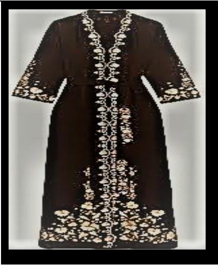
صورة رقم (٢) توضح التصميم النسائي المقترح الثاني

الخيوط: الحرير والقصب. الخامات: الخرز والترتر والزركون. الألوان: الأحمر والأخضر والأسود.