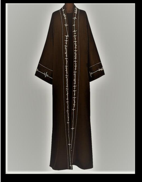
صورة رقم (٣) توضح التصميم النسائي المقترح الثالث

الخيوط: الحرير والقصب. الخامات: الخرز والترتر والزركون. الألوان: الأحمر والأسود والأخضر.