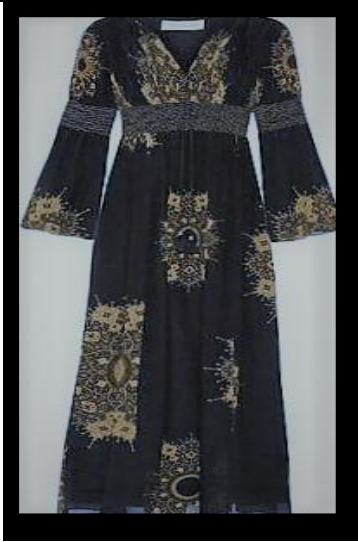
صورة رقم (٨) توضح التصميم النسائي المقترح الثامن

الخيوط: الحرير والقصب. الخامات: الخرز والترتر والزركون. الألوان: الأصفر والأزرق والأحمر.