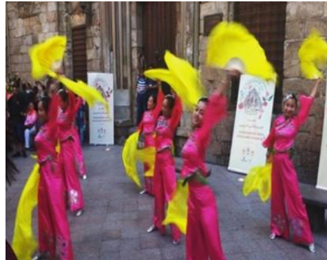
صورة رقم (٦) لاستعراض احدى الفرق الكوري