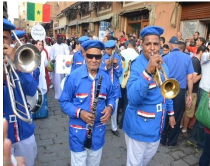
صورة رقم (٣) لبعض للعازفين المصريين