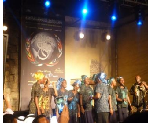
صورة رقم (١٤) لفرقة الليجرو النسائية