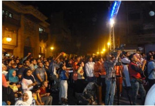
صورة رقم (١٦) للجماهير وهم يقومون بالاستمتاع بفرق الاثناد الديني