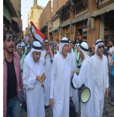
صورة رقم (١) لفرقة الفنون الشعبية العريشية