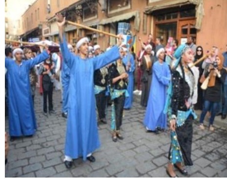
صورة رقم (١١) لفرقة الفنون الشعبية البورسعيدية