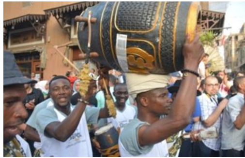
صورة رقم (١٣) لفرقة الفنون الشعبية من السنغال

١-٣-٢-١ مهرجان سماع الدولي للإنشاد الديني والموسيقى الروحية" :