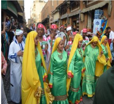
صورة رقم (٢) لفرقة اسوان

تهتم المهرجانات الشعبية التي تقام بعرضها لثقافات الشعوب من خلال استعراض الأزياء الشعبية الخاصة بالدولة أو المحافظة صاحبة الاستعراض أو الفن الأدائي المعروف ومكملات الزي من حلى مختلفة سواء حلى للشعر أو الوجه أو اليدين أو الأرجل وتظهر هذه الأزياء من خلال الصور الملتقطة بإحدى الكاميرات المستخدمة لتقنية 4k K والتي أوضحت أمثلة مختلفة لبعض فرق الفنون الشعبية في جمهورية مصر العربية والدول المشاركة في المهرجان مثل ارتداء فرقة الفنون الشعبية العريشية للجلباب الأبيض والشال الأبيض على الرأس والعقال الأسود أثناء الأداء الخاص بهم في شارع المعز في احد هذه المهرجانات وارتفاع علم جمهورية مصر العربية خلفهم دليل على انتماءهم لهذه الدولة، كما في صورة رقم (١) ، وارتداء البنات الأسوانيات لفرقة أسوان للجلباب الأخضر المطعم بالألوان الخضراء والحمراء للافت الانتباه وجذب النظر بهذه الرجال الأسوانيين وهم يرتدون الجلابب الأبيض المطعم بالألوان الخضراء والحمراء للافت الانتباه وجذب النظر بهذه الألوان المبهجة والتي تتناسب مع لون بشرتهم السمراء الشديدة التميز والخصوصية والحركات المميزة كما في صورة رقم (٢)، وكذلك العازفين اللذين يرتدون ملابس زرقاء مع بيضاء بشكل مميز وهم يمسكون بأيديهم بعض الآلات الموسيقية وهي الآلات النفخ ، كما في صورة رقم (٣) ولكل صورة مدلولاتها الفنية والجمالية التي عبرت عن حالتها داخل المجتمع، فكل زي يخضع لطبيعة المجتمع الذي يعيش فيه ويشكل ظروفه.