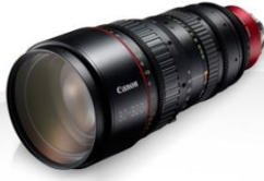
Canon CN-E30-300mm T2.95-3.7 L SP عدسة (صورة رقم ٢٣)

هي عدسة تكبير/تصغير للتصوير الفائق عن بُعد تتميز بأدائها البصري الرائع وإمكاناتها المبتكرة, إنها العدسة-CN-E30-300mm T2.95-3.7 L S التي تنافس مثيلاتها في فئتها في قوة التكبير/التصغير وبعدها البؤري للتصوير عن بُعد. تتميز بتصميم قوي, ومستوى استثنائي من السهولة والمرونة في الاستخدام يجعلها مثالية لعمليات إنتاج الأفلام عالية المستوى .