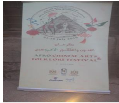
صورة رقم (٩) لاحتفالات مهرجان الفنون الأفروصيني صورة رقم (١٠) لعرض عرائس تظهر عراك