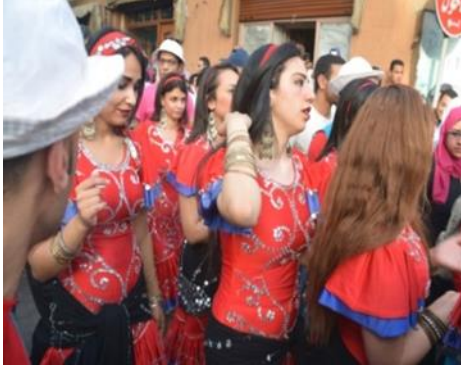
صورة رقم (١٢) لبعض لفرقة الفنون الشعبية السكندرية

والفتيات يقومون بالأداء الشعبي عن طريق الراس بالعصا فيمسك الشباب بأيديهم عصيان خشبية ويرتدون جلباب ازرق وعمة بيضاء وترتدى الفتيات الجلباب الاسود والطرحة الزرقاء على الوسط وعلى الراس، صورة رقم (١٢) لبعض الفتيات لفرقة الفنون الشعبية السكندرية اثناء استعدادهم لإداء الاستعراض الخاص بهم وهم يرتدون الفستان الاحمر ويربطون الحزام الاسود الشهير على وسطهم، صورة رقم (١٣) لفرقة الفنون الشعبية من السنغال وهم يسيرون في مسيرة في شارع المعز استعدادا لإداء رقصتهم وهم يمسكون بأدواتهم الموسيقية المميزة والمختلفة .