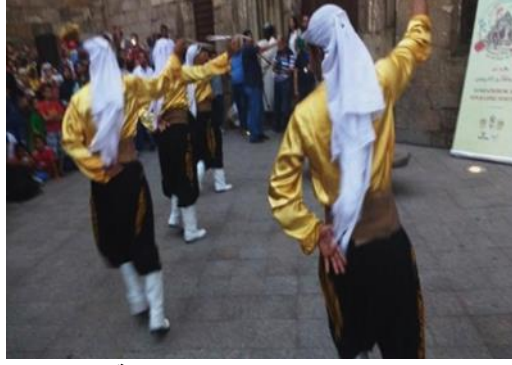
صورة رقم (٨) لأحد الفرق البدوية