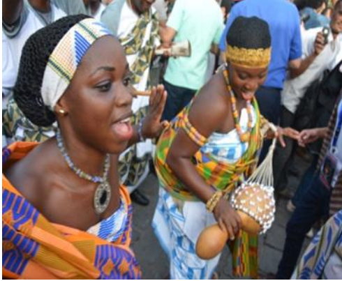
صورة رقم (٥) لغناء فتيات الفريق الشعبي السنغالي

(٤)، كذلك صورة رقم (٥) لبعض الرجال وهم يقومون بعمل استعراضاتهم الشعبية ورقصتهم والتي تتميز بحركات فنية سريعة ومتلاحقة أبرزتها التقنيات الحديثة للصورة .