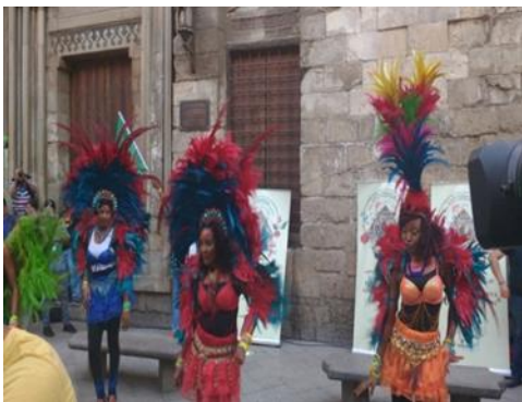
صورة رقم (٧) لاستعراض احدى الفرق الأفريقي

كذلك الاستعراضات الخاصة بالفتيات الكورية الشعبية وازيائهم المميزة وحركات ايديهم وهم يمسكون بالأقمشة الصفراء هذه الحركات الانسيابية التي ابهرت الجماهير حيث تم استخدام سرعات عالية واخرى منخفضة تبعا لطبيعة اللقطة المراد التقاطها والتعبير عنها وإبرازها فاستخدام سرعات عالية ادت الى ثبات حركة الشال الاصفر الذي تمسكه الفتيات الكوريات بأيديها لأداء الاستعراض على الرغم من السرعات الكبيرة التي تتحرك بيها تلك الفتيات في الحقيقة ( جمال الدين ، هشام ، ص: ٥٤ ) ، كما في صورة رقم (٦) ، صورة رقم (٧) للفتيات الأفرقة وهم يرتدون ازيائهم المميزة والريش الملون معلق خلف راسهم وعلى ظهورهم وحركة الريش تخلق حركات انسيابية رشيقة جذابة ومبهرة، صورة رقم (٨) والتي تستعرض حركة البدو اثناء قيامهم بأداء رقصاتهم حيث حركة وقوفهم المميزة برفع احد الساقين وخفض الاخرى ووضع يد خلف الظهر ويد اخرى تتحرك الى اعلى بشكل به حيوية وبسرعة مميزة، وبالوان ازياء مميزة حيث البنطلون الاسود والبوط الابيض والقميص الاصفر والشال الابيض والعقال فوقه، وهذه لحركات السريعة المتلاحقة تحتاج الى تثبيت وتأكيد الموضوع المراد تصويره باختيار كدرات فوتوغرافيا يتضح فيها الحركة حتى وان كانت ثابتة عن طريق التركيز على الموضوع المراد تصويره ويجب مراعاة المنظور حيث انه يلعب دور مهم في احساس المشاهد بالمعلومات المرئية والبصرية التي تحتويها اللقطة وهو الطريقة التي تصور العدسة العمق والحجم بها وكيفية عرض الاشياء المتجاورة والعلاقة الطبيعية بين العناصر المختلفة في المقدمة والمؤخرة داخل اللقطة، حيث ان المنظور العادي يرينا العمق الطبيعي .