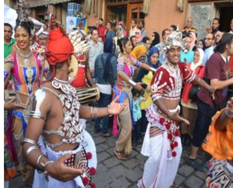
صورة رقم (٤) لإداء الفريق الشعبي السنغالي

كذلك الاستعراضات الخاصة بالفتيات الكورية الشعبية وازيائهم المميزة وحركات ايديهم وهم يمسكون بالأقمشة الصفراء هذه الحركات الانسيابية التي ابهرت الجماهير حيث تم استخدام سرعات عالية واخرى منخفضة تبعا لطبيعة اللقطة المراد التقاطها والتعبير عنها وإبرازها فاستخدام سرعات عالية ادت الى ثبات حركة الشال الاصفر الذي تمسكه الفتيات الكوريات بأيديها لأداء الاستعراض على الرغم من السرعات الكبيرة التي تتحرك بيها تلك الفتيات في الحقيقة ( جمال الدين ، هشام ، ص: ٥٤ ) ، كما في صورة رقم (٦) ، صورة رقم (٧) للفتيات الأفرقة وهم يرتدون ازيائهم المميزة والريش الملون معلق خلف راسهم وعلى ظهورهم وحركة الريش تخلق حركات انسيابية رشيقة جذابة ومبهرة، صورة رقم (٨) والتي تستعرض حركة البدو اثناء قيامهم بأداء رقصاتهم حيث حركة وقوفهم المميزة برفع احد الساقين وخفض الاخرى ووضع يد خلف الظهر ويد اخرى تتحرك الى اعلى بشكل به حيوية وبسرعة مميزة، وبالوان ازياء مميزة حيث البنطلون الاسود والبوط الابيض والقميص الاصفر والشال الابيض والعقال فوقه، وهذه لحركات السريعة المتلاحقة تحتاج الى تثبيت وتأكيد الموضوع المراد تصويره باختيار كدرات فوتوغرافيا يتضح فيها الحركة حتى وان كانت ثابتة عن طريق التركيز على الموضوع المراد تصويره ويجب مراعاة المنظور حيث انه يلعب دور مهم في احساس المشاهد بالمعلومات المرئية والبصرية التي تحتويها اللقطة وهو الطريقة التي تصور العدسة العمق والحجم بها وكيفية عرض الاشياء المتجاورة والعلاقة الطبيعية بين العناصر المختلفة في المقدمة والمؤخرة داخل اللقطة، حيث ان المنظور العادي يرينا العمق الطبيعي .