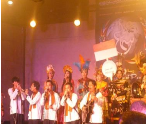
صورة رقم (١٥) لفرقة الغناء الشعبي الكوري