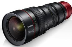
Canon CN-E14.5-60mm T2.6 L S عدسة (صورة رقم ٢٤)

هي عدسة تكبير/تصغير بزوايا عريضة تتوافق مع الحامل EF, إنها العدسة CN-E14.5-60mm T2.6 L S التي تقدم مستوى رائدًا من مدى الزاوية المتسع إلى جانب أدائها البصري العالي, وذلك للحصول على تحكم أفضل ومبتكر ونتائج رائعة في عمليات إنتاج الأفلام عالية المستوى. وتتميز العدسة بعناصر تحكم يدوي قياسية وتصميم قوي وسهل الاستخدام .