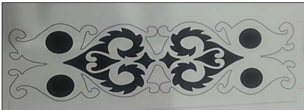
شكل (٨) التصميم النهائي_ (أ) بلون الأسود، (ب) بلون الأبيض.

٣) تنفيذ التصميم: استخدمت الباحثة تقنيه القص والتفريغ بالليزر لتنفيذ التصميم (أ، ب) بواسطة جهاز القص الليزري الذي يعتمد على التكنولوجيا الرقمية ومن ثم تثبيت المنسوجة على خلفية من النسيج السادة بألياف البامبو بلون الأخضر الفاتح لإبراز حدود القص الليزري. كما يوضح شكل (٩)