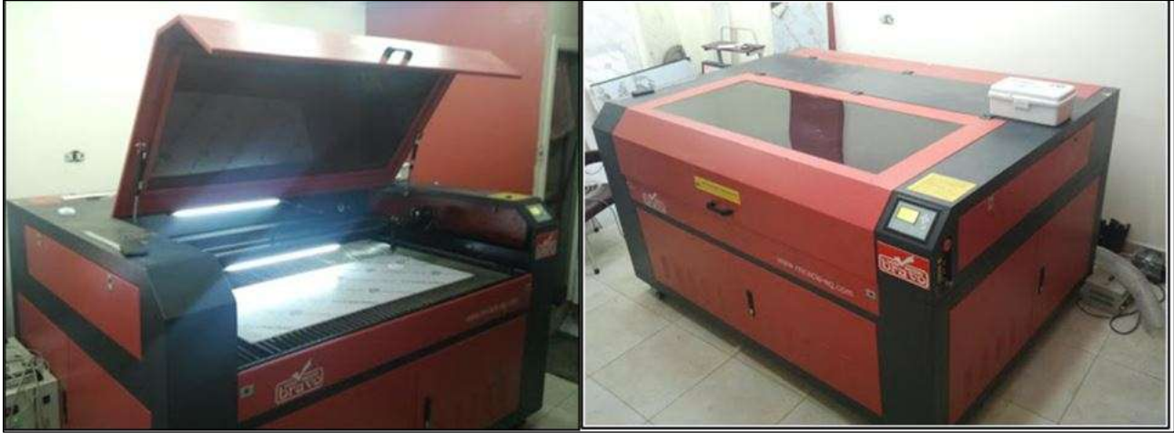
شكل (٤) آلة القص بالليزر بتقنية التحكم DSP، للقص على الأكريليك والخشب والبلاستيك والأقمشة. ( https://www.pngegg.com/en/png-merts )

ماكينة ليزر (١٦٠ اسم X ١٠٠ اسم) قدرتها ١٠٠ واط، وهي تعتمد على التكنولوجيا الرقمية وفق برنامج حاسوبي (الأيستور) وبدعم اوتوكاد، لتخطيط الرسومات والتصميمات المختلفة وارسال البيانات لا نجاز المهام الخامة لبدء القص والحفر. أغراض استخداماته: القماش، الجلد، الزجاج، الورق، الخشب، المعدن، الأكريليك، البلاستيك، وغيرها من الخامات ( https://www.pngegg.com/en/png-merts ).