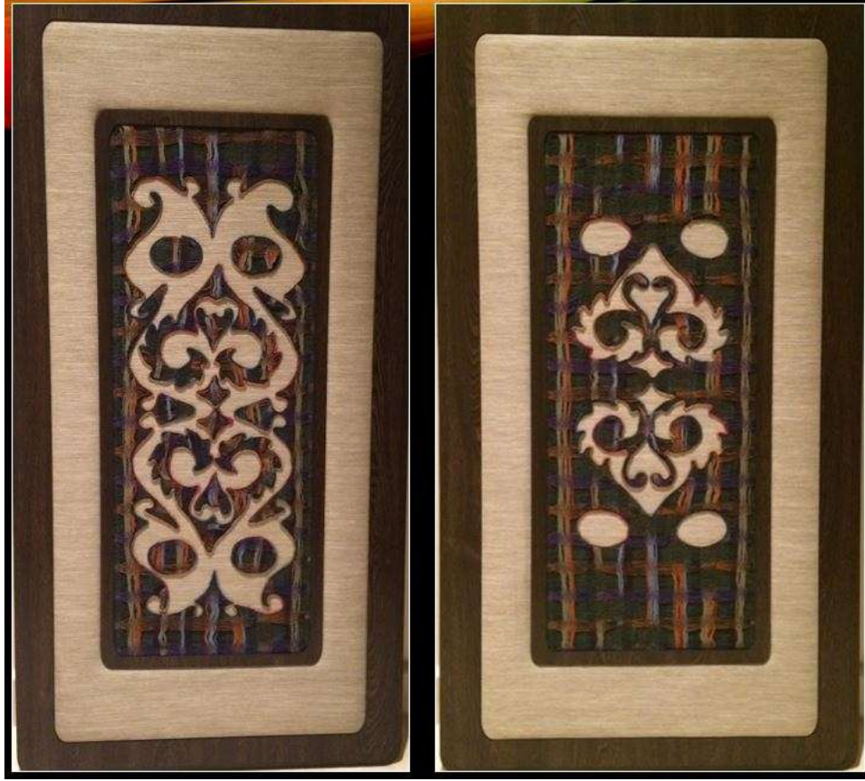
شكل (١١) الإخراج النهائي للعمل الفني (أ، ب)

٤) الإخراج النهائي للعمل: تنفيذ برواز من الخشب الطبيعي بلون البني الغامق من طبقتين متراكبه وتم قصه بالليزر، وتركيبه بطريقه الدبل فريم ووضع إطار مساحة فاصلة بين البروازين من نفس الخلفية المستخدمة داخل العمل الفني. كما يوضح شكل (١١)