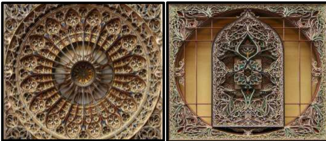
شكل (١) أحد اعمال الفنان اريك ستاندلي بتقنية القص الليزري على خامة الورق. ( http://www.eric-standley.com )

٢- غابرييل شاما (Gabriel Schama) فنان امريكي تميزت اعماله الفنية بقص طبقات الخشب باستخدام الليزر لعمل منحوتات خشبية جميلة، والتي تتشكل في طياتها وجوه لأشخاص بحيث تضي عليها أشكال شخصية مميزة تتخذ بدخلها أيقونات هندسية أو منحنيات متداخلة