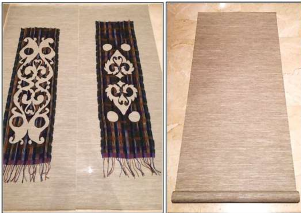
شكل (٩) القطعة النسجية بعد إتمام عملية القص الليزري.

ثم تركيب على أطراف التفريغ خيط من الصوف المموج بنفس الألوان المستخدمة في عملية النسيج لإبراز حدود القص وترتيب أطراف التفريغ. كما يوضح شكل (١٠)