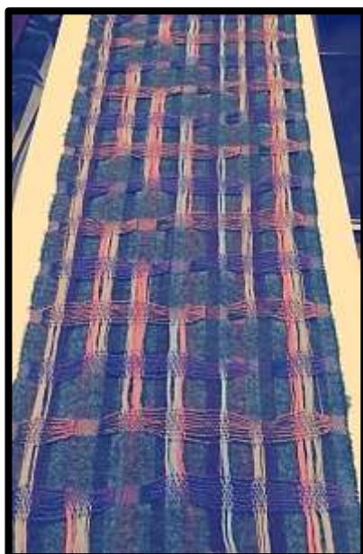
شكل (٥) الشكل النهائي للمنسوجة بعد الانتهاء من عملية النسيج.

المنسوجة وترك بعض الأجزاء منفصلة، واختارت الباحثة مجموعته لونه بين الأخضر الغامق والفاتح والبنفسجي والبرتقالي والأزرق الفاتح.