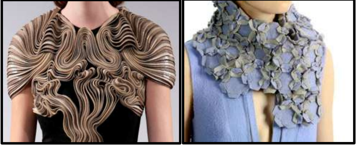
شكل (٣) أحد اعمال الفنانة اون سوك هور بتقنية القص الليزري على خامة الأقمشة. ( http://www.design.leeds.ac.uk/people/eun-suk-hur )

( http://www.design.leeds.ac.uk/people/eun-suk-hur )