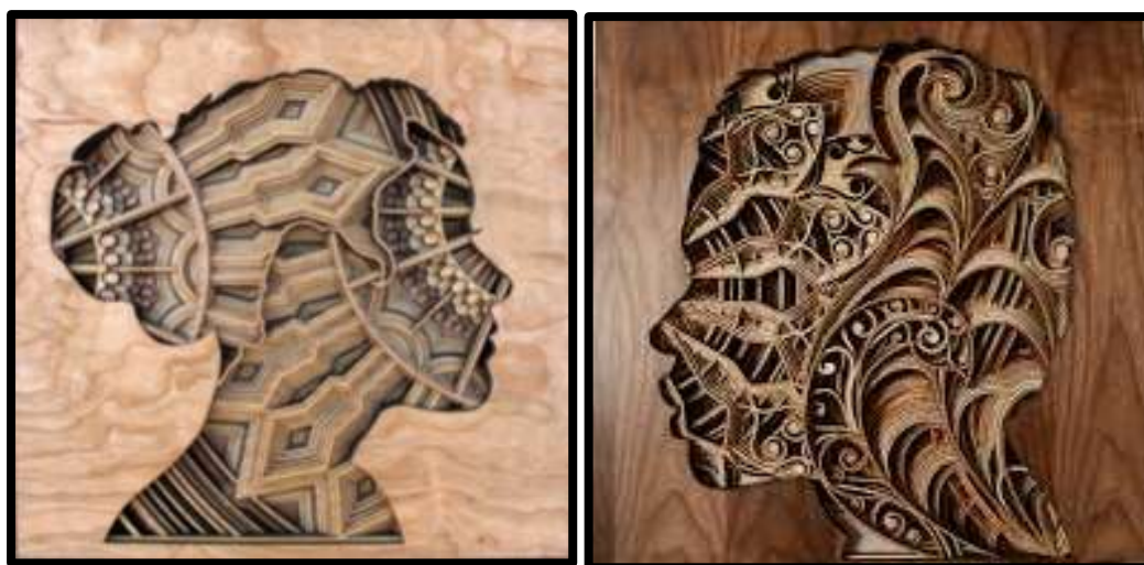
شكل (٢) أحد اعمال الفنان غابرييل شاما بتقنية القص الليزري على خامة الخشب. ( http://www.gabrielschama.com )

٢- غابرييل شاما (Gabriel Schama) فنان امريكي تميزت اعماله الفنية بقص طبقات الخشب باستخدام الليزر لعمل منحوتات خشبية جميلة، والتي تتشكل في طياتها وجوه لأشخاص بحيث تضي عليها أشكال شخصية مميزة تتخذ بدخلها أيقونات هندسية أو منحنيات متداخلة