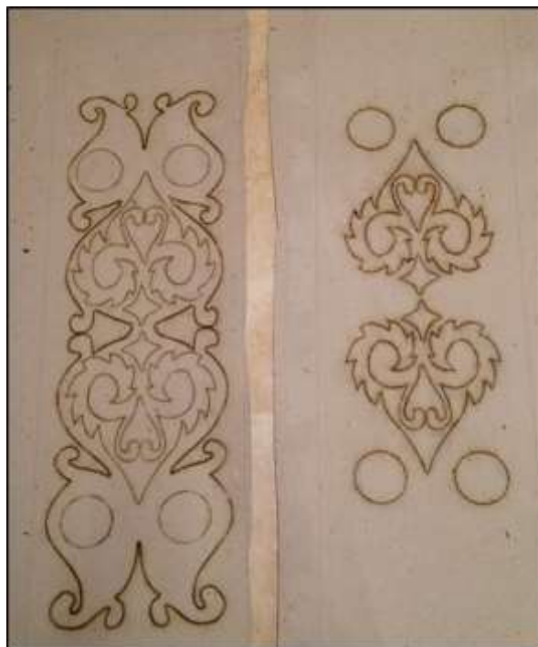
شكل (٧) الوحدة الزخرفية بعد فصلها لجزيين (أ/ب)

ثم فصل التصميم لجزيين (أ، ب)، وادخال العينة ببرنامج الأليستور (Illustrator) وتنفيذ التصميم لجزيين. كما يوضح شكل (٧)