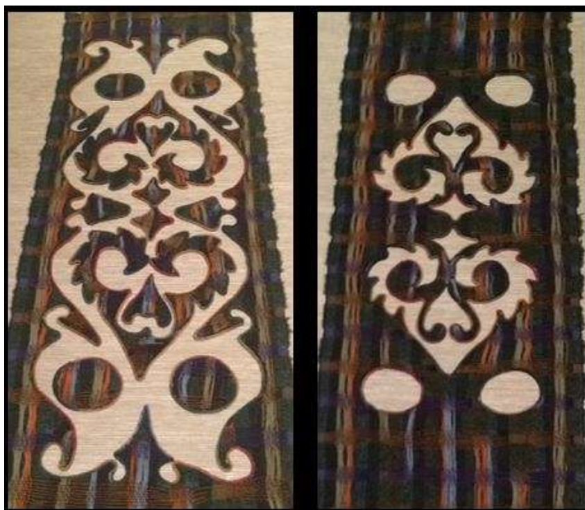
شكل (١٠) القطعة النسجية بعد ترتيب أطراف القص وانتهاء العمل.

ثم تركيب على أطراف التفريغ خيط من الصوف المموج بنفس الألوان المستخدمة في عملية النسيج لإبراز حدود القص وترتيب أطراف التفريغ. كما يوضح شكل (١٠)