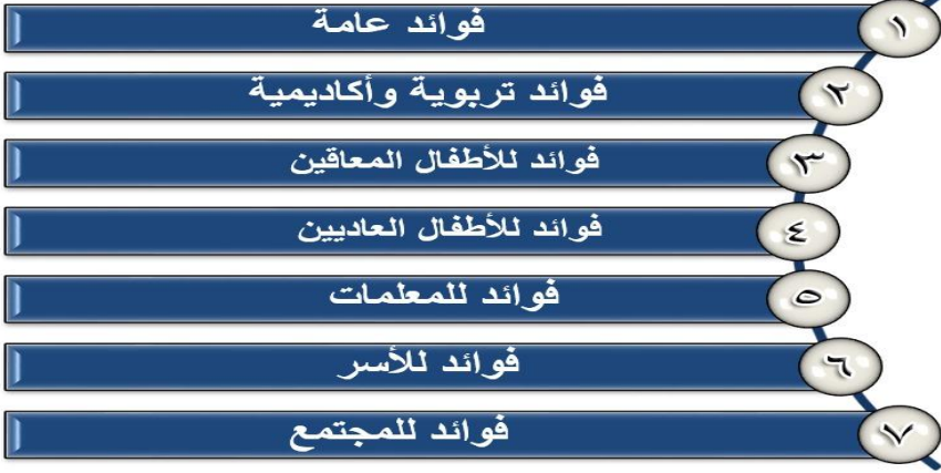
شكل (١) فوائد الدمج