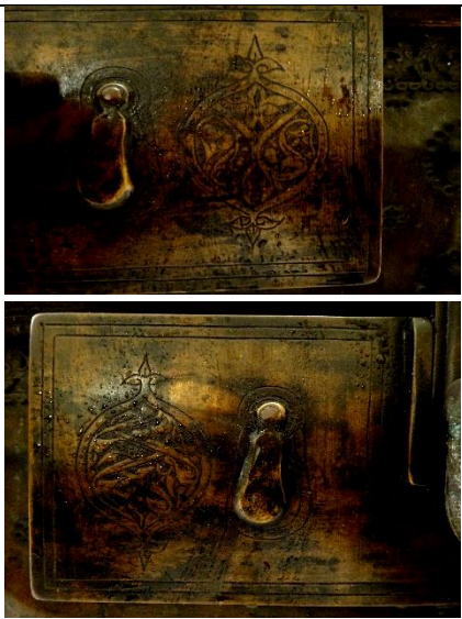
لوحة رقم (١٠) تفصيل لآخاراف قفل الصندوق