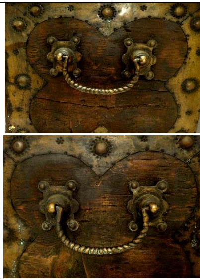
لوحة رقم (٩) منظر عام لمقابض الصندوق من الجانبين.