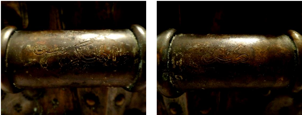
لوحة رقم (٨) تفصيل لآخاراف وكتابات قفل الصندوق من الجانب الأخر.