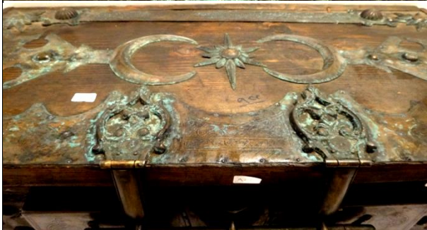
لوحة رقم (٦) تفصيل لزخارف غطاء الصندوق وقفله.