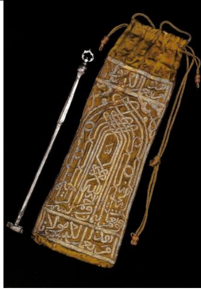
لوحة رقم (٢٤) مفتاح الكعبة مصنوع من الفضة باسم السلطان مراد الرابع مؤرخ بسنة ١٠٣٩هـ / ١٦٢٩م، محفوظ بمتحف طوبقابي ساي باسطنبول تحت رقم ٢١/١٦، طول المفتاح ٢٦سم. عن: -حلمى ايدين: آثار الرسول في جناح الأمانات المقدسة في متحف قصر طوبقابي باسطنبول، ص ١٥٤، ١٥٥.

-https://kolayarapca1.wordpress.com/index