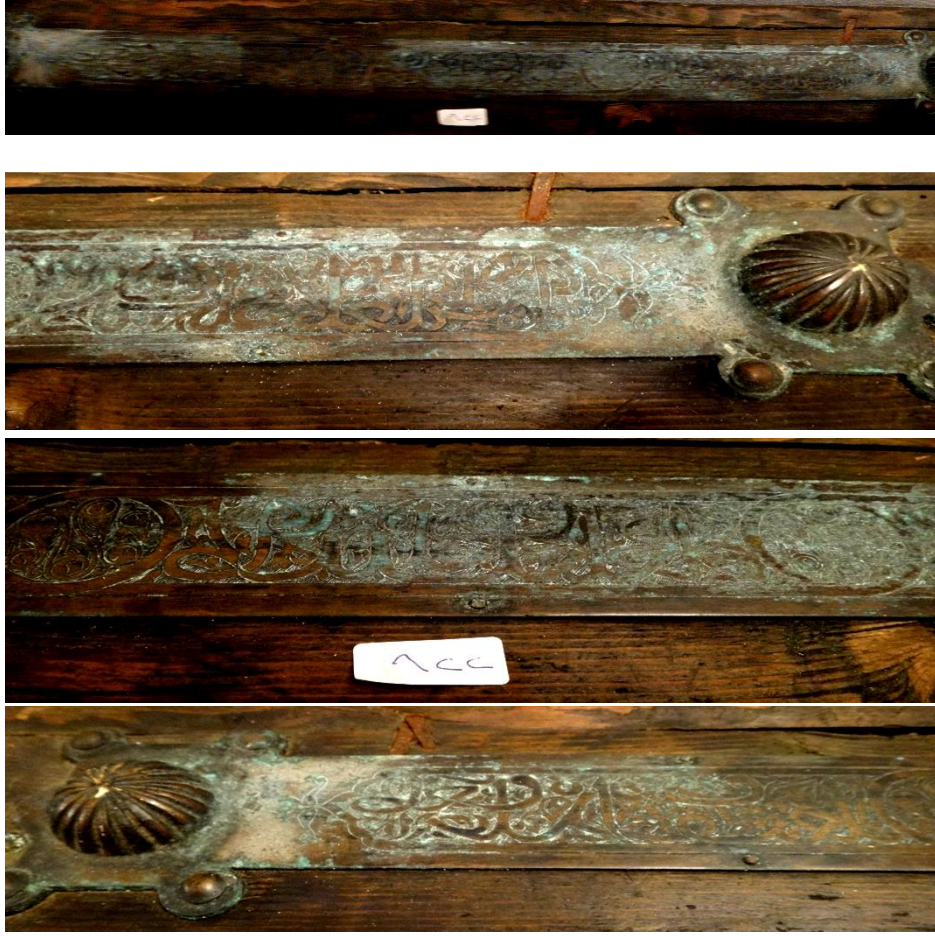
لوحة رقم (١٠) تفصيل لكتابات غطاء الصندوق من أعلى.