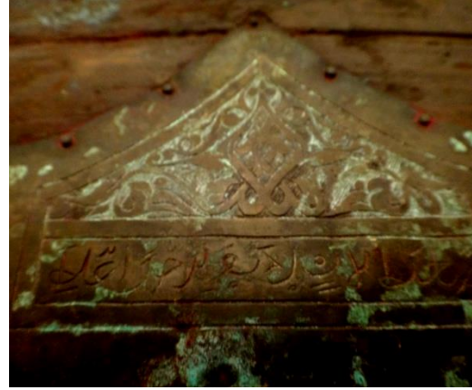
لوحة رقم (٢٠) تفصيل لكتابات وزخارف غطاء الصندوق.