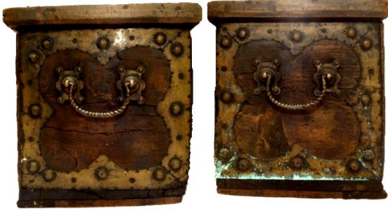
لوحة رقم (٤) منظر عام لجانبى للصندوق