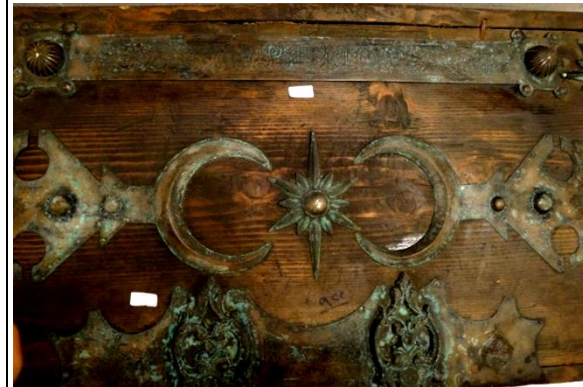
لوحة رقم (٥) منظر عام لغطاء الصندوق