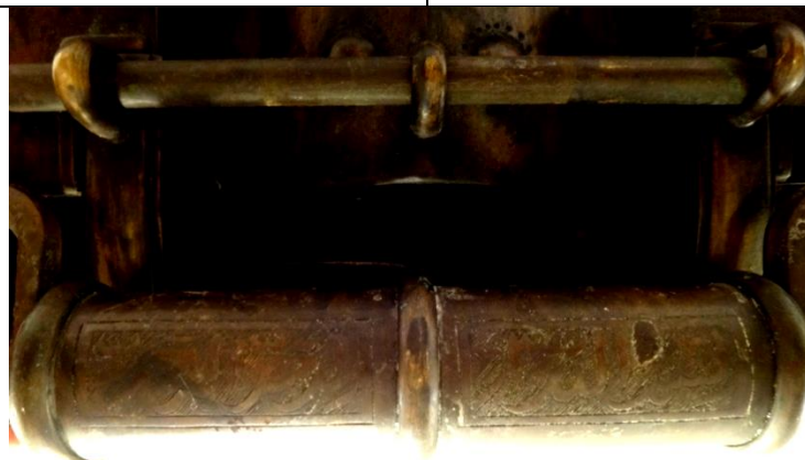
لوحة رقم (٦) منظر عام لقفل الصندوق.