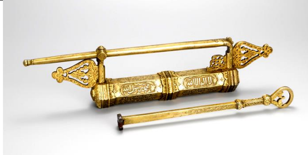
لوحة رقم (٢٥) مفتاح وقفل الكعبة من الفضة مطلى بالذهب باسم السلطان إبراهيم مؤرخ بسنة ١٠٥٦هـ / ١٦٤٦م، طول المفتاح ٢٥سم وطول القفل بالكامل ٢٧سم، طول البدين ٢٢سم، عرضه ٤سم.