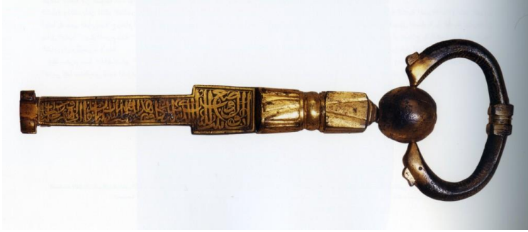
لوحة رقم (٢٣) مفتاح الكعبة مصنوع من النحاس باسم السلطان بايزيد الثاني مؤرخ بسنة ٨٩٠هـ / ١٥٠م، محفوظ بمتحف طوبقابي ساي باسطنبول ، طول المفتاح ٢٤سم. عن:

-https://kolayarapca1.wordpress.com/index