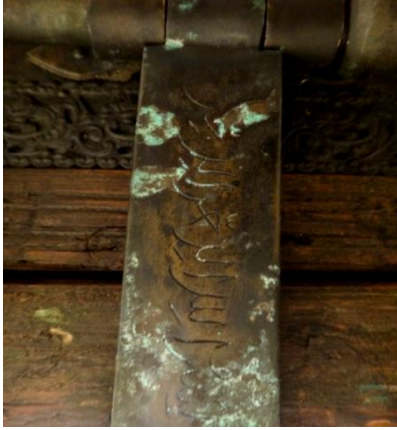
لوحة رقم (٢١) تفصيل لكتابات ظهر الترياس