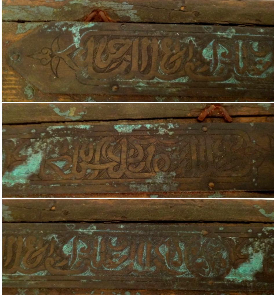
لوحة رقم (٢٢) تفصيل للنص الكتابي العلوي لغطاء الصندوق بخط الثلث