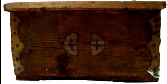
لوحة رقم (٣) منظر عام لظهر للصندوق