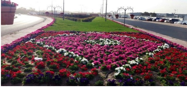
شكل (١٠) الإهتمام بالتشجير بالمدارس