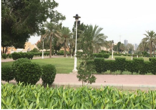
(شكل ١٢) الاهتمام بإنشاء حدائق بالمرافق الصحية العامة للدولة