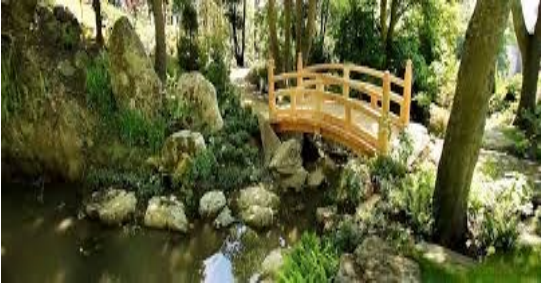
شكل ٣ الحدائق الصينية

في عزلة عن الناس والحياة، لذا صممت الممرات طويلة كوسيلة للتأمل وطول التمتع بكل منظر وأنشئت القناطر التي تضيف جمالا خاصا حيث الشكل المقوس [1] : (شكل ٣).