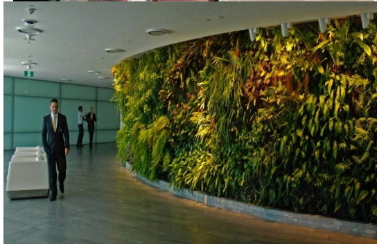
ممر بمنطقة عمل