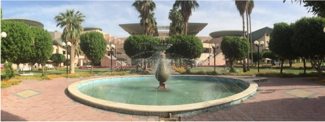
(شكل ١١) الإهتمام بإنشاء حدائق بالمرافق التعليمية العامة للدولة