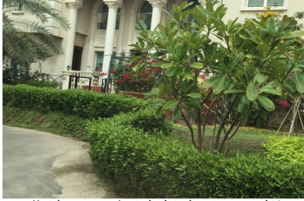
(شكل ١٥) حدائق المنازل الخاصة.