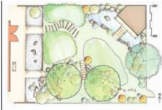
شكل ٤ الحدائق اليابانية

أ. الحدائق المنبسطة: Flat Garden حيث تستعمل دائما في المساحات الصغيرة