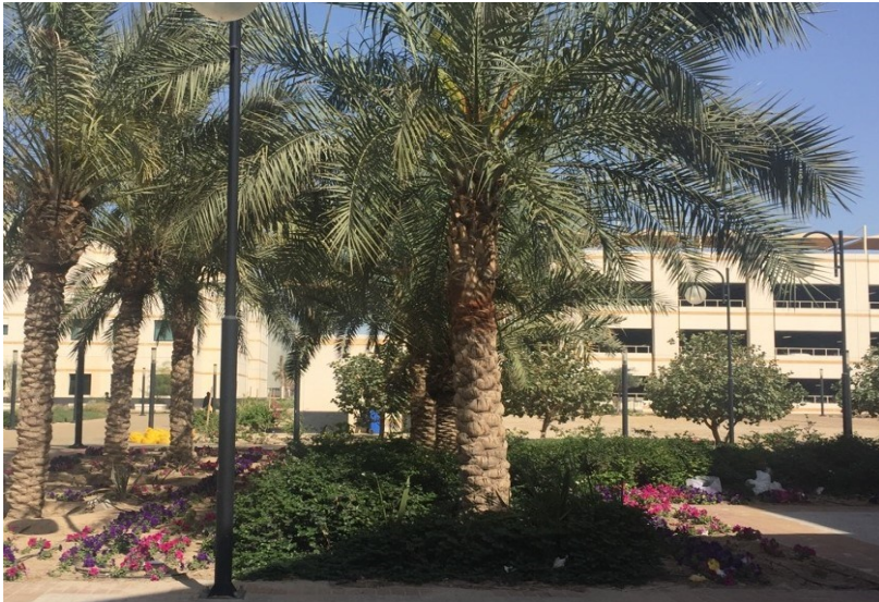
شكل (١٠) الإهتمام بالتشجير بالمدارس