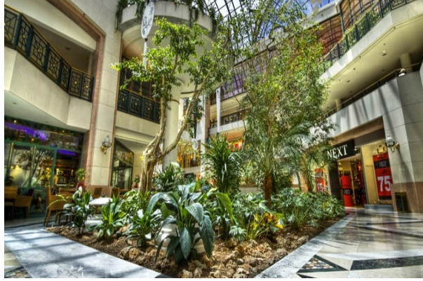
360 Mall ( شكل ١٤ ) إنشاء حدائق مصغرة في المراكز التجارية -

امتد الاهتمام بالتشجير وإضافة مساحات خضراء إلى مراكز التسوق التجارية المختلفة ( شكل ١٤ )، فنراها اقتطعت مساحات من المساحة الإجمالية للمجمعات التجارية وأماكن ارتياد الأفراد للتبضع وتخصيصه كمنطقة خضراء حيث أثبتت الدراسات تأثيرها الإيجابي على إراحة العين، كسر جمود المبنى، تقلل التوتر النفسي وتبث فيه الحياة، كما تعمل على تنقية الأجواء وترفع نسبة الأكسجين خصوصا الأماكن المكتظة.