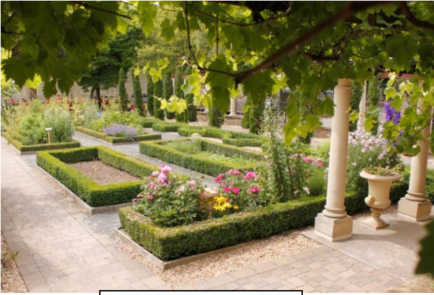
شكل ٥ الحدائق

أول حديقة من نوع نبات واحد هو حديقة أفلاطون المشجرة بالزيتون فقط وكانت عبارة عن فناء داخلي محاط بأعمدة. وفي بيوت الأغنياء كان الفناء الداخلي (الحوش) محاطا بالمزهريات والمنحوتات بالأزهار وقد أضيف لها المسابح والعناصر المعمارية الأخرى مما جعلها مصدر الهام لحضارات لاحقة.