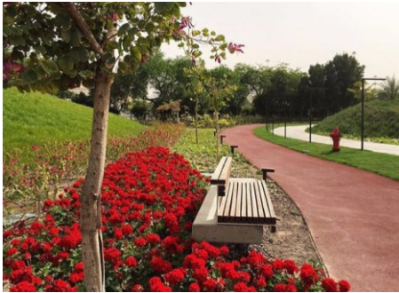
الاهتمام بإنشاء حدائق بالمرافق الترفيهية العامة للدولة (شكل ١٣)