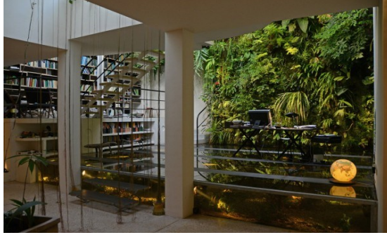
عمل حلول رأسية لحدائق داخلية (شكل ٩)