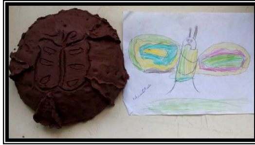
صورة (١٣) تطبيق شكل شبه مجسم ومعالج سطحه باستخدام الحز و الغائر والبارز والتثقيب الغير نافذ لشخصية كرتونية مشهورة لدي العينة (فراشة)