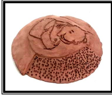
صورة رقم (١) تطبيق باستخدام الحز وإضافة وعمل ملابس لشخصية كرتونية مشهورة لدي العينة (دبوبي)