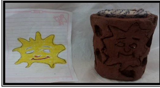
صورة (٩) تطبيق شكل مجسم ومعالج سطحه باستخدام الحز والتفريغ لشخصية كرتونية مشهورة لدي العينة (شموسة)