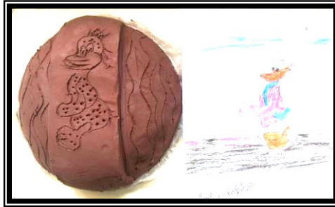
صورة (٦) تطبيق باستخدام الحز والإضافة وعمل ملامس لشخصية كرتونية مشهورة لدي العينة (بطوط)