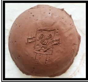
صورة رقم (١) تطبيق باستخدام الحز لشخصية كرتونية مشهورة لدي العينة (سبونج بوب)