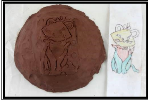
صورة رقم (٧) تطبيق باستخدام الحز لشخصية كرتونية مشهورة لدي العينة (قط قوطه )