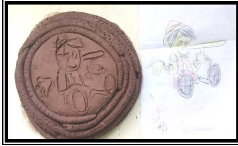
صورة (٥) تطبيق آخر باستخدام الحز والإضافة وعمل ملامس مختلفة على السطح مع استخدام الحبال في التشكيل لشخصية كرتونية مشهورة لدي العينة (الولد ذو المنخار الكبير)