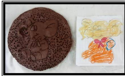
صورة رقم (٤) تطبيق اسلوب الغائر والبارز والحز وعمل ملابس لشخصيه كرتونيه لدي العينه (فلافيو)