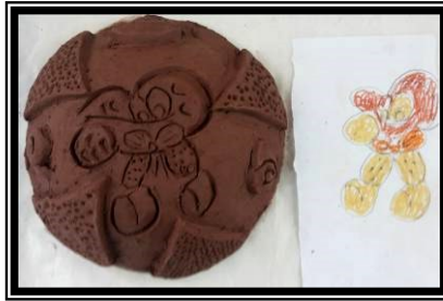
صورة رقم (٢) تطبيق باستخدام الحز وإضافة وعمل ملابس لشخصية كرتونية مشهورة لدي العينة (بطوط)