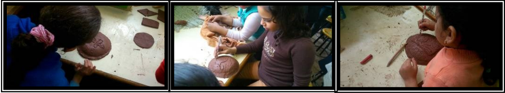
صورة رقم (١٠) بعض طلاب العينة أثناء تنفيذ بعض المشغولات