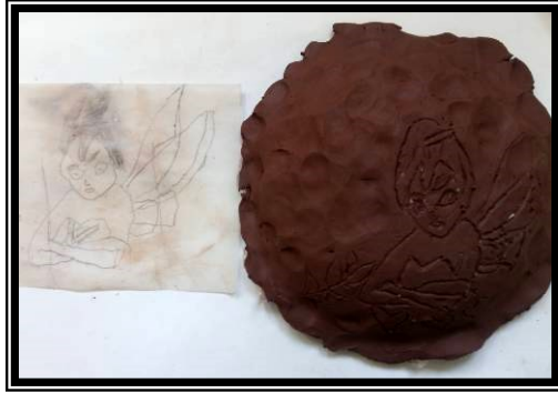
صورة رقم (٥) تطبيق باستخدام الحز لشخصية كرتونية مشهورة لدي العينة (شموسه)