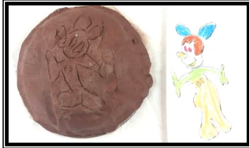
صورة رقم (٨) تطبيق باستخدام الحز لشخصية كرتونية مشهورة لدي العينة (ميكي ماوس)