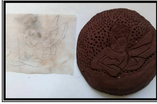
صورة (١٢) تطبيق شكل شبه مجسم ومعالج سطحه باستخدام الحز والغائر والبارز والتثقيب الغير نافذ لشخصية كرتونية مشهورة لدي العينة (شموسة)