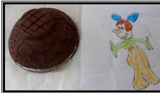
صورة (١١) تطبيق شكل شبه مجسم ومعالج سطحه باستخدام الحز والتنقيب الغير نافذ لشخصية كرتونية مشهورة لدي العينة (مكي ماوس)