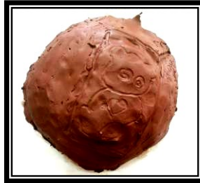
صورة رقم (٢) تطبيق باستخدام الحز لشخصية كرتونية مشهورة لدي العينة (دبوب)