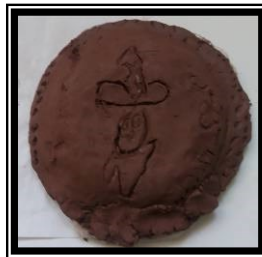
صورة رقم (٤) تطبيق باستخدام الحز لشخصية كرتونية مشهورة لدي العينة