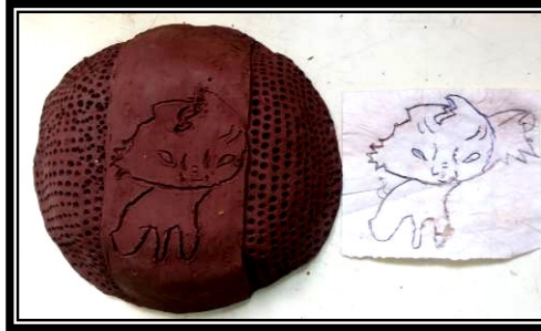
صورة (٧) تطبيق آخر باستخدام الحز والإضافة وعمل ملامس لشخصية كرتونية مشهورة لدي العينة (قطعة)