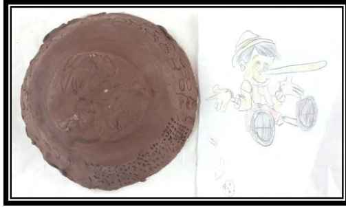
صورة رقم (٦) تطبيق باستخدام الحز وإضافة وعمل ملابس مختلفة على السطح لشخصية كرتونية مشهورة لدي العينة (الولد ذو المنخار الكبير)