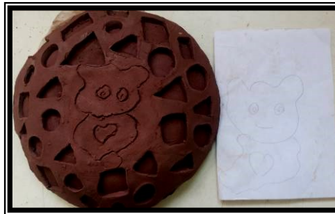
صورة (٨) تطبيق آخر باستخدام الحز والإضافة والتفريغ لشخصية كرتونية مشهورة لدي العينة (قطعة)