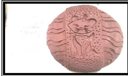
صورة رقم (٣) تطبيق باستخدام الحز وإضافة وعمل ملابس مختلفة على السطح لشخصية كرتونية مشهورة لدي العينة (قطعة)