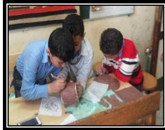
صورة رقم (٣) بعض طلاب العينة أثناء تنفيذ بعض المشغولات