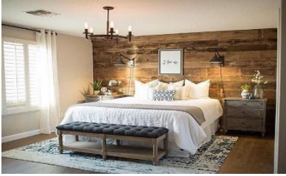
تبسيط الطراز الروستيك في تصميم الغرفة وجعله معاصراً، واستخدام التجاليد الخشبية في تجليد الحائط الخلفي للسريير.