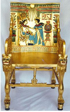
عرش الملك توت عنخ امون (الدولة المصرية القديمة)

ظهر في فرنسا في عهد نابليون مع بداية القرن التاسع عشر، وهو طراز دخيل غير