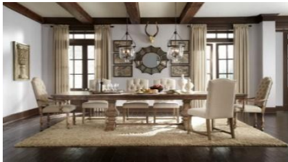
وضوح الطراز الروستيك القديم في الأرجل الخشبية للمنضدة، مع استخدام عروق خشبية في الأسقف والاستعانة ببعض اللوحات الحديثة للدمج بينها وبين الروستيك القديم.