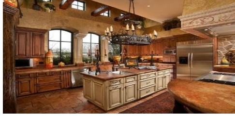
يتميز بمعالجة الطراز الروستيك بطريقة عصرية مع استغلال كافة مساحات المطبخ