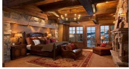
وضوح استخدام الاخشاب بكثرة في كافة أنحاء الغرفة و توظيفها في الأسقف و الأرضيات و النوافذ مع استخدام الجلد المدبوغ في كسوة ظهر السريير وهذا ما يتسم به الروستيك القديم.