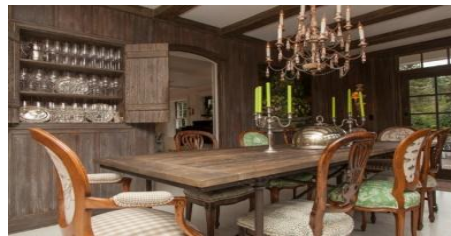
تم تجليد حوائط الغرفة بالأخشاب مع استغلالها كأماكن للتخزين بشكل مبسط و حديث، كما تم دمج طرز أخرى مختلفة من الكراسي تتناسب مع الطراز الروستك.