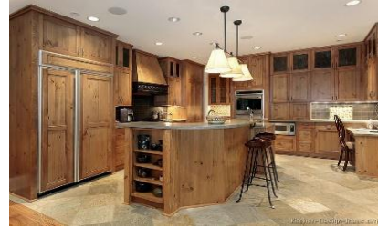
يتميز بقوة البانوهات التي يتسم بها الطراز الروستيك القديم، واستخدام العروق الخشبية في الأسقف، واستغلال مساحة منتصف المطبخ لوضع الحوض.