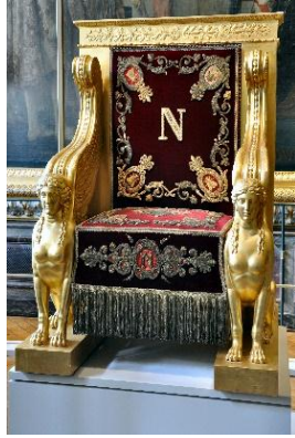
عرش الامبراطور نابليون بونابرت (الطراز الامبراطوري)

فرنسي المظهر، وإنما هو محاولة لترجمة الفنون الكلاسيكية و الأشورية و المصرية القديمة ترجمة فرنسية.