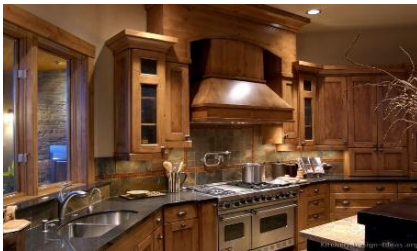
يتميز باستغلال كافة مسطحاته الرأسية في تنفيذ متطلبات مستخدمى المطبخ.