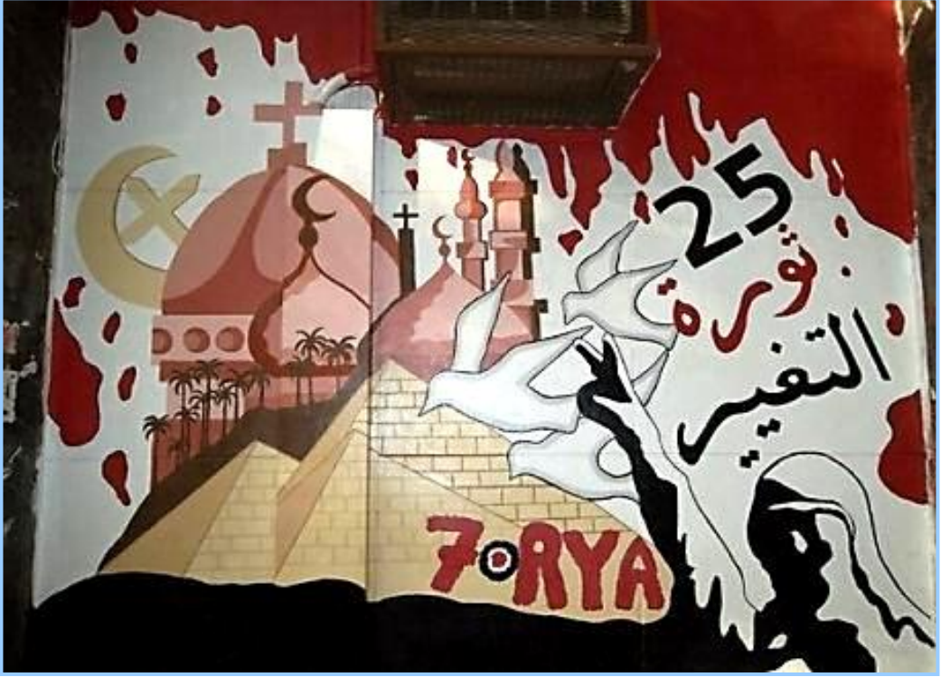
(شكل ٩) جرافيتي لثورة ٢٥ يناير

وكما تجلت ثورة ١٩١٩ بمبدعها العبقري محمود مختار الذي عبر عن هذه الثورة بعمله النحتي الخالد "تهضة مصر" وهو عمل مناسب لطبيعة هذه الثورة بينما اصبح الجرافيتي جزء لا يتجزأ من ثورة يناير، حيث يعتبر دليلاً على حيوية هذا الفن وأن رسامي الجرافيتي ثائرون وأصحاب رؤية ، كما ان بعض التيارات الدينية تقوم بكتابة أدعية أو آيات قرآنية احياناً فوق الرسوم وتزيلها تماما في احيان اخرى. وبتاريخ (٢٠١٢/١٦/٧) تشكلت مجموعات من الشباب الهواة والمحترفين، مارست الأعمال الجرافيتية واللوحات المعلقة واللافتات المعبرة عن كل الأحداث والأفكار، ونفذتها على الأرصفة ووسط الميدان، كما كان في: (التحرير، السويس، الإسكندرية). وغالبية تلك الرسومات أنجزت ليلاً، وكانت تبقى طوال اليوم التالي، ذلك حتى تتجدد بأخرى، تضاف إلى جانب القديم في الليلة التالية. بدأت أعمال الجرافيتي بعد ثورة ٢٥ يناير حريصة على الإشادة بالشهيد وتمجيده. وكان ذلك بوضع صورة الشهيد وحده في لوحة خاصة منفردة، أو أن يكون فيها محاطاً بأفرع شجرة، كما كانت توضع أحياناً، صور فوتوغرافية مكبرة للشهيد أو رسومات له. وقد تضمنت تفصيلاً حول اسم الشهيد "أدرج أسفل الصورة" كما ظهر حرص بعض الأعمال، على رصد