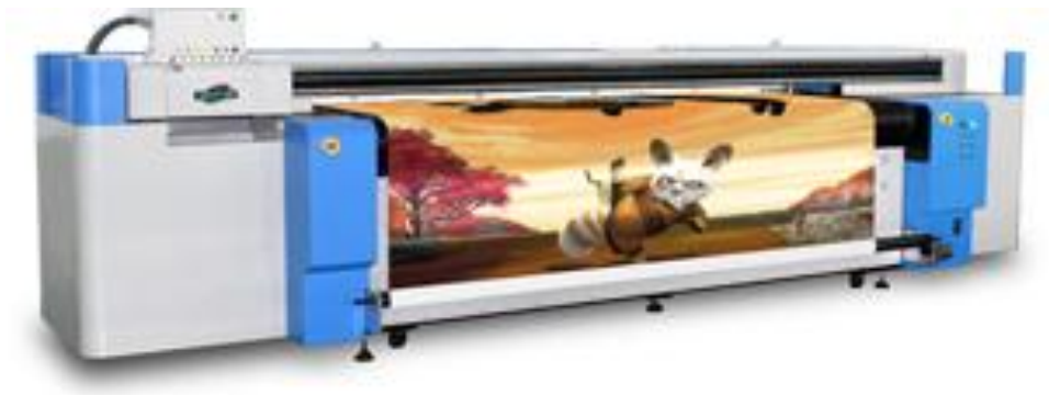
(شكل ١٣) آلة الطباعة الرقمية على الفينيل والفليكس