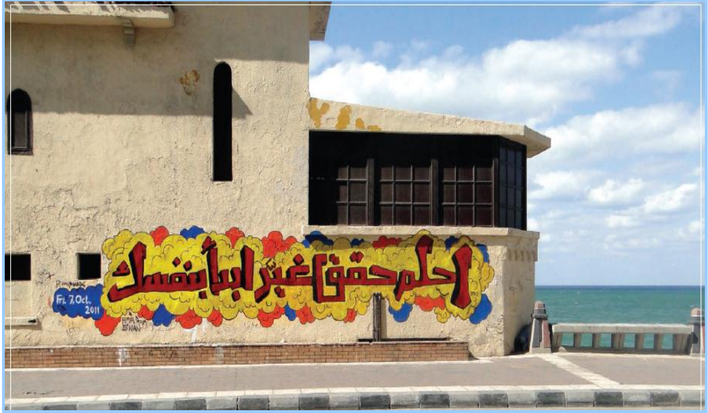
(شكل ١٠) يوضح استخدام الحوائط والحوائط في المحافظات لتوثيق الأحداث وتطورها

وفي عصرنا الحالي يحاول الفنانون أن يوجهوا رسالة أخرى بان فن الجرافيتي ممكن أن يكون رمزا للفن وتجميل الشوارع وما إلى ذلك من الأعمال الفنية برسومات معبرة. فهو يمكن أن يؤثر على البيئة المحلية من خلال تحسين بعض البيئات الحضرية مثل الأراضي المهجورة أو المهملّة، وتحويل الأنفاق والمباني القديمة والمهجورة. لتصبح مشرقة.