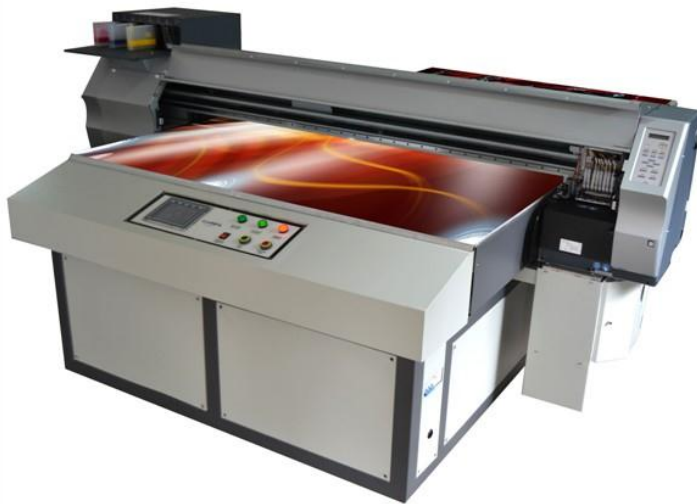
(شكل ١٥) آلة الطباعة على الألواح المعدنية