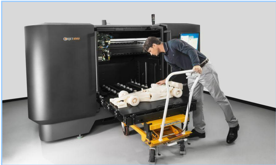
(شكل ١٧) آلة الطباعة الرقمية ثلاثية الأبعاد

الطباعة المجسمة "3 D" هي عملية لتصنيع أجسام ثلاثية الأبعاد (مجسمة) من خلال ملف رقمي. صنع المطبوعات المجسمة يتم من خلال عملية "الإضافة". في عملية الإضافة، يتم تخليق الجسم عن طريق رص طبقات متتالية من الخامة فوق بعضها البعض حتى يكتمل شكل الجسم. كل طبقة من هذه الطبقات يمكن اعتبارها كشريحة رفيعة مأخوذة من مقطع عرضي في الجسم النهائي. (شكل ١٧) يوضح آلة الطباعة الرقمية ثلاثية الأبعاد