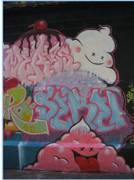
( شكل ٢ ) جرافيتي يوضح استخدام خامات متنوعة في الرسم والخط