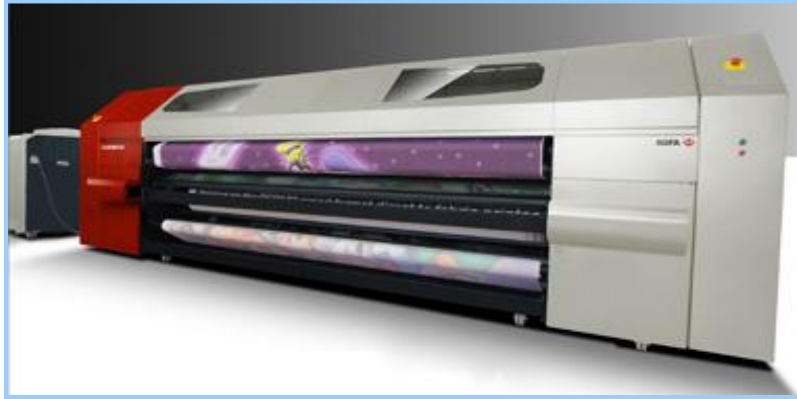
(شكل ١٢) آلة الطباعة الرقمية على الاسطح ذات الطبيعة النسيجية