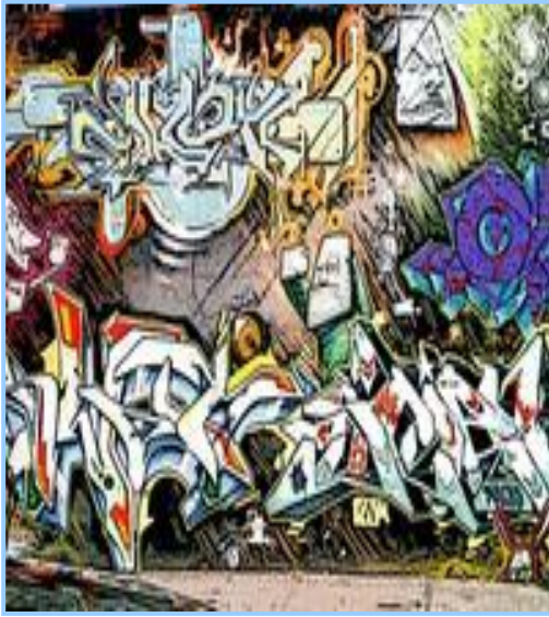
( شكل ٣ ) جرافيتي يوضح استخدام خامات متنوعة في الرسم والخط

لهذا الغرض كما تستخدم طريقة الطباعة باستخدام قطع الكرتون المقوى المشكل أو المفرغ حسب الشكل المطلوب تنفيذه بسرعة كما تستخدم طريقة طباعة الاستنسل باستخدام قطع من البلاستيك ونقريغه وملئ الفراغات لتحقيق الغرض المطلوب كما تستخدم عملية لصق الصور الفوتوغرافية والتلوين عليها والكتابة واستغلال ما بها من موضوعات معبرة كما يستخدم فن الكولاج بلصق مجموعة من قصاصات الورق والأقمشة وقطع البلاستيك وبعض الخامات المتنوعة التي تستخدم في فن التصوير الجداري بشكل عام مثل الموزاييك وقطع الخرقة والسيراميك. (٩٩)