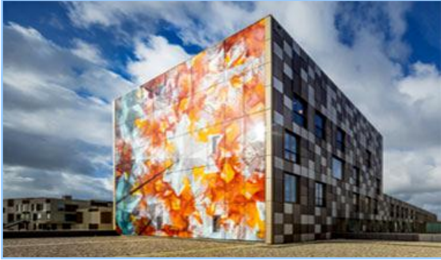
(شكل ١٦) احد الابنية المنفذة باستخدام الطباعة الرقمية

استخدام الطباعة المجسمة في لوحات الجرافيتي :