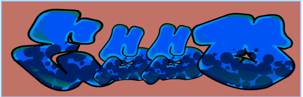
(شكل ٦) جرافيتي لواجهة مصنع - نيويورك