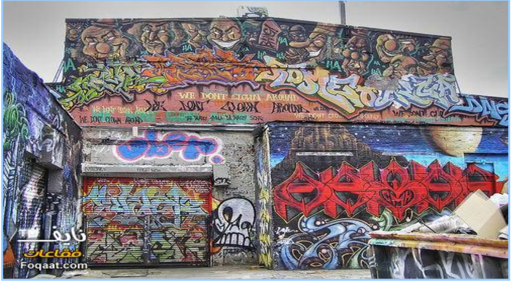
(شكل ٧) جرافيتي غنى بالعناصر التشكيلية - نيويورك

٤ - فن شعبي خالص: يتسم فن الجرافيتي بروح الفنون الشعبية الخالصة نظراً لالتحامه الوثيق بالشعوب خاصة بالطبقات الفقيرة والوسطى من العالم وقد أستمّر فن الجرافيتي بمفهومه القديم منذ العصور البدائية القديمة وتطور طبيعياً بتطور الإنسان وحضاراته المختلفة وسمى في الحضارات بفن النقوش الجدارية أو التصوير الجداري، أما في الحياة الشعبية فقد أستمّر وتلون بلون المناطق التي أنتجتهم مثل لها قيمة كبيرة حيث ارتبطت موضوعاته بالعادات والتقاليد والمناسبات الاجتماعية والدينية، فظهر في صورة رسومات مباشرة على أسطح المباني الشعبية كرسوم الحج على سبيل المثال وغيرها، وأخذ شكله المعروف بظهره كما سبق القول في المناطق الغربية وأصبح له سمات ومقومات عالمية، ولكن مع ذلك فإن سمات الفن الشعبي والإقليمي مازالت باقية فيه خالصة، ولكن تطورت بتطور فكر الإنسانية من منطقة لأخرى، ففي المناطق النائية والتي يقوم بتنفيذ أعمال الجرافيتي مجموعة من الفنانين الشعبيين ذو الثقافة الفنية المحدودة التنفيذ سابقاً، وكان يعرف الجرافيتي بأنه فن الطبقات المحرومة والفقيرة والتي تهدف إلى التعبير عن نفسها بواسطة هذا الفن .. وتراوح أعمار رساموه عادةً بين الثامنة والثلاثين من العمر... ولكن الظاهرة ازدادت أكثر ولم يعد ذلك الفن محصوراً للفقراء عندما بدأت الطبقات الوسطى والراقية بالتعبير عن تمردها بهذه الطريقة.. لأنها أصبحت تمثل لهم شيئاً من الإحساس باليقظة