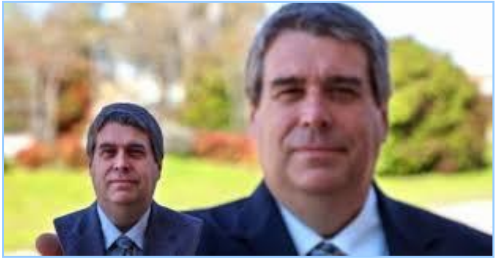
(شكل ١٨) نموذج لطباعة ثلاثية الأبعاد

يبدأ الأمر بعمل تصميمات تخيلية من الأجسام التي نريد أن نصنعها أو نستعين بها في تصميم لوحات الجرافيتي . هذا التصميم التخليقي تم تخزينه في ملف كاد (التصميم بمساعدة الكمبيوتر CAD: Computer Aided Design) عن طريق برنامج رسم 3d (وهذا لصنع مجسم جديد بالكامل) أو باستخدام ماسح ثلاثي الأبعاد 3D Scanner (لنسخ مجسم موجود بالفعل). الماسح يقوم بصنع نسخة رقمية من مجسم ما، ومن ثم يضعها في برنامج رسم 3d. لتجهيز الملف الرقمي المصنوع باستخدام برنامج رسم 3d للطباعة، يقوم البرنامج بتقطيع الرسم النهائي إلى مئات أو آلاف من الطبقات العرضية. وعندما يتم رفع هذا الملف المجهز إلى الطابعة 3d، تقوم الطابعة بتخليق المجسم طبقة طبقة. الطابعة تقوم بقراءة كل شريحة (صورة مسطحة) وتبدأ في تخليق المجسم من خلال مزج هذه الطبقات سوياً بدون ترك أي علامة تفصل بين الطبقات وبعضها، مما ينتج في النهاية مجسم واحد ثلاثي الأبعاد يمكن استخدامه في تنفيذ لوحات الجرافيتي في الميادين العامة. وشكل رقم (١٨) يوضح نموذج لطباعة ثلاثية الأبعاد .