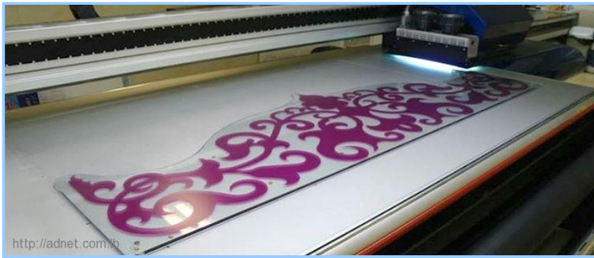
(شكل ١٤) آلة الطباعة الرقمية على الزجاج