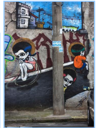
(شكل ١) يوضح تفصيلات فن الجرافيتي من أحد أعمال الفنان والترنمورا Walter Nomura بسان باولو والتي تتناول قضايا أطفال الشوارع