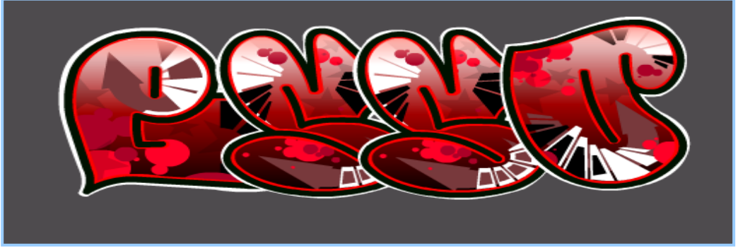
(شكل ٤) جرافيتي تحويل لكلمة esso