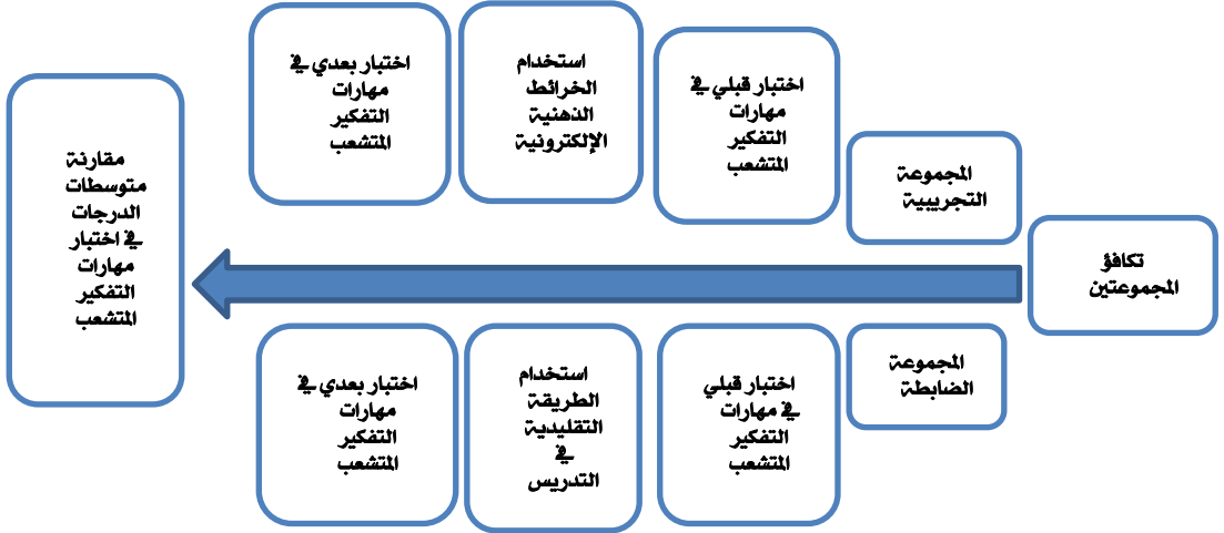
شكل (١): (التصميم التجريبي للبحث)