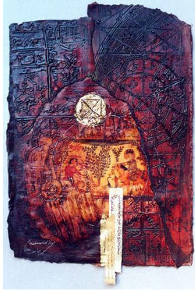
شكل (١٠) - محمود حامد- أيقونة سحرية- عجائن وصبغات واكريلك وخامات اخرى على خشب- ٣٠×٣٠سم- ٢٠٠٠. (١)