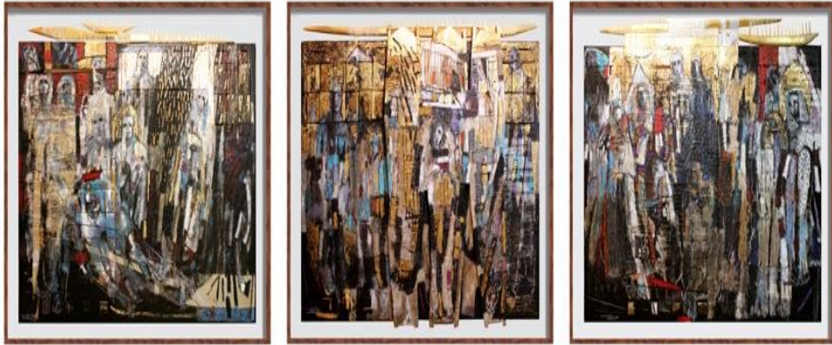
شكل (٦.أ،ب.ج)- وائل درويش - مراكب الشمس تستعد للرحيل - وسائط متعددة مخلوطة على الخشب وألوان أكريلك ١٩٧× ٧٦٥سم - ٢٠١٢.