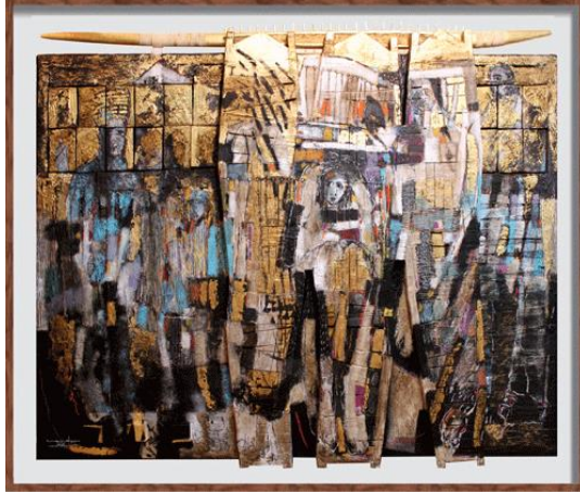
شكل (٧) - تفصيلة من العمل السابق