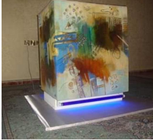
شكل (٤) عماد ابوزيد - تشكيل بخامات مختلفة وإضاءة- مجسم ٥٥×٦٨ ارتفاع ٨٠سم- المعرض العام، ٢٠١٤. (١)