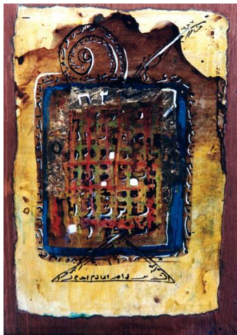
شکل (٢) عماد ابوزيد - احدى القطع من الذاكرة الهامشية- كولاج وخامات متعددة - ٢١x٢٧سم - ١٩٩٩. (١)