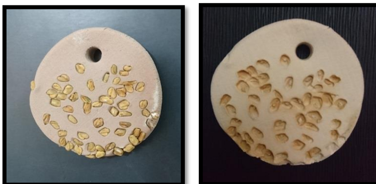
شكل(16) الصورة على اليمين تظهر استخدام بذور الحلبة في تشكيل قطعة من الحلي الخزفي، وفي الصورة على الشمال يظهر تأثيرها الشكلي بعد الحريق الأول لها على درجة حرارة حريق 950°م، بالإضافة إلى ظهور لون بني محمر.

ويتضح من النتيجة السابقة تأثير التركيب الكيميائي لبذور الحلبة لونها على سطح قطعة الحلي بعد حرقها بسبب وجود نسبة عالية من الحديد بها 85.99 ملجم/كجم مما أدى إلى ظهور اللون البني المحمر ، أما باقي العناصر لم يظهر تأثيرها اللوني بشكل واضح .