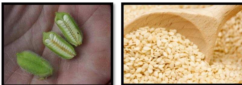
شكل(4) الصورة على اليمين بذور السمسم، والصورة على الشمال ثمار السمسم التي تحتوي على البذور(5)

ويتضح مما سبق عدم وجود العناصر المعدنية التي تؤثر لونها في الخزف .