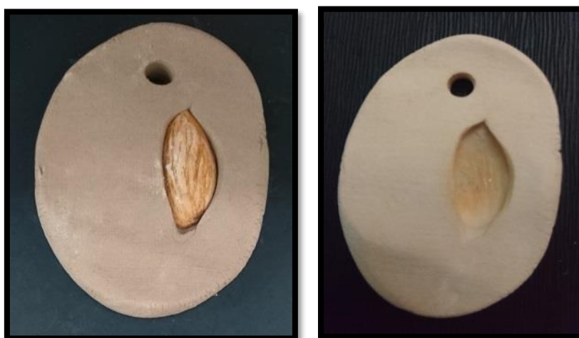
شكل (23) في الصورة على اليمين استخدام اللوز في تشكيل قطعة من الحلي الخزفي، وفي الصورة على الشمال يظهر تأثيرها الشكلي بعد الحريق الأول لها على درجة حرارة حريق 950°م، بالإضافة إلى ظهور درجات من اللون البني المحمر واللون الأسود والأخضر الفاتح .

ويتضح من النتيجة السابقة تأثير التركيب الكيميائي للوز بإحداث لون بني محمر على سطح قطعة الحلي بسبب وجود نسبة 0.9 ملجم/100 جم من الحديد ، ويظهر أيضا اللون الأسود المخضر الفاتح لوجود المنجنيز بنسبة 1.2 ملجم/100 جم، والنحاس نسبته 0.5 ملجم/100 جم.