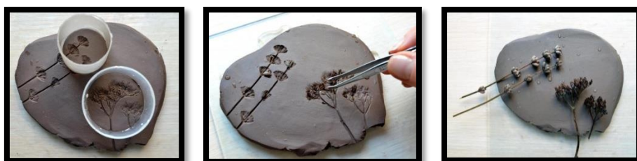
شكل(10) نموذج لخطوات تنفيذ الحلي من الطين في مرحلة اللدونة بضغط بعض الثمار في الطين

4- تشكيل قطعة الحلي من الطينة اللدنة مع إضافة البذور أو الثمار إليها بضغطها في أماكن محددة من التصميم.