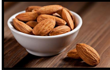
شكل (7) اللوز

تثمر بعض أشجار اللوز ثماراً حلوة المذاق، بينما يثمر بعضها ثماراً مرة. ويستخرج من كلا النوعين الزيت. وتعتبر اللوزات الحلوة طعاماً متميزاً فتؤكل بعد رفع القشرة الخشبية القاسية التي تغلفها، ويحتوي اللوز على نسبة 9.0 ملجم/100 جم من الحديد ، ومن المنجنيز نسبة 1.2 ملجم/100 جم، أما النحاس فنسبته 0.5 ملجم/100 جم. (8)