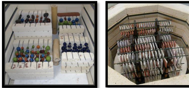
شكل(14) يظهر في الصورة على اليمين طريقة رص قطع الحلي قبل حرقها بحيث تترك مسافة بين كل قطعة وأخرى على أسلاك النيكل كروم المعلقة على حوامل حرارية، أما الصورة على الشمال فتظهر بعض الحلي بعد أن تم حرقها.