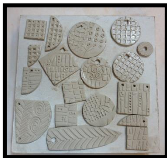
شكل(11) الحلي الخزفية في مرحلة التجفيف بعد تشكيلها