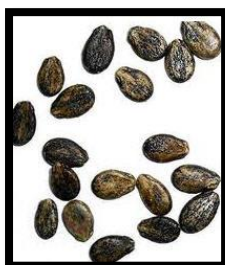
شكل(5) بذور البطيخ