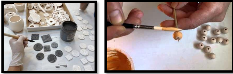
شكل(12) تطبيق الطلاء الزجاجي باستخدام الفرشاه على قطع الحلي المحروقة حرقا أوليا