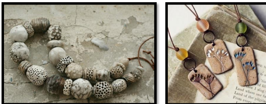
شكل(15) نماذج لحلي خزفية تم استخدام البذور والثمار في تشكيلها ويتضح التأثير الشكلي الناتج على سطح الحلي.(6)

ومن أهم ملونات الخزف ( الحديد ويعطي اللون البني المحمر، المنجنيز الذي يعطي درجات الأسود، النحاس والكروم ي سببان اللون الأخضر ، والكوبلت يعطي اللون الأزرق)، وبالطبع تختلف درجة اللون تبعاً لنسبة العنصر المستخدم في التلدين، بالإضافة لنوع الطلاء أو الطينيات...، وفي حالة استخدام البذور فإن التأثير اللوني الناتج يكون متوقف على نسبة وجود هذه العناصر الملونة بها ، فقد لا تعطي بعض النباتات والبذور أي لون لعدم وجود العناصر الملونة بالرغم من غناها بالعناصر الأخرى.