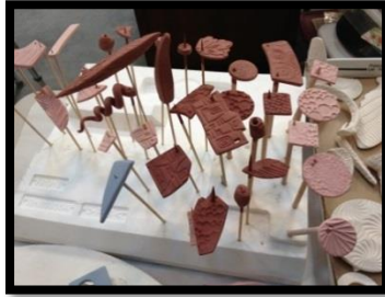
شكل(13) تجفيف الحلي الخزفية بعد طلائها بالطلاء الزجاجي