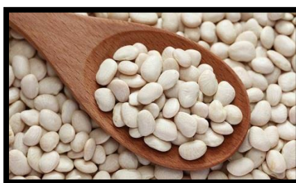
شكل (3) فاصوليا بيضاء

تعد الفاصوليا البيضاء من البذور ذات القيمة الغذائية العالية فهي تحتوي على حمض الفوليك، البروتين، الكربوهيدرات، الألياف بالإضافة إلى المعادن والفيتامينات (4)، وتحتوي الفاصوليا على 24.9ملجم/100جم من عنصر الحديد، و0.47ملجم/100جم من عنصر النحاس. (9)