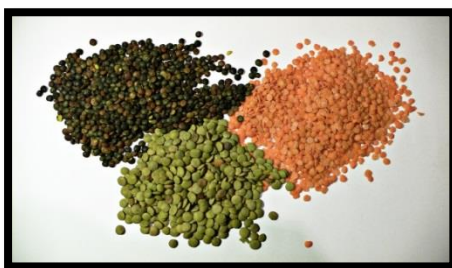
شكل (1) بذور العدس بألوانه المختلفة (3)

العدس نبات ينتمي إلى الفصيلة البقولية، يزرع في مصر وبلاد الشام وجنوبي أوروبا والولايات المتحدة وإيران وتركيا. يُعتبر من المحاصيل المؤسسة للحضارة، بذوره ذات لون بني يميل إلى الحمرة، أو رمادي أو أسود، ولايزيد قطرها إطلاقاً عن 13مل، يحتوي العدس على نسبة عالية من الألياف، البروتينات والحديد، حيث يحتوي العدس على نسبة 50% حديد من إجمالي المعادن المكونة له. (15)