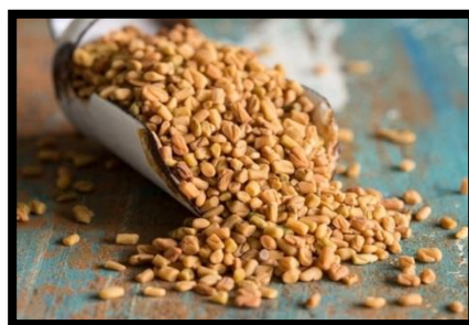
شكل(6) بذور الحلبة

وفي دراسة أخرى أظهرت وجود عنصر الكوبلت في بذور الحلبة بنسبة 1.3ملجم/كجم. (1)