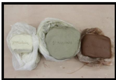
شكل(9) الطين الأسواني بلونه البني المحمر، والطين الحجري بلونه الرمادي الفاتح ، وطين البورسلين بلونه الأبيض الناصع