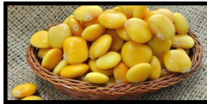
شكل (8) الترمس

يعتبر محصول الترمس من المحاصيل الغذائية الهامة بالنسبة للإنسان والحيوان ويتميز هذا المحصول بارتفاع نسبة البروتين في البذور حيث تصل نسبته إلى 30 - 40 % ونسبة الكربوهيدرات 34 % بالإضافة إلى ارتفاع نسبة الزيت إلى 18 - 28%. (15) ويحتوي على نسبة عالية من الحديد 95.7 ملجم/كجم، ومن المنجنيز 65.2 ملجم/كجم ، ونسبة قليلة من النحاس 10 ملجم/كجم. (11)