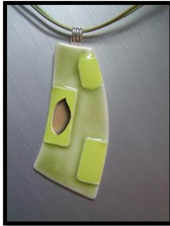
شكل(27) تصور مقترح لتصميم قطعة من الحلي الخزفية بإضافة التشكيل باللوز لقطعة حلي خزفية مطلية بطلاء زجاجي أخضر لامع.