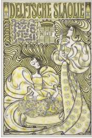
شكل (١) بوستر كتاب بعنوان (Delftsche Slaolie) للفنان جان توروب Jan toorop في عام ١٨٩٣م https://www.wikiart.org/en/jan-toorop/delft-salad-oil-1893

بداياته الاولى على المقتبسات من الفنون الاخرى التى تظهر لنا من انتقال النواه الاولى لهذا الاسلوب من اليابان لدول اوروبا وامريكا. ومن اشهر فناني هذا الاتجاه الفنان الهولندي جان توروب " Jan toorop " شكل رقم (١) والفنان وليام موريس " William Morris " شكل رقم (٢)