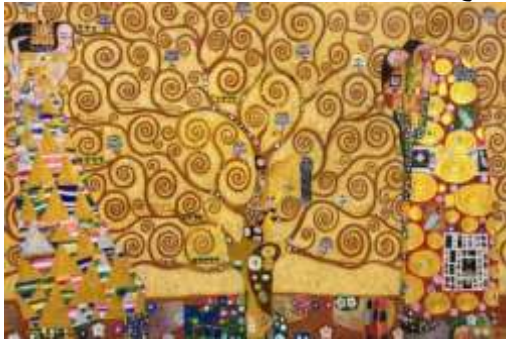
شكل (٦) احد اعمال الفنان جوستاف كليمت عام ١٩٠٩م باسم شجرة الحياه

بينما من الناحية اللونية فقد استخدم الفنان اللون الذهبي وهو اللون الرئيسي للوحة بكونه اللون البارز والظاهر في البقعه الرئيسييه في التصميم. وقام الفنان أيضا باستخدام درجات الابيض والاسود داخل المستطيلات الموجوده بأحجام مختلفه على ملابس الرجل حيث هذا التنوع في الحجم يعطي احساس بالانتران بينما المرأه يظهر على ملابسها دوائر ملونه ومتنوعه الحجم أيضا مما يدل على تأثره بالفن المصري القديم . كما يتحقق في هذا التصميم الإيقاع عن طريق الإيقاع الحر والذي تختلف فيه شكل الوحدات عن بعضها البعض اختلافا تاما وبالتالي تحققت الوحدة مع التنوع عن طريق ترابط الأشكال مع اختلاف حجمها لأحداث ترابط فني.