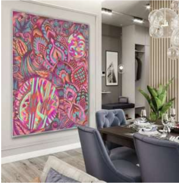
شكل (٢٦) التوظيف الافتراضي المقترح.