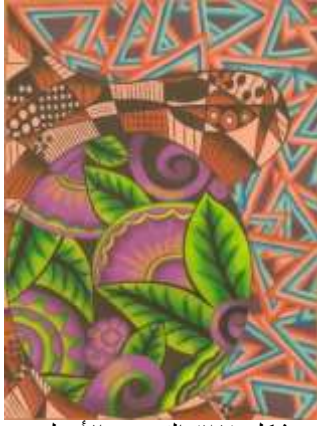
شكل (٢١) التصميم الأصلي

بعد إجراء التأثيرات المختلفه علي التصميم حدث تغير طفيف في شكل التصميم وحدث تغير اكبر في الالوان الخاصه به عن التصميم الرئيسي حيث تغير اللون البنّي خلف المتلثات تماما حيث يظهر باللون البيج مع تهشير بسيط باللون البنّي وايضا يوجد تهشير بسيط على المتلثات في وضع افقي على اللون الازرق وايضا وجود بعض الملامس على اللون البرتقالي والبنفسجي لإحداث شكل جمالي مختلف كما يوضح شكل (٢٢) ويوضح شكل (٢٣) التوظيف الافتراضي المقترح للحل الابتكاري.