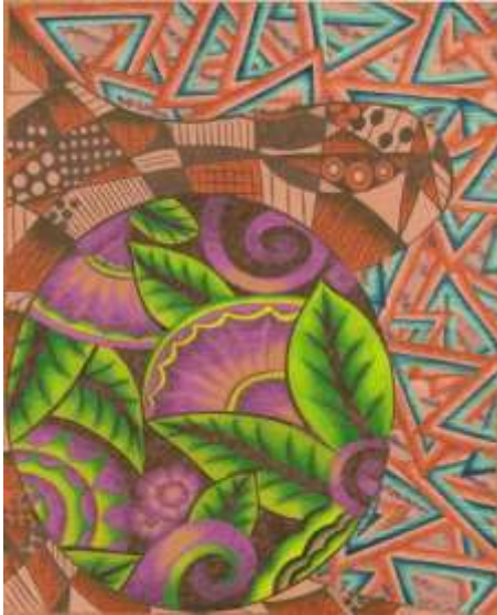
شكل (٢٢) التصميم المعلق بعد إجراء التأثيرات التحليل الفني للتجربه :-

بعد إجراء التأثيرات المختلفه علي التصميم حدث تغير طفيف في شكل التصميم وحدث تغير اكبر في الالوان الخاصه به عن التصميم الرئيسي حيث تغير اللون البنّي خلف المتلثات تماما حيث يظهر باللون البيج مع تهشير بسيط باللون البنّي وايضا يوجد تهشير بسيط على المتلثات في وضع افقي على اللون الازرق وايضا وجود بعض الملامس على اللون البرتقالي والبنفسجي لإحداث شكل جمالي مختلف كما يوضح شكل (٢٢) ويوضح شكل (٢٣) التوظيف الافتراضي المقترح للحل الابتكاري.