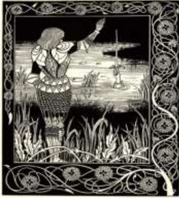
شكل (٨) احد اعمال الفنان اوبرى بيردسلى لبوستر كتاب توماس مالورى عام ١٨٩٣م

اللوحة حقق عنصر السيادة في اللوحة، فحقق الفنان التركيز في كتلة اللون الاسود اسفل اللوحة والتي تحتوى على زخارف عضويه تشبه زخارف الفن البيزنطى والفن المصرى القديم. كما يتحقق الايقاع في هذا العمل الفنى عن طريق الايقاع الحركى الحر حيث تختلف الاشكال والمسافات بين الاشكال اختلافا تاما عن بعضهم البعض. ولقد استخدم اوبرى بيردسلى تقنيات الرسم الزيتى باللون الابيض والاسود والذى كان مميز له فى اعماله الفنيه، حيث ان الابيض يرمز الى الحيويه والنور بينما الاسود يرمز الى الغموض مما ينتج عن استخدامهما معا احساس بالماحيده والتوازن.