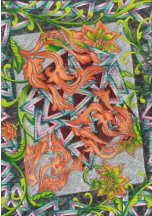
شكل (١٧) التصميم المعلق بعد إجراء التأثيرات

بعد إجراء التأثيرات المختلفه على هذا التصميم المستمد من الفن الجديد والفن الزخرفى بواسطه الملامس والفلاتر الموجوده فى برامج الحاسب الالى الحديثه حيث حدث تغير فى جميع الدرجات اللويه مما يعطى احساس بان الاشكال مجسمه كما هو موضح فى اللون البنى مع بعض الملامس والتشويرات الموجوده فى وضع افقى داخل المثلثات والتشويرات العشوائيه الموجوده على اللون الرصاصى مما يعطى احساس بالتنوع كما يوضح شكل (١٧) ويوضح شكل (١٨) التوظيف الافتراضى المقترح للحل الابتكارى.