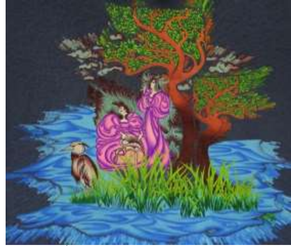
شكل (١٩) التصميم المعلق بعد إجراء التأثيرات

تغير في بعض الألوان مما ساعد علي تعميق بعض الالوان وتفتيح الوان اخرى مع وجود بعض التهشيرات وظهور ملامس مختلفه داخل المساحات اللونه الاخرى والخلفيه مثل التي توجد على اللون الاخضر والبنّي مما تعطي أحساس بالبعد الثالث للعناصر كما يوضح شكل (١٩) ويوضح شكل (٢٠) التوظيف الافتراضي المقترح للحل الابتكاري .