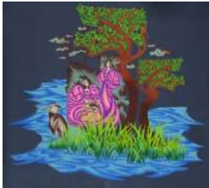
شكل (١٨) التصميم الأصلي

تعتمد هذه الفكرة التصميمية على الجمع بين العناصر النباتية والشخصية الرئيسية المستوحاه من الفن الجديد الارت نوفو Art Nouveau حيث وزعت بمساحات مختلفة في أرجاء التصميم لتتلامس وتتجاور فيما بينها مع التنوع في أشكال الوحدات مع الخطوط المنحنية المقتبسه من زخارف الفن الجديد وقد تم تنظيم وتوزيع تلك العناصر التشكيلية مما عمل على تحقيق الإحساس بالانتران وأضفي التنوع في المساحة. أما المجموعه اللونيه فقد استخدمت الباحثه مجموعه من الألوان وهي درجات الاخضر ودرجات البنفسجي ودرجات الأزرق ودرجات البني كما يوضح شكل (١٨).