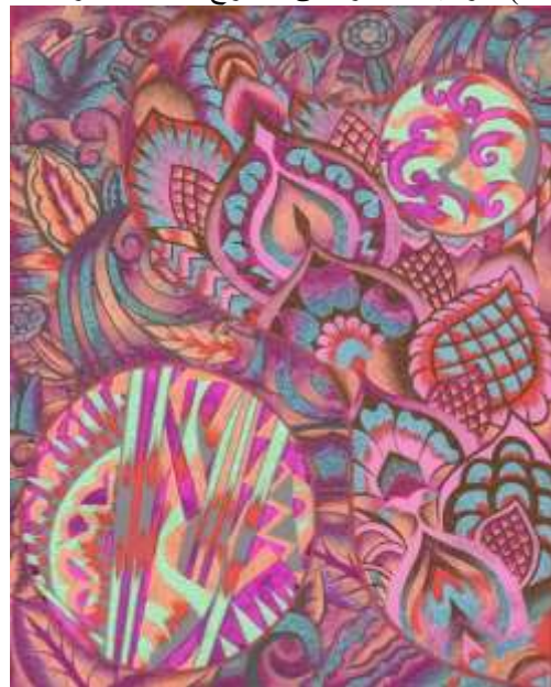
شكل (٢٥) التصميم المعلق بعد إجراء التأثيرات

بعد إجراء التأثيرات المختلفه على التصميم المبتكر من زخارف الارث ديكو ادى الى تعميق بعض الألوان وتفتيح الأخرى مما نتج عنه إختلاف في بعض الدرجات اللويه عن التصميم الأصلي ويعطي شكل جمالي مختلف حيث تظهر الالوان متداخله مع بعضها البعض مضاف عليها تأثيرات وملامس متنوعه تضفى للتصميم الرقى والبساطه في ذات الوقت كما يوضح شكل (٢٥) ويوضح شكل (٢٦) التوظيف الافتراضي المقترح للحل الابتكارى .