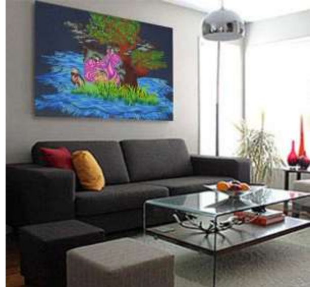
شكل (٢٠) التوظيف الافتراضي المقترح

ثانيا: التصميمات المبتكره من عناصر الفن الزخرفي Art Deco والتوظيف الافتراضي المقترح