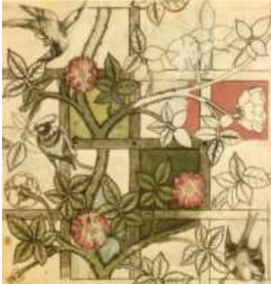
شكل (٢) بعنوان عرش الازهار للفنان وليام موريس William Morris في عام ١٨٦٢م https://ar.m.wikipedia.org/wiki/%D9%85%D9%84%D9%81:William_Morris_design_for_Trellis_wall_paper_1862.jpg

وكذلك الفنان البريطاني " وليام موريس William Morris "