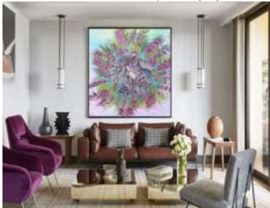
شكل (١٧) التوظيف الافتراضي المقترح