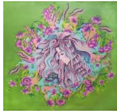
شكل (١٥) التصميم الأصلي