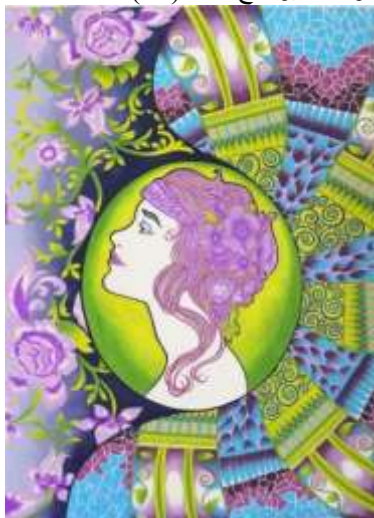
شكل (١٣) التصميم الأصلي

أعتمد هذا التصميم في بنائه علي عنصرين اساسيين هما الأشكال الهندسيه والخطوط المستقيمه المستوحاه من الفن الزخرفي الارث ديكو Art Deco والخطوط المنحنيه المستوحاه من الفن الجديد الارث نوفو Art Nouveau والتي تظهر في العناصر المستلهمه من الزخارف النباتيه وتداخل الخطوط معها لتعطي إحساس بالإيقاع الحركي في التصميم، والشخصيه الرئيسييه المستوحاه من الفن الجديد ايضاً في مركز اللوحه وهى امراء تنزين بناج من الزهور الطبيعيه حيث ان هذه الزخارف تعطي تناغمات خاصه عند دمجها مع بعضها البعض وإستنباط زخارف وتكوينات جديده تتميز بالإصالة وأستخدمت الباحثه مجموعه من الألوان هي درجات الأخضر ودرجات البنفسجي ودرجات التركواز الفاتح ودرجات الرمادي والأسود كما يوضح شكل (١٣).