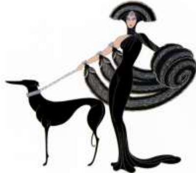
شكل (١١) تحت عنوان : (Symphony in Black) من تصميم الفنان الروسي Erté عام ١٩٥٩م

كان إرتي يقضي إجازته في جزيرة موريشيوس، في الساحل الجنوبي الشرقي لإفريقيا ، وعندما مرض تم نقله إلى منزله في باريس، وتوفي إرتي وهو أستاذ في تصميم الأرت ديكو في باريس عام ١٩٩٠م عن عمر يناهز ٩٧ عاما، تاركًا وراءه إرثًا لا يزال له تأثير كبير على الفن والتصميم في العديد من المجالات مثل الأزياء والمجوهرات وفنون الجرافيك ، الأزياء والمسرح .