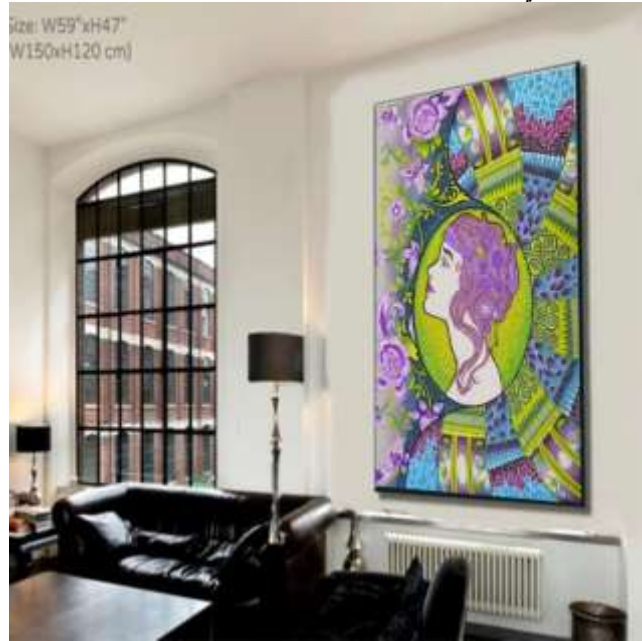
شكل (١٥) التوظيف الافتراضى المقترح

بعد إجراء التأثيرات المختلفه على التصميم المبتكر بواسطه الملامس والفلاتر الموجوده فى برامج الحاسب الالى الحديثه تبين تغير فى بعض الألوان مما ساعد على تعميق اللون الازرق وتفتيح الأسود مع وجود بعض التأثيرات عليها وإختلاف بعض الدرجات اللويه وظهور ملامس مختلفه داخل المساحات اللويه الأخرى مثل التى توجد على اللون البنفسجى لاحداث التجسيم كما يوضح شكل (١٤) ويوضح شكل (١٥) التوظيف الافتراضى المقترح للحل الابتكارى .