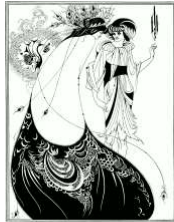
شكل (٧) احد اعمال الفنان اوبرى بيردسلى تحت عنوان تنورة الطاووس عام ١٨٩٤م

كان بيردسلى الفنان الأكثر إثارة للجدل فى عصر الفن الجديد الذى اشتهر بصوره المظلمه والظواهر المثيرة التى كانت الموضوعات الرئيسيه لعمله الأخير فكانت رسومه باللونين الأسود والأبيض على خلفيه بيضاء وبعض رسومه مستوحاة من الأعمال الفنيه اليابانيه، أنتج اوبرى بيردسلى رسوم توضيحيه كثيرة للكتب والمجلات وأشهر الرسوم التوضيحيه المثيرة له تتعلق بمواضيع التاريخ والأساطير. وقد تأثر بشكل كبير بطراز الفن الحديث والشعور الجريء بالتصميم الموجود فى النقوش الخشبييه اليابانيه. وفى عام ١٨٩٧ تدهورت صحته وقد عانى من نزيف رئوي متكرر وكان فى كثير من الاحيان غير قادر على العمل أو مغادرة منزله وتوفى بعد ذلك عام ١٨٩٨ فى فندق كوزمبوليتان فى مونتون فرنسا عن عمر يناهز ال ٢٥ عاما. وفيما يلى سوف نتقدم بأشهر اعماله الفنيه :