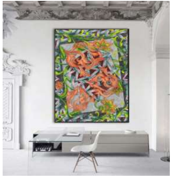
شكل (١٨) التوظيف الافتراضي المقترح.