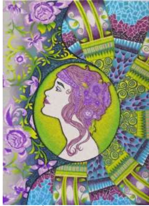
شكل (١٤) التصميم المعلق بعد إجراء التأثيرات