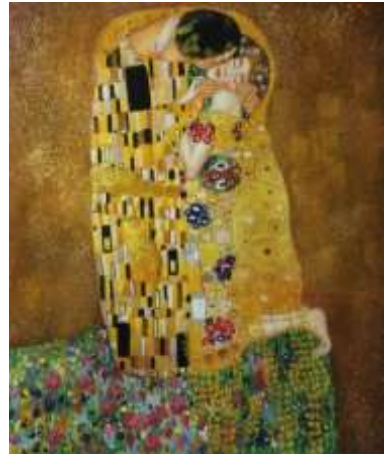
شكل (٥) احد اعمال الفنان جوستاف كليمت عام ١٩٠٧م باسم القبلة

وقد تميز كليمت بأسلوبه واعماله الزاهيه ذات الالوان المشعه والتي تجمع بين النزعة التعبيرية ورمزية التزيين فنجد ان كليمت اهتم كثيرا برسم جسد المرأه فالمرأه تعتبر عنصر اساسي في معظم لوحات وجداريات واعمال جوستاف كليمت, مما جعل الكثير يطلقون عليه نقاشا ويقدموا له العديد من الانتقادات نظرا لجرأته ولهذه الجرأه اصبح اسلوبه فيما بعد واحدا من اهم المدارس الفنيه, ولقد تمرد كليمت على القواعد والأساليب التقليديه التي كانت راجحة في عصره وكان مناصر قويا لأساليب الفن الحديث فأكد مدير متحف "belvedere" أن غوستاف كليمت بلا شك أيقونة الفن الحديث وانه واحد من أعظم الرسامين المزخرفين في القرن العشرين , وتأثر كليمت أيضا برسم الأشكال او الشخصيات مع دمج بعض الزخارف التي استنبطها من الفنان المصري القديم, حيث تمتع بشهرة كبيرة فأصبح أحد أبرز الفنانين في فيينا وكانت اعماله الفنيه معروفه برمزيته الشديده وصوره المثيرة. أصيب كليمت بجلطة مفاجئة شلت حركته وأضعفت قواه ليتوفى بعدها بشهر عن عمر الخامسة والخمسين عام, عام ١٩١٨م. ومن ثم سوف نتقدم بأشهر الاعمال الفنيه للفنان النمساوي جوستاف كليمت .