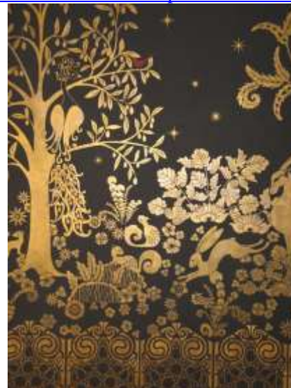
شكل (٤) احد اعمال المصمم ألبرت راتو Albert Rateau عام ١٩٢٢م

https://modernism.com/items/39/posters/619-548-original-french-art-deco-poster-maurice-lauro