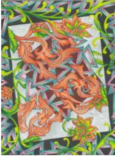
شكل (١٦) التصميم الأصلي

المميزة للفن الزخرفي الارثو ديكو Art Deco حيث ترابط هذه الوحدات الزخرفية الهندسية مع الوحدات النباتية والخطوط المنحنية لاحداث احساس بالطبيعه والراحه والاصاله فى التصميم, وقد استخدمت الباحثه مجموعه من الالوان وهى درجات البرتقالى ودرجات الاخضر ودرجات البنفسجى الفاتح ودرجات الازرق والبنى الغامق ودرجات الرصاصى الفاتح والغامق ايضا كما يوضح شكل (١٦).