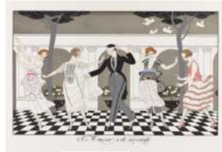
شكل (٩) احد اعمال الفنان جورج باربييه تحت عنوان الحب

بعد جورج باربييه أحد أعظم الرسامين الفرنسيين في أوائل القرن العشرين. ويشتهر بأعماله الأنيقة في فن الأرت ديكو "Art Deco" التي تأثرت بشدة بالاستشراق والأزياء الباريسية. ولد جورج باربييه في مدينة نانت بفرنسا عام ١٨٨٢ ، وكان يبلغ من العمر ٢٩ عاما عندما اقام معرضه الاول في عام ١٩١١م والذي كان مصدر شهرته واشتهر جورج باربييه أيضًا بكونه أحد " فرسان السوار " وهي عباره عن مدرسة للفنون الجميلة أطلق عليها Vogue لقب " فرسان السوار " تكريما لسلوكياتهم العصريه والمتألقه وأسلوب ملابسهم. فكان يتميز بأسلوب حياته واعماله الرائعه والتصميمات التي قام بها للمسرح والسينما والباليه, وحتى اليوم تحظى رسوماته الحديثه والعصريه بشعبية في جميع أنحاء العالم. وقام ايضا بتصميم المجوهرات والزجاج وورق الحائط وكتب العديد من المقالات لجريدة Gazette du bon ton المرموقة. وفي منتصف العشرينات من القرن الماضي عمل مع Erté وهو اسم مستعار يعتمد على النطق الفرنسي للأحرف الأولى من اسمه وهو مصمم فرنسي روسي لتصميم مجموعه من الأزياء Folies Bergère وحقق شعبية كبيرة من خلال ظهوره المنتظم في مجلة Elle وهي مجلة فرنسية عالمية تركز على أزياء المرأة , وتوفي باربييه في ١٦ مارس ١٩٣٢م في ذروة نجاحه , فيما يلي سوف نتقدم بأشهر اعماله الفنيه .