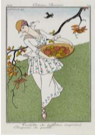
شكل (١٠) احد اعمال الفنان جورج باربييه تحت عنوان ازياء

يعتمد الفنان على استخدام اللونين الابيض والاسود كلونين سائدين في التصميم حيث ان اللون الاسود لون مميز يستخدم في الموضه والأزياء بشكل مثير للاهتمام حتى يومنا هذا. اما اللون الابيض هو اللون الأكثر شعبية واستخداماً من قبل المصممين كما أنه يدل على النقاء, كما انه استخدم اللون الوردى وهو لون أنثوي يدل على النعومة والرفقة ويرمز للرومانسيه والحب, وايضا استخدام الازرق الفاتح والذي يشير الى الهدوء والحكمه, مع استخدام الفنان اللون الرمادي الفاتح في ملابس الشخصيات وهو لون محايد ومتوازن ينتج عن مزج اللونين الأبيض والأسود بدرجات مختلفة. كما استطاع الفنان ان يعمل على توازن التصميم توازن متمثل بشكل مبدع فاذا افترضنا ان هناك خط في منتصف اللوحه فنجد ان العناصر الموجود في يمين اللوحه تتوازن مع العناصر الموجوده على يسار اللوحه حيث تميل شخصيه الرجل الى اليسار يوازنها بعض الطيور في الجهه الاخرى. يتحقق هنا الايقاع الغير رتيب حيث تتشابه جميع المسافات التي بين عناصر العمل الفني ولكن تختلف الوحدات الموجوده في التصميم شكلا او حجما او لونا اي تنكسر حدة الرتابه في التصميم كما هو موضح في اللوحه السابقه.