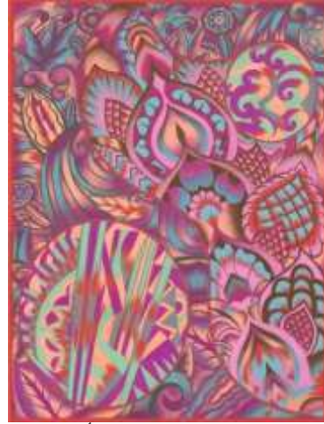
شكل (٢٤) التصميم الأصلي

يستوحى هذا التصميم من دمج الزخارف الهندسيه مع العناصر النباتيه التي تميل للهندسيه والتي توجد داخل الدائرتين والزخارف النباتيه ذات الشكل الهندسي المستوحاه من الفن الزخرفي الارث ديكو وقد تم تنظيم وتوزيع تلك العناصر التشكيليه حيث تضفى التنوع في المساحه ويقوم البناء التشكيلي لهذا التصميم على التنوع بين العناصر الهندسيه لعمل تكوين مبتكر يمزج بين جماليات الأشكال الهندسيه والوحدات الزخرفيه والعناصر النباتيه معا ، أما المجموعه اللويه فقد أستخدمت الباحثه مجموعه من الألوان مع بعض التهشيرات والتسيح للالوان وهي درجات البنفسجي ودرجات الازرق الفاتح ودرجه الاصفر الفاتح والتطعيم البسيط باللون البني الغامق كما يوضح شكل (٢٤).