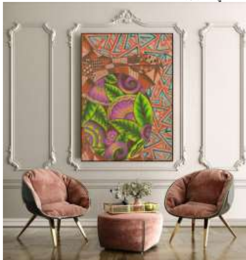
شكل (٢٣) التوظيف الافتراضي المقترح.

تغير في بعض الألوان مما ساعد علي تعميق بعض الالوان وتفتيح الوان اخرى مع وجود بعض التهشيرات وظهور ملامس مختلفه داخل المساحات اللونه الاخرى والخلفيه مثل التي توجد على اللون الاخضر والبنّي مما تعطي أحساس بالبعد الثالث للعناصر كما يوضح شكل (١٩) ويوضح شكل (٢٠) التوظيف الافتراضي المقترح للحل الابتكاري .