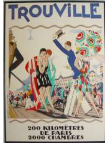
شكل (٣) المصمم موريس لاورو Maurice Lauro عام ١٩٢٧م

والذي اطلق عليه المعرض الدولي للفنون الزخرفيه والصناعه الحديثه (Menten Theodre, 1972). ولقد بدأت ملامح طراز الفن الزخرفي (Art Deco) في فرنسا عام ١٩٠٠ وبلغ قمه تطوره بين عامي (١٩٢٠-١٩٣٠م) ولم يزدهر الفن الزخرفي الا بعد الحرب العالميه الاولى حيث استلهم موضوعاته من مصادر فنيه مختلفه كفنون الحضارات القديمه والفن المصري القديم واتخذ مصممو الفن الزخرفي (Art Deco) زمام المبادرة مثال ذلك المصمم موريس لاورو والمهندس المعماري والمصمم لويس سو والذين أعجبوا بالتصميمات الخطية الأنيقة للفن الزخرفي وخطط كل من مصمميها عند عودتهم إلى باريس افتتاح استديوهات نموذجية للفن الزخرفي "Art Deco" فظهرت تصميماتهم المبتكرة بالفعل ذات عرض هندسي مميز للأشكال الطبيعية السائدة في للفن الزخرفي. ويوضح ذلك شكل رقم (٣)، (٤)