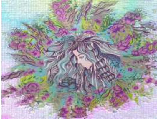
شكل (١٦) التصميم المعلق بعد إجراء التأثيرات

يوضح شكل (١٦) ويوضح شكل (١٧) التوظيف الافتراضي المقترح للحل الابتكاري .