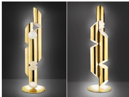
شكل رقم (17) وحدة إضاءة مكتبية من المعدن على شكل مجموعة من الأسطوانيات المشطوفة