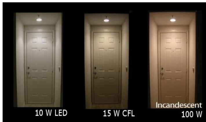
شكل رقم (1)

مقارنة بين إضاءة LED بقوة 10 W وموفر CFL بقوة 15 W الى جانب الإضاءة التقليدية بقوة W100