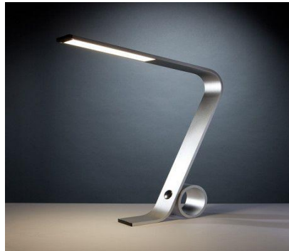
شكل رقم (16) وحدة إضاءة مكتبية من المعدن المطلي بالفضة