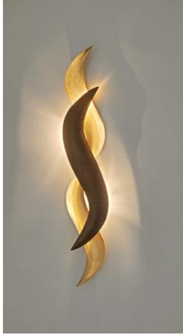
شكل رقم (3) أبليك من المعدن مستوحى من شكل الثعبان