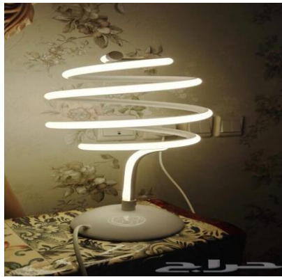
شكل رقم (15) وحدة إضاءة مكتبية حلزونية الشكل