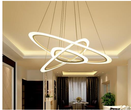
شكل رقم (11) معلقة من المعدن مستوحاة من شكل المدارات