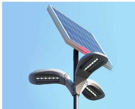
شكل رقم (35) إضاءة الشوارع بأعمدة الإنارة الذكية