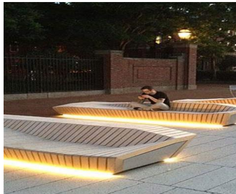
شكل رقم (31) نموذج (2) لإضاءة أماكن الجلوس في الحدائق والشوارع