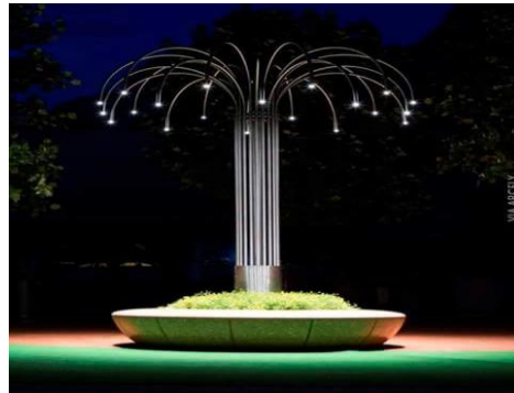
شكل رقم (29) وحدة إضاءة حدائق مستوحاة من شكل النخلة