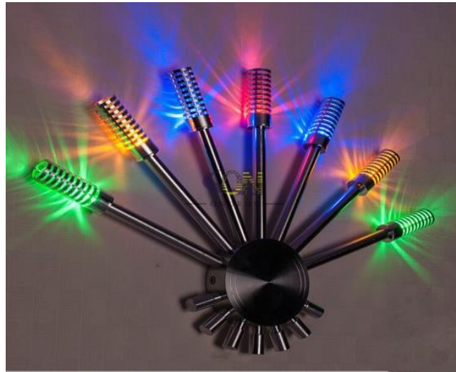
شكل رقم (4) أبليك يتكون من سبعة أسطوانات معدنية على هيئة أشعة تصدر إضاءة ذات ألوان متعددة