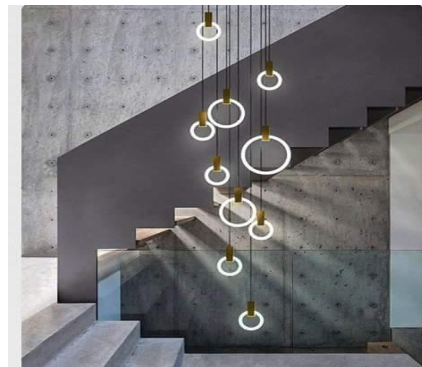
شكل رقم (13) معلقة مكونة من مجموعة من الحلقات المضيئة