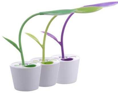
شكل رقم (19) وحدة إضاءة مكتبية على شكل نبات