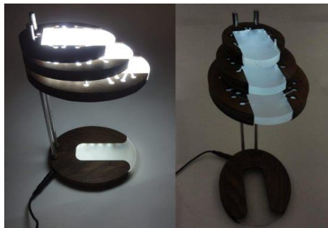
شكل رقم (24) وحدة إضاءة مكتبية ذات ثلاثة مصادر للإضاءة