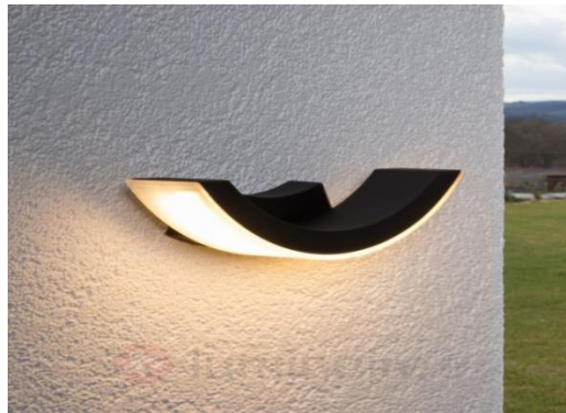
شكل رقم (9) أبليك من المعدن على شكل قوس ذو إضاءة بيضاء