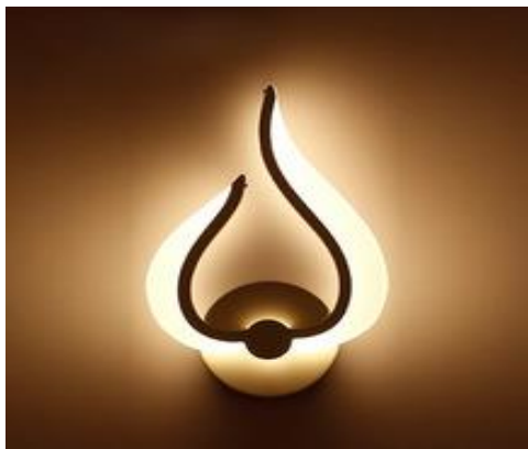
شكل رقم (2) أبليك من الزجاج والمعدن مستوحى من قرون الغزال