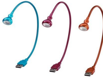
شكل رقم (14) وحدة إضاءة مكتبية مزودة بوصلة USB