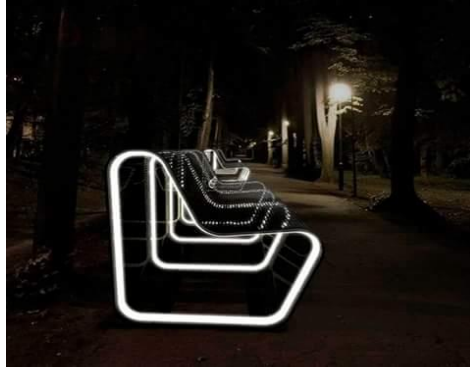
شكل رقم (32) نموذج (3) لإضاءة أماكن الجلوس في الحدائق والشوارع