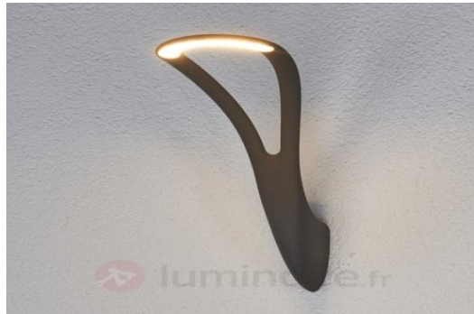
شكل رقم (8) أبليك من المعدن ذو إضاءة بيضاء