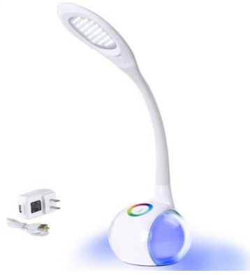
شكل رقم (18) وحدة إضاءة مكتبية مزودة بوسيلة للشحن