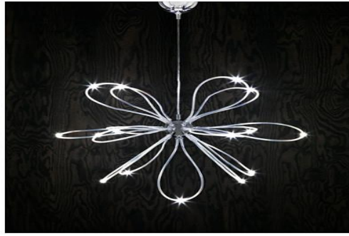
شكل رقم (10) نجفة من المعدن مستوحاة من شكل الذرة