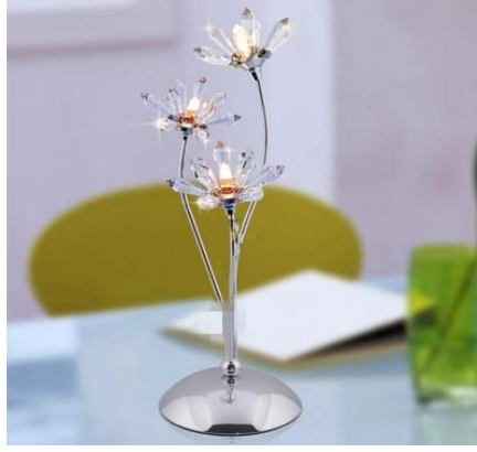
شكل رقم (21) وحدة إضاءة مكتبية على شكل ثلاثة زهور