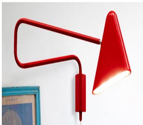
شكل رقم (5) أبليك من المعدن على شكل مثلث ذو إضاءة بيضاء