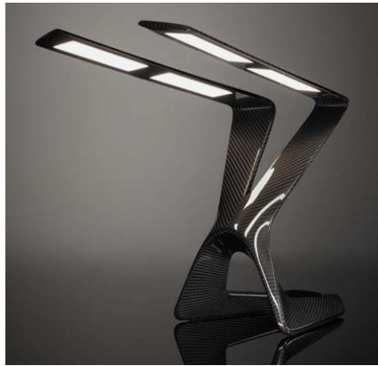
شكل رقم (20) وحدة إضاءة مكتبية ذات مصدرين للأضاءة على شكل انسان جالس على رقبتيه