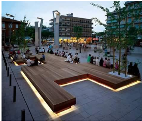
شكل رقم (33) نموذج (4) لإضاءة أماكن الجلوس في الحدائق والشوارع