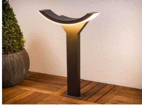
شكل رقم (28) وحدة إضاءة حدائق