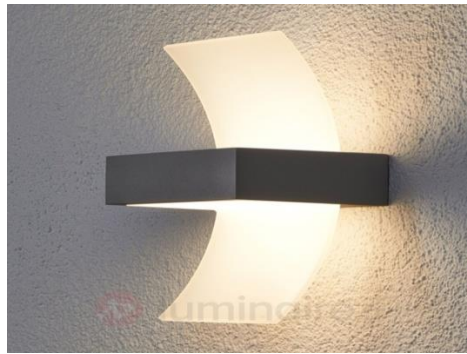
شكل رقم (7) أبليك من المعدن والأكلكرك على شكل متوازى مستطيلات ذو إضاءة بيضاء