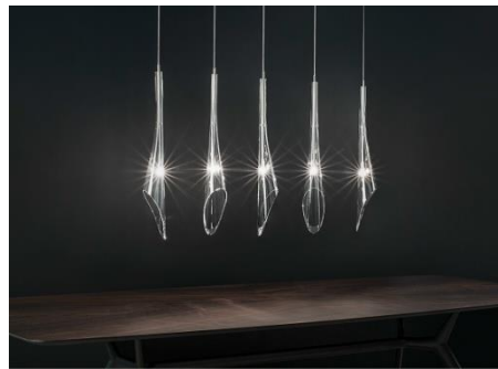
شكل رقم (12) معلقة من الزجاج على شكل مجموعة من الكاسات