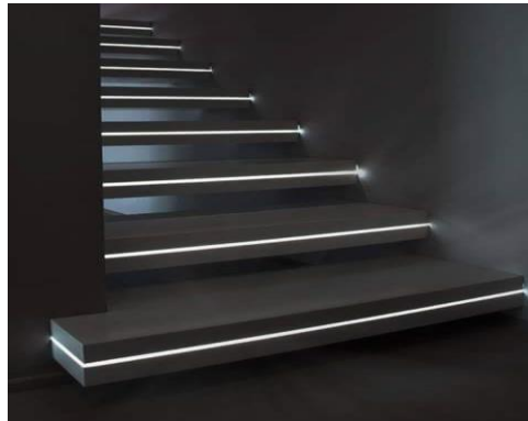
شكل رقم (27) نموذج (2) لإضاءة السلالم