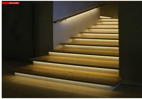
شكل رقم (26) نموذج (1) لإضاءة السلالم