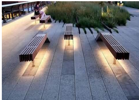
شكل رقم (30) نموذج (1) لإضاءة أماكن الجلوس في الحدائق والشوارع