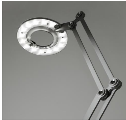
شكل رقم (22) أباجورة من المعدن قابله للطي ذات رأس دائري الشكل