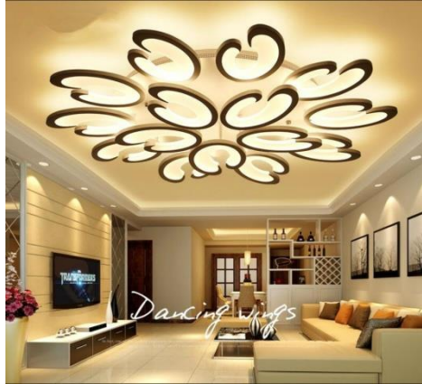
شكل رقم (25) إضاءة الأسقف تضيف لمسة جمالية للمكان