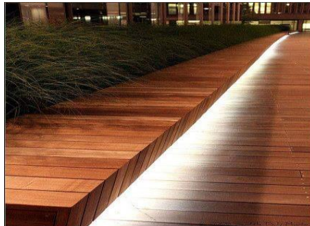
شكل رقم (34) إضاءة الممرات