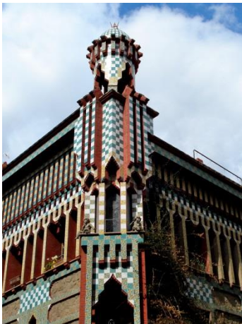
شكل (٤) بيبلا فيستا

من ناحية أخرى كان يؤكد ان أهم المؤثرات علي اعماله هي (الهويه والقوميه - التمرد علي المفروض واعتماد الحدس الفني - الطبيعه - الضوء - الاخلاص والعمل الدؤوب).