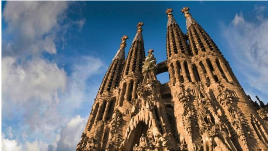
(شكل ١٥) كنيسة ساغرادا دي فاميليا

الي اليمين نموذج نفذه جاودي (موجود بمتحفه في برشلونه) لاستلهام الشكل الخارجي لبناء الكنيسة والمستوحى من قانون الجاذبيه الطبيعه وتأثيره عل مجموعه من السلاسل اللينه، وكذلك البناء النهائي الذي لا يزال قيد التنفيذ الي يومنا هذا والذي لم يشهده جاودي في حياته .