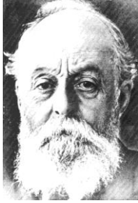
شكل (٣) سير جويل

العظيمه من أجل اثناء الحاضر بمعرفه حديثه New knowlege. وقال: "لكي نقيم أعمالا ذات قيمة حقيقيه.. يجب ان نعتبر الماضي بعظمته هو الأساس.. لكن.. مع تجنب أخطاء ذلك الماضي...." وتكلم أيضا عن قدرته علي تصور الاشكال في المساحات قبل تنفيذها قائلا: "لدي احساس قوي وفهم عميق للمساحات والاسطح إنتني من الاختلاط بالبحاره حيث تربيته في ميناء، فكان البحاره يأتون للتجاره يدرسون ويتصورون ويصممون مكان وضع حاجياتهم بشكل منظم يلائم عمليه البيع والشراء قبل البدء فيها، من هنا تكونت لدي القدره والموهبه علي تصور الاشياء في الفضاء قبل وضعها علي الحيز الارضي".