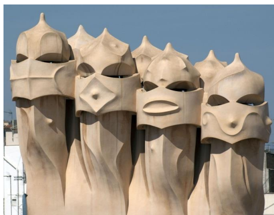
(شكل ٩) بعض فتحات التهوية العلوية والمداخن علي اسطح مبان جاودي حيث الاصرار علي تحيل البنينات المحيطة الي لوحات فنيه دون الاخلال بالجوانب الوظيفيه