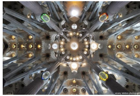
(شكل ٨) كنيسه العائله المقدسه بما تحمله من محاوله معماريه جاده وصادقه من جاودي للوصول الي الكمال الذي يتصف به الله تعالى، مبتعدا عن الاكتفاء بالزخارف والتزيين المعتاد في اغلب الكنائس الهامه