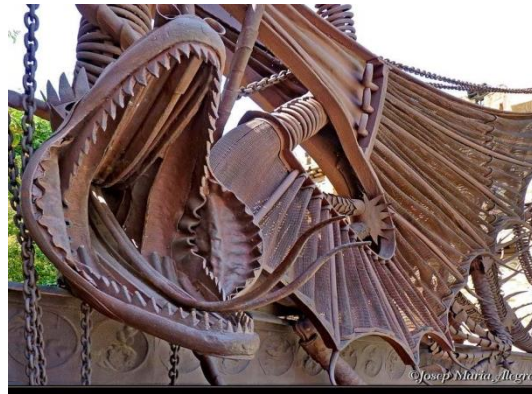
شكل (٥) مجموعه من تصميمات ج(لاودي المتنوعه الممتلنه بالسيرياليه والاحلام متنوعه الاحاسيس

مجموعه من اعمال المعماري جاودي بمدينة برشلونه اسبانيا توضح اهميه الجانب الفني والتجاه السيريالي في التفكير والتصميم لدي جاودي مع الجراه علي التنفيذ والاستمراريه والبقاء ليومنا هذا، من كتاب ريتشارد ريجاس