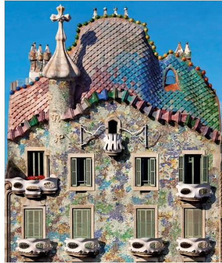
(شكل ١٣) مبني كاساباتيللو - الواجهه الاماميه