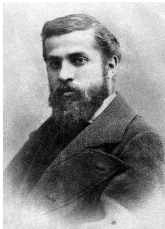
شكل (٢) انطونيو جاودي

ولد انطونيو جاودي وعاش في اسبانيا 1852 - 1926 ، كان طالبا محيرا لأساتذته، لم يعرفوا ان كان طالبا فذا ام هو الجنون بعينه!! كان يؤكد ان سبب شهرته واهتمام الناس بإبداعاته ثلاثه اشياء اساسيه هي الموهبه والاهتمام بالجوانب المجتمعيه في اعماله social concerns الى جانب الهويه القوميه national origin .