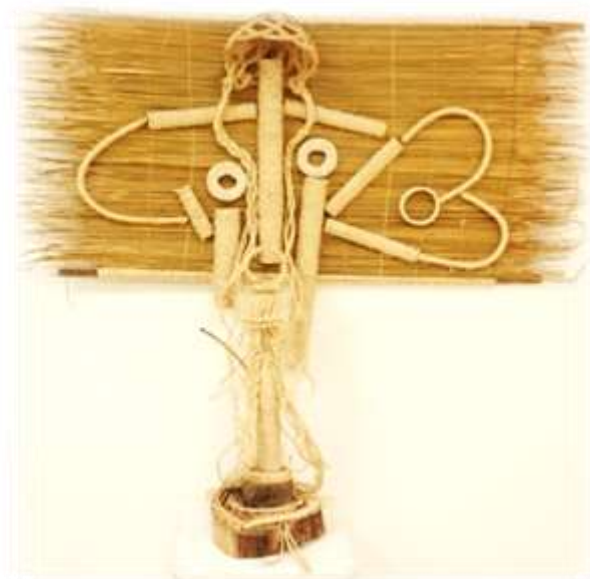
شكل رقم (16) . بدون عنوان . نبات السمار , البامبو . خشب , خيوط .

■ من هنا فان التوليف والتجريب يؤدي بالضرورة الى تطوير الاشغال الفنية والتحول بها نحو الحدائثة .