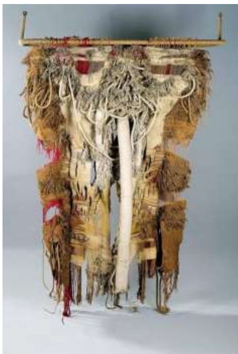
جوسيب جراو: العمل الخامس . شكل رقم ( 11 ) الغضب. 2011 م ( توليف من اقمشة – احبال – خيوط – خشب )