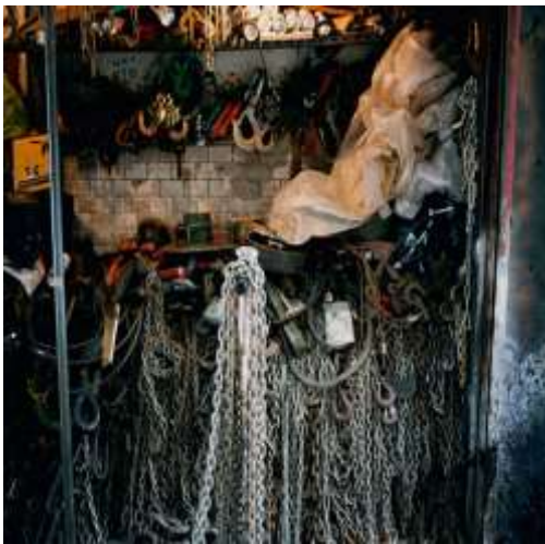
جيم دين : شكل رقم ( 4 ) . النوم فى النار، 2013 م (توليف من خامات متنوعة سلاسل , معادن متنوعة الاشكال , بلاستيك , حجارة )