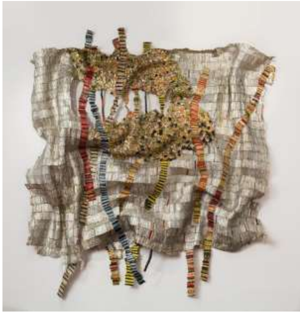
إل أناتسوي : العمل الثالث . شكل رقم ( 9 ) . الجذور المتوترة . 2014 . ( توليف من اقمشة – زجاج – بلاستيك – الومنيوم – اسلاك نحاسية – وخيوط )