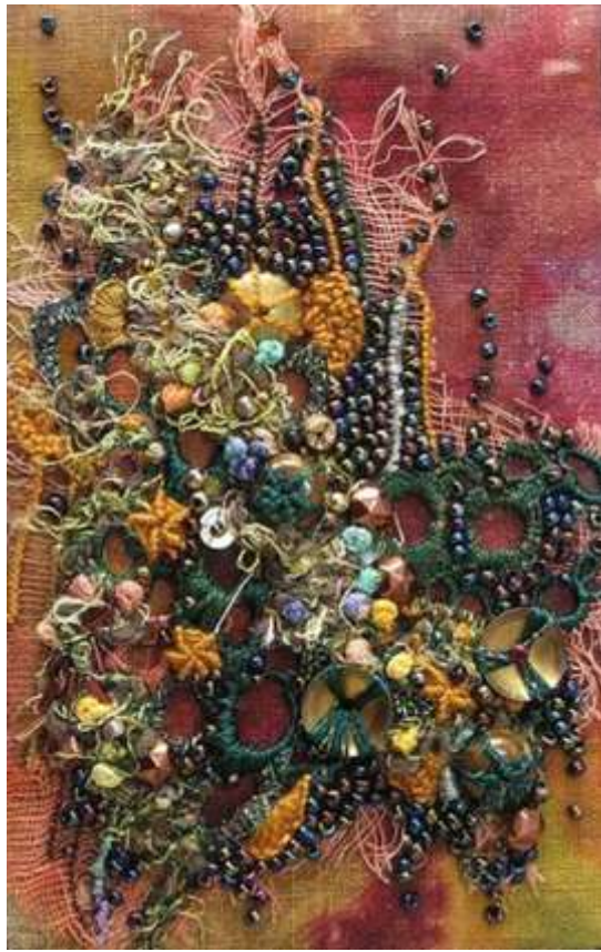
شارون بوجون: العمل الثانى . شكل رقم ( 8 ) . بطاقة بريدية. 2006. ( توليف من اقمشة - خيش - خرز - خيوط - خشب - صبغات )