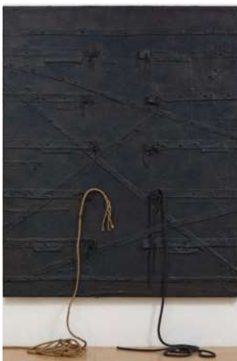
هارموندى هاموند: شكل رقم ( 2 ) احادية اللون . 2013م ( توليف من خامات الحبال والجلد ووسائط اخرى )

1944 Hammond: والتي نجد التوليف بالتجريب عندها واضح بل اتخذته اسلوباً فنياً لاعمالها , كما فى عملها "احادية اللون " شكل رقم ( 2 ) , والذي تمتعت فيه المواد والخامات بحالة من التوافق والانسجام والانفصال عن التقليدية , فتحققت الجودة الفنية من جانب , والتوازن الفنى المتوافق فى وحدة العمل من جانب آخر , فقد استخدمت الفنانة التوليف والتجريب للبحث عن تحقيق الحدائة برؤيتها الفنية الغير تقليدية القائمة على تأكيد المعنى الرمزى والشكلانية وعمق العلاقة الكامنه فى بنية العمل الفنى .