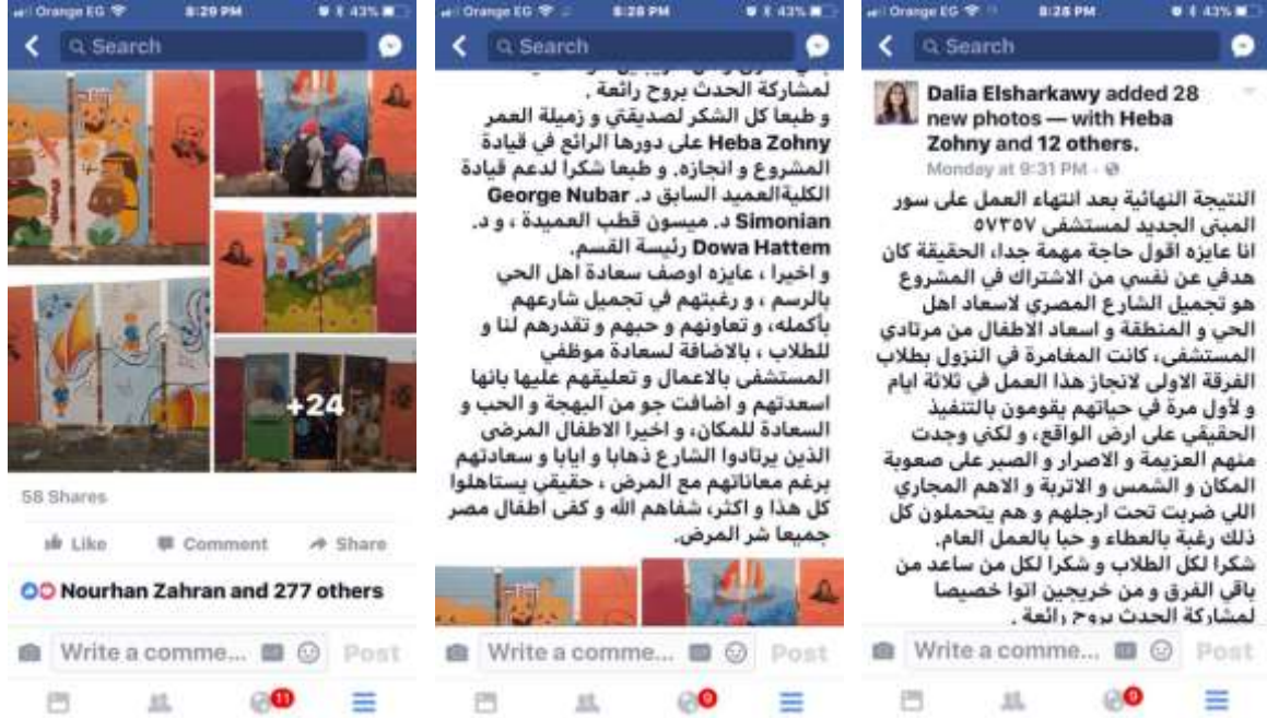
شكل "37": البوست الذي غطى الحدث على صفحتي الخاصة.

و هو موضوع قمت بكتابته و ارساله للفنان و الناقد التشكيلي صلاح بيبصار و قد نزل على صفحته الخاصة و لاقى الكثير من الإعجاب و التقدير. أما الآتي فهو البوست الذي كتبتة في اليوم الأخير من المبادرة و التي غطت الحدث, و لا يزال يحصد العديد من الإعجاب و المشاركة إلى الآن.