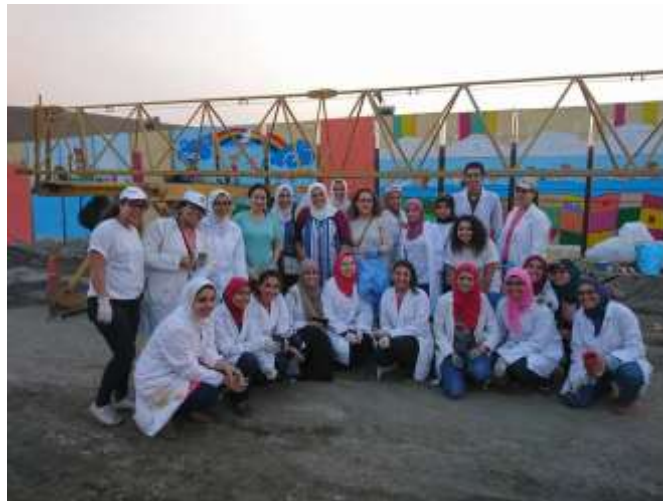
شكل "20": صورة جماعية في نهاية اليوم الثاني تمثل الأشكال الآتية "21-22" صوراً ليلية للأعمال: