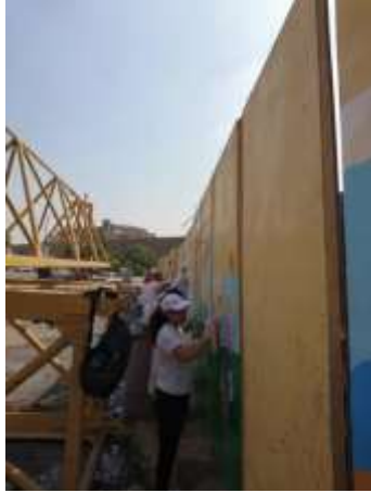
شكل "17": اليوم الثان