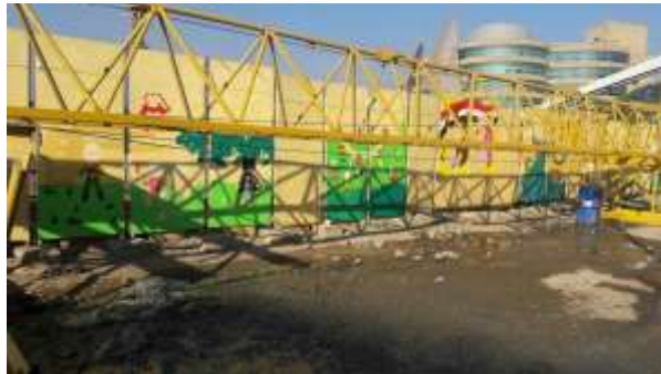
شكل "15" حصاد اليوم الأول

النتيجة النهائية بعد عمل اليوم الأول, شكل "15"