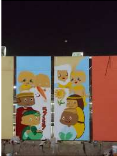
شكل "22": مشهد ليلي