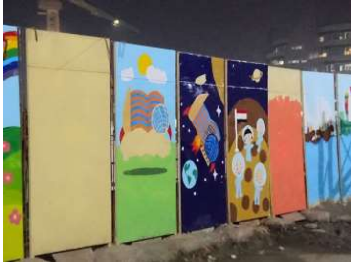
شكل "21": مشهد ليلي لليوم الثاني