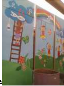
شكل "30- ب": تفصيلة