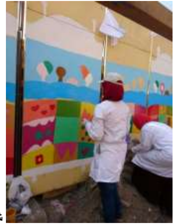
شكل "16": العمل في اليوم الثاني