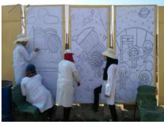
شكل "12" طباعة التصميمات على الجدران

و قد تم لصق الأوراق المطبوعة على الجدران و تم طباعة التصميمات عليها بالأقلام الرصاص, كما في الشكل "2" "3" "4".