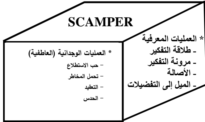
شكل ١ نموذج سكامبر