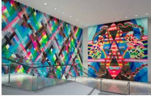
(صوره رقم ٧) جداريه في متحف هامر ٢٠١٣ من أعمال فنانه الجرافيتي MAYA HAYUK-مايا هايوك تتميز برسومات هندسية، و ألوان ساطعة فسفوريه مستوحاه من الالوان التي يتميز بها الفن الجماهيري.

ومن مصادر إلهامها كذلك موسيقى البانك-روك و الثقافة الشعبية لبلدان أوروبا الشرقية، الفن الحديث و الفن الحركي. وتتميز لوحاتها برسومات هندسية، و ألوان ساطعة متأثرة بالالوان التي تميز بها الفن الجماهيري "pop art". وعملت على تنسيق مجموعة من معارض الفن المعاصر الحضري في عدة دول.