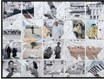
(صوره رقم ٤) لوحه بتقنيه الكولاج من أعمال الفنان اللبناني كميل زكريا حيث أنه استخدم قصاصات لصور فوتوغرافية شخصية مع قصاصات جرائد ومجلات .

ويتناول زكريا تجربته الشخصية بطرق عديدة مستعرضا الأماكن العديدة التي اتخذها وطنا له منذ مغادرته لبنان ، ويوثق في سلسلته " نزهة ساحلية " العدد المتضائل من عشش صيادي الأسماك على طول الشريط الساحلي للبحرين مع تسليط الضوء على تغير علاقة سكان هذا البلد مع الطبيعة والبحر الساحلي في خضم المد الحضري الهائل وعمليات إستصلاح الأراضي، حيث يؤكد زكريا في أعماله على الإنحسار التدريجي للثقافة البحرية في مملكة البحرين التي تستقي إسمها من البحر.