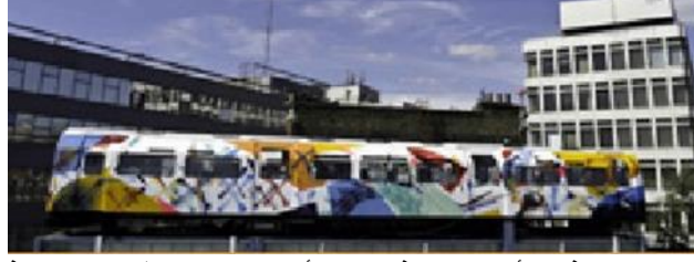
صورة رقم ٤ توضع رسم مجموعه من فناني أ.و.س جرا فيتي على إحدى عربات القطار المتواجده في قرية الأندرغراوند"، بحي شورديتس شرق لندن.

ومن ذلك أصبح فن الجرافيتي تقنية وإتجاه فني يستخدمه الفنانون عامة وفنانو الفن الجماهيري خاصة لا يصلح رسائل إجتماعية وسياسية ، كما أنه يستخدم كنوع من أنواع الدعاية. كما يعتبر الجرافيتي شكل من أشكال الفن الحديث.