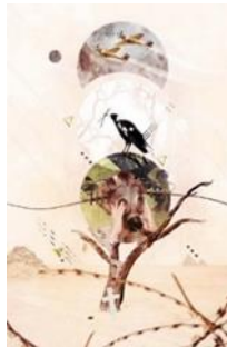
صوره رقم ١٥ بعض الأعمال الفنية توضح استخدام تقنيه الكولاج عن طريق استخدام بعض برامج الحاسب كالفوتوشوب PHOTOSHOP والكورل درو COREL DRAW

ثالثاً: الكولاج: وهو الفنّ الذي يعتمد على استخدام أكثر من برنامج للتصميم، كاستخدام الفوتوشوب Photoshop مع الكورل درو Corel Draw .