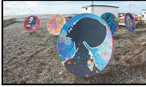
(صوره رقم ٩) من أعمال الفنان الجرافيتي ريبيل سبيريت "محمد البلاوي" حيث توضع تأثره كثيرا بالفن الجماهيري من خلال استخدامه لصور الفنانين واستخدامه للرسم الزيتي.