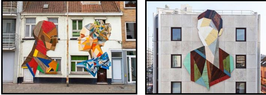
(صوره رقم ١٠) بعض أعمال الفنان البلجيكي Stefaan De Croock جداريات على بعض واجهات مباني المدينة حيث استخدم الأخشاب القديمة الملونة لعمل بورتريهات متأثرا بتكنيك الفن الجماهيري.

تتميز أعمال الفنان البلجيكي Stefan De Croock بإعادة استخدامه لأخشاب الأبواب القديمة بمختلف الأشكال والأحجام والألوان؛ لعمل بورتريهات هندسية Geometric Portraits على واجهات المباني. وهذا التكنيك الذي يتبعه من الأسس الهامة في الفن الجماهيري، من حيث استخدام كل ما هو محلي وإعادة تدويره للوصول إلى عمل فني له طابع الفن الجماهيري.