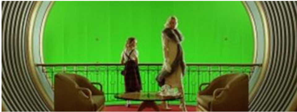
صوره رقم ١٦ تصوير لأحد الافلام حيث يتم وضع خلفيه خضراء " الكروما " لإستبدالها باستخدام الحاسب بخلفيه مناسبه

الثابت: وهو عمل لا يتحرك أبداً فقط يتم رسمه بأي برنامج رسومي من دون تحريك وبرنامج الفوتوشوب هو الأفضل في هذا المجال بلا منازع . يستخدم غالباً في الدعايات الورقية أو الرقمية الثابتة . المتحرك: ويتم عمله ببرنامج رسوم كمثال برنامج الفوتوشوب photo shop ومن ثم يتم إدخاله في برنامج من برامج الثرى دي 3D والتي تقوم بدورها بتحريك المشهد لتجعله يبدو حياً متحرك . يستخدم غالباً في الأفلام والمسلسلات وفي الدعايات ايضاً مثال : الصورة الاصلية داخل الاستوديوهات خلف الممثلتان خلفية خضراء اللون تسمى الكروما.