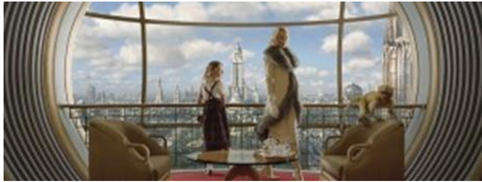
صوره رقم ١٧ في هذه الصورة لقد تم إزالة الخلفية الخضراء (الكروما) واستبدالها بخلفية مناسبة لفكره الفيلم