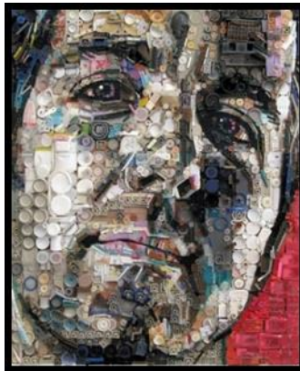
(صوره رقم ١) لوحة فنية منغذه بتقنية الكولاج لوجه رجل، حيث إستخدم الفنان مواد من الخردة كالأزرار وعلب صغيره جدا وقام بترتيبها وتنسيقها وكأنها فرشاة رسم لفنان تشكيلي.

والكولاج يعتبر من الوسائط التعبيرية الفنية الحديثة التي تستخدم خامات فنية متنوعة كقصاصات الاوراق وبعض الاقمشة والخيوط كورق المناديل، التجاليد، ورق جرائد أو مجلات، بطاقات، معادن، أشياء بلاستيكية، قماش، أسلاك، صور فوتوغرافية (٤). فمن الممكن إستخدام أية مواد يجدها الفنان مثل: الصدف، ريش طيور، الحصى، كما يمكن إستخدام مواد خردة مثل: ألعاب مهملة، أدوات مطبخ والمواد المستهلكة تضاف إليها بعض الخطوط والالوان لاجداث تأثيرات فنية ثلاثية الابعاد تثرى فضاءات اللوحة. وقد لاحظ الفنان أنه كلما أستخدم أغراضاً أثقل وأكبر كلما أحتاج لوحة أقوى لحمل هذه الأشياء.