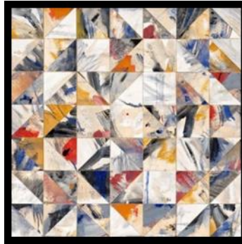
(صورة رقم ٣) توضح بعض الأعمال الفنية للفنان المصري كنعان والتي إستخدم فيه تقنية الكولاج، وقد إستخدم فيهم قصاصات من الورق المختلف الالوان، كما إستخدم في بعض الاعمال قصاصات المجلات والصور في عمل تشكيل فني هندسي

وقد مر هذا الفنان في حياته الفنية بخمس مراحل، وكانت المرحلة الخامسة (١٩٦٦ : ١٩٦٧) هي أهم مرحله في مسيرته الفنية، مرحلة الكولاج الحر كأحد فروع الفن الجماهيري (١١). حيث تخلى عن القواعد الأساسية للفن وأنصت لخياله الجامح لينفذ لوحاته الكولاجية والتجريدية في اللون التي ساد بها الأشكال الهندسية المتقاطعة والمرسومة جنبا إلى جنب وكأنها حالة حوارية من الأشكال الهندسية. فقد ابتكر في عام ١٩٥٣ أول لوحة كولاج.