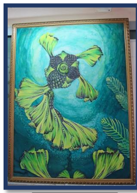
شكل رقم 54