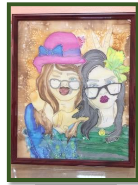
شكل رقم 53