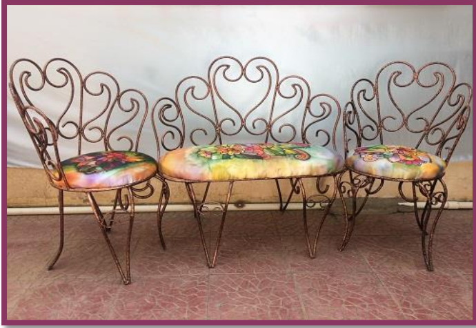
شكل رقم 51