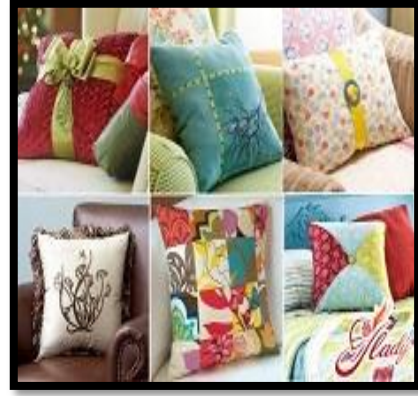
شكل رقم 11