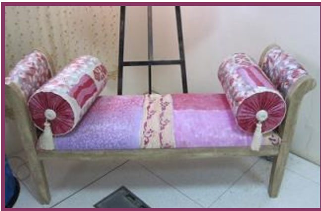
شكل رقم 49