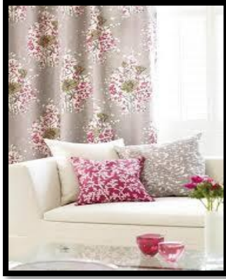
شكل رقم 12