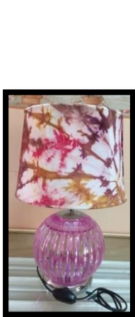
شكل رقم 26