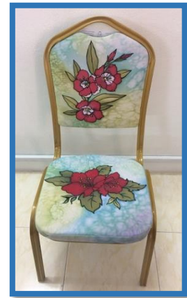
شكل رقم 48