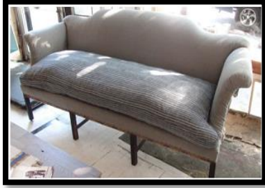
شكل رقم 20

وفيما يلي نماذج لبعض قطع الأثاث وأقمشتها كما بالأشكال من 18 - 21.