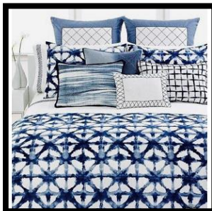
شكل رقم 5