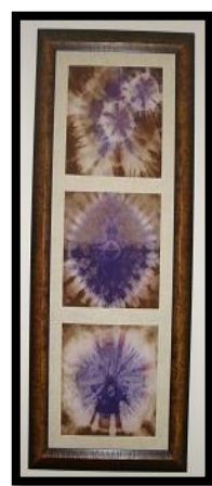
شكل رقم 22