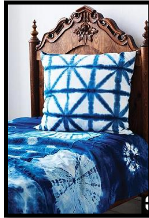
شكل رقم 2