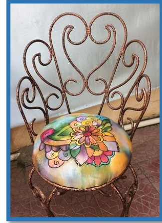
شكل رقم 50

بعض نماذج من قطع الأثاث التي نفذتها الطالبات باستخدام تقنيتي الرسم علي الحرير والانتقال الحراري