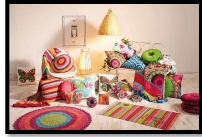
شكل رقم 9