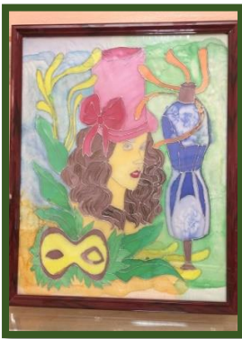
شكل رقم 55

شكل رقم 52 عبارة عن قطعه أثاث ( مجلس عربي) نفذت قاعدته من الخشب المستهلك للصناديق كإعادة تدوير واستخدامه في منتج نافع وتنجيده من قماش الساتان ومزخرف بأسلوب الرسم علي الحرير.