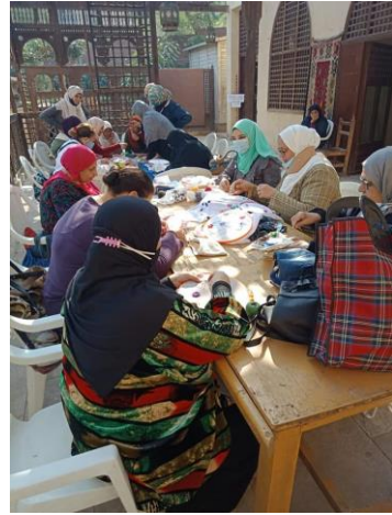
شكل رقم ٥: ورش تعليم التطريز للسيدات