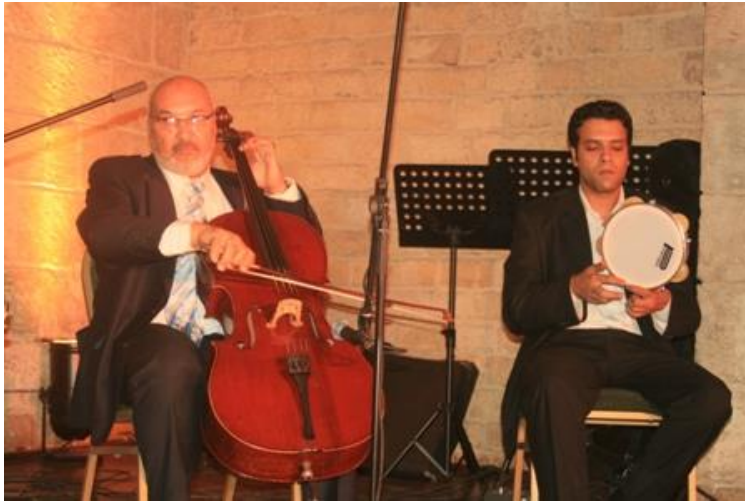
شكل رقم ١٠ : ورش الغناء بقصر بشتاك المصدر:

تنقسم ورش التدريب الخاصة ببيت الغناء العربي إلى قسمين: 1- أصوات 2- آلات