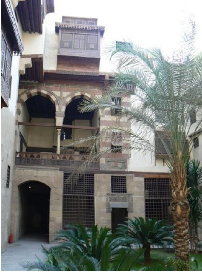
شكل رقم ٢: بيت السحيمي