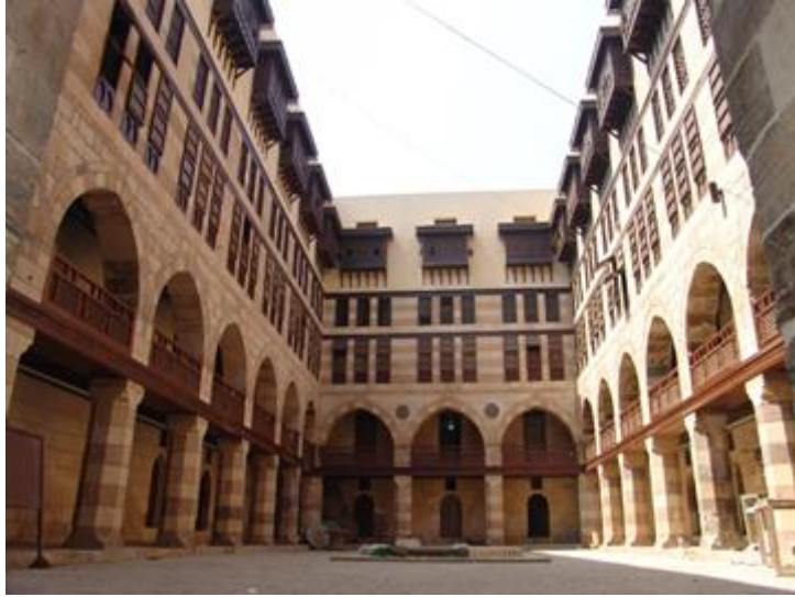
شكل رقم ١١: وكالة الغوري المصدر:

https://www.cdf.gov.eg/ الموقع الإلكتروني لصندوق التنمية الثقافية، وزارة الثقافة،