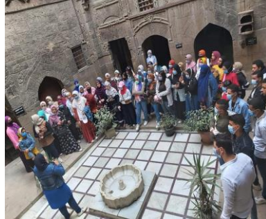
شكل رقم ٧: رحلة المتحف لطلاب الجامعة الهمم