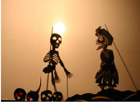
شكل رقم ٤