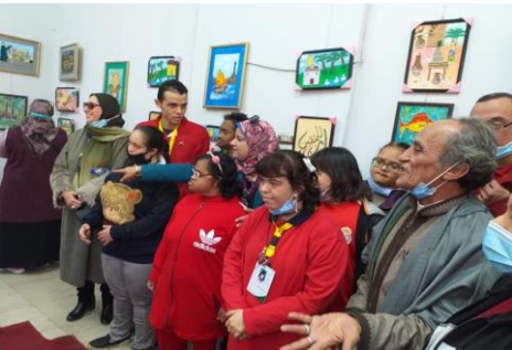
شكل رقم ٨: ورشة الرسم لذوى