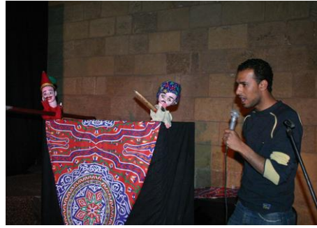
شكل رقم ٣