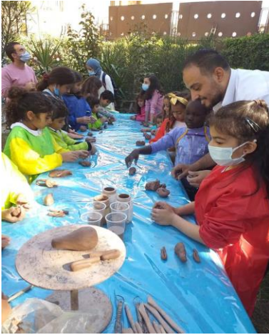
شكل رقم ٦ : ورش النحت للأطفال

خلاله اختبار العمل التطبيقي على شكل ورش في المتحف . تقوم أنشطة المتحف بعقد أنشطة متخصصة للأطفال، الشباب والسيدات وذوى الهمم من خلال تشجيعهم على الإهتمام بالتراث والثروات الثقافية الموجودة في بلادهم، وذلك من خلال الأنشطة المختلفة التي تُساعد على الدعوة المتواصلة لزيارة المتحف مثل الندوات والنقاشات العامة، لقاءات مع الطاقم الفني والتقني للمتحف وعقد الورش التعليمية والحرف مثل ورش لتعليم النول ومجسمات الخرز و الرسم والأبداع والنحت و التطريز اليدوى للسيدات ....الخ لتنمية المجتمع المحيط به ( نصر الدين، 2021).