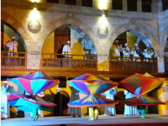
شكل رقم ١٢: عروض التنورة بوكالة الغورى

معارض في المناسبات الاسلامية مثل حلول شهر رمضان أو في الاعياد وغيرها من المناسبات