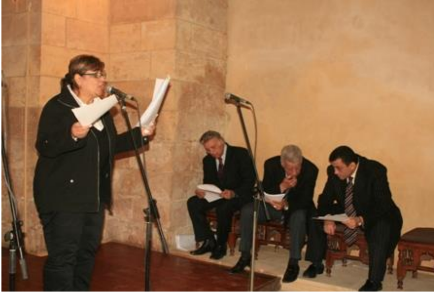
شكل رقم ١٤: ورشه الشعر العربي ببيت الست وسيلة