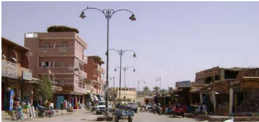
شكل (١٠) مدينة سيوة الحالية (الخضراوي، ريهام، ٢٠٠٣، ١٣٧)