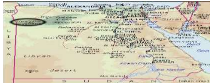
شكل (١) موقع واحة سيوة على خريطة مصر (وفق، سارة – عاطف، أحمد - عبد القادر، مراد، ٢٠١٥، ٩-١).

تقع واحة سيوة في الطرف الجنوبي الغربي من محافظة مطروح وعلى مسافة ٣٠٠ كم من مدينة مرسى مطروح، وتمثل واحة سيوة إحدى المنخفضات الطبيعية في الصحراء الغربية وتنخفض عن مستوى سطح البحر ١٨م، وتبلغ مساحتها ١٧٣٨,٤ كم ٢ ويحدها من الشمال هضبة صخرية متصلة تتقارب باتجاه الشرق ومن الجنوب سلسلة من التلال والكثبان الرملية ومن الغرب الحدود الليبية على بُعد ١٢٠ كم ومن الشرق الواحات البحرية، يوجد أيضاً أربع بحيرات مالحة كبيرة والعديد من الينابيع الطبيعية المستخدمة للري، وتستخدم مياه الينابيع لري مزارع النخيل والزيتون ثم تصب في البحيرات المالحة. ومع ذلك، فقد تم حفر المزيد والمزيد من الآبار العميقة في السنوات الأخيرة مما تسبب في ارتفاع نسبة المياه التي أصبحت الآن قريبة من مستوى السطح، ويتسبب هذا الانتعاش في تكوين تكونات ملحية واسعة النطاق على التربة السطحية وعلى جدران المباني وعلى النتوءات الصخرية أيضاً (Rovero, L. - Tonietti, U. - Fratini, F. – Rescic, S., 2009, 2492-2503)؛ وفق، سارة – عاطف، أحمد - عبد القادر، مراد، ٢٠١٥، ٩-١).