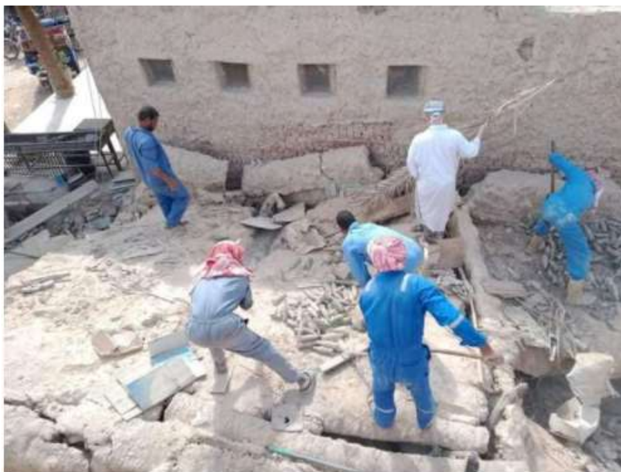
شكل (١٥) أثناء عملية التنظيف والترميم