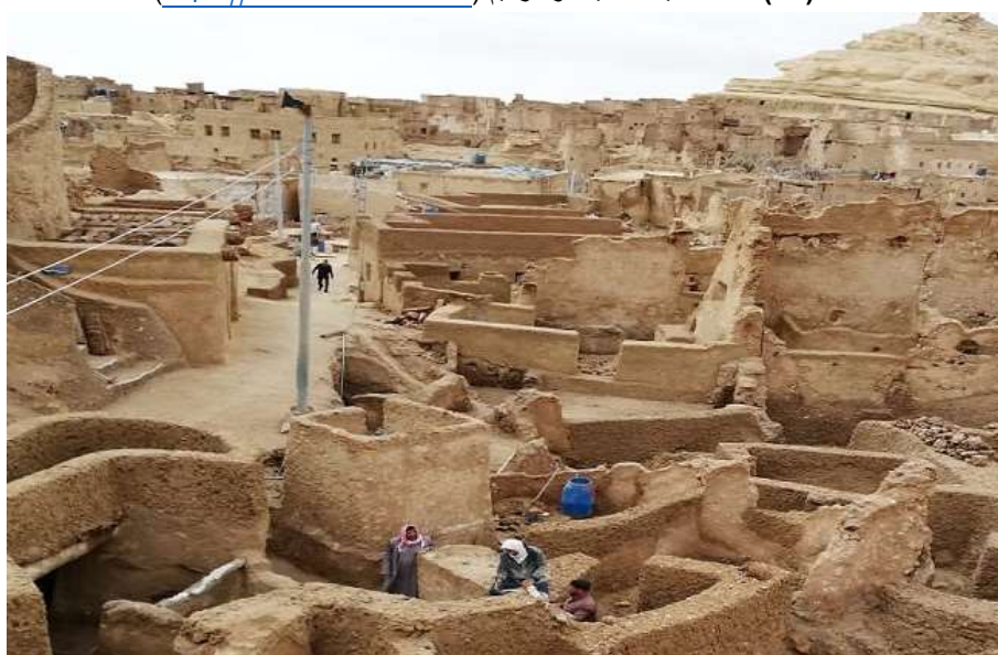
شكل (١٦) اثناء العمل على ترميم قلعة شالى