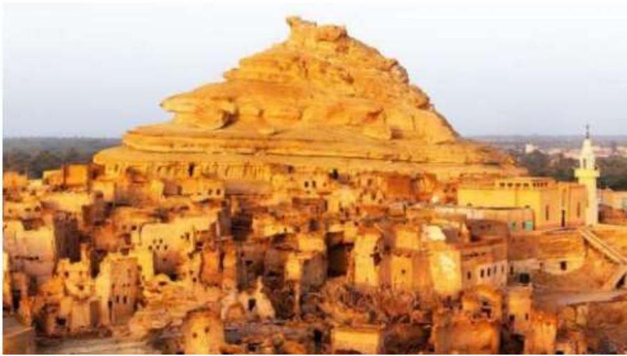
شكل (٣) (الخضراوي، ريهام، ٢٠٠٣، ١٣٧؛ https://gate.ahram.org.eg )