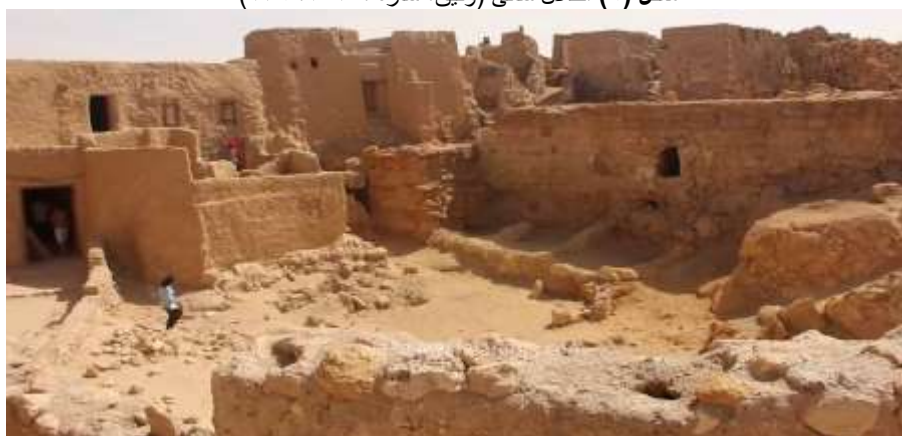
شكل (٧) منازل سيوة القديمة "شالي" (الخضراوي، ريهام، ٢٠٠٣، ١٣٢)