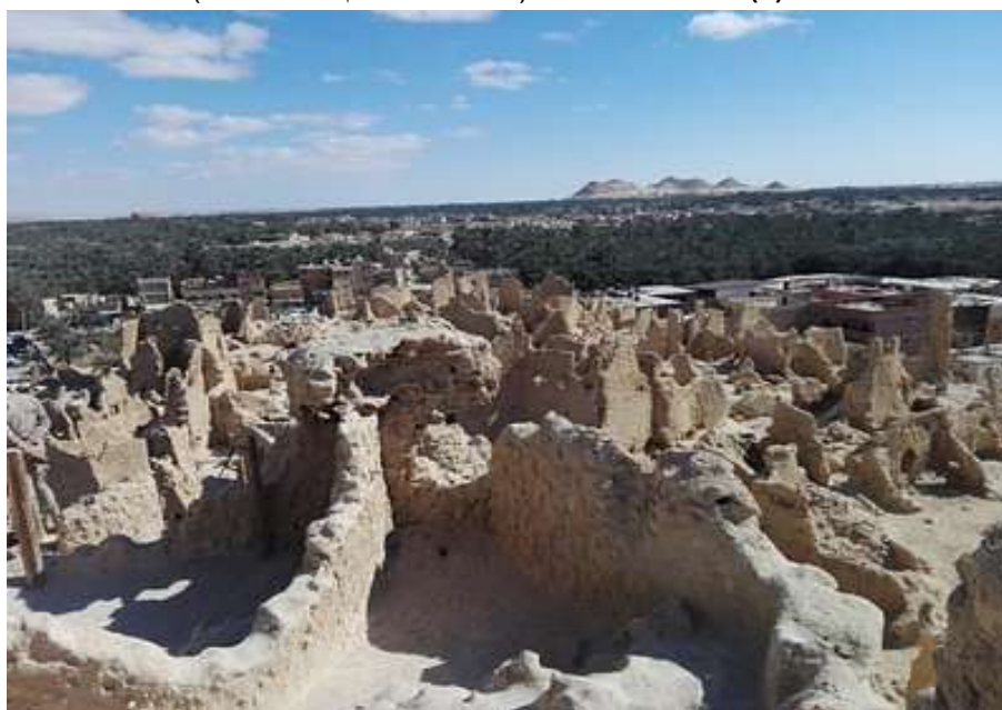
شكل (٦) أطلال شالي (وفيق، سارة، ٢٠١٥، ١٣٦)