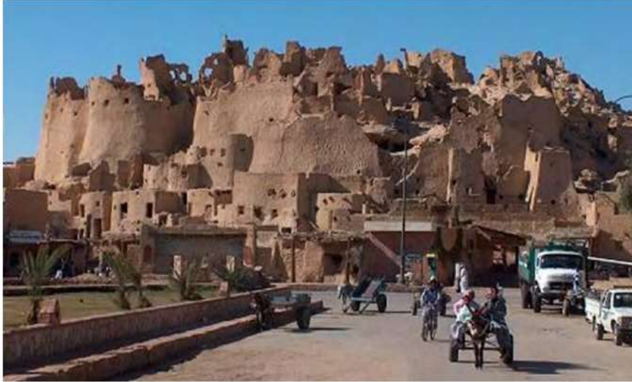
شكل (٢) مدينة شالي القديمة (Rovero,L. - Tonietti,U. - Fratini,F. – Rescic,S., 2009,2493؛ الخضراوي، ريهام، ٢٠٠٣، ١٣٥)

لمدة ثلاثة أيام متتالية مما أدى إلى ذوبان أحجار الكرشيف المحلية المشيدة بها المباني (شكل ، وأيضاً في ١٩٢٦م أنهار عدد كبير من منازل المدينة وتصدع الباقي منها نتيجة للأمطار الغزيرة، فهجرت السكان شالي وشيدوا منازل جديدة عند سطح الجبل، ولا تزال الحصون واقفة كنصب تذكاري وشاهد لبراعة البناء السيوي القديم وتقدم للزوار وجهة نظر مذهلة عن المستويات العليا للمدينة القديمة (الخضراوي، ريهام، ٢٠٠٣، ١٣٩؛ نيهان، داليا، https://www.syr-res.com/article ؛ Abdel-؛ (Assem,R.,2017,1-16؛ Motelb,A., Taher,A., El-Manawi,A.,2014,78-85).