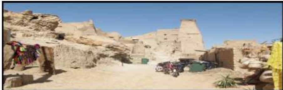
شكل (٤) قرية شالي سيوة (السيد، مي، ٢٠١٨، ٢٦٩)