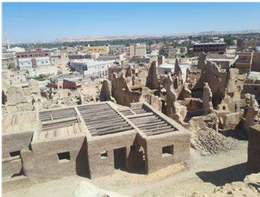
شكل (١٧) شالي بعد عميات التطوير