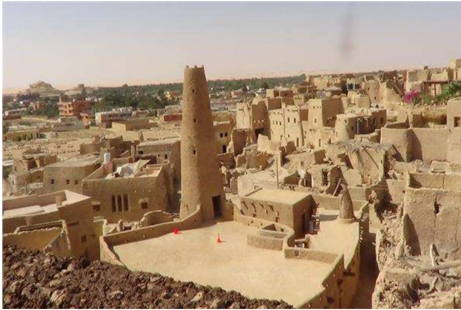
شكل (٩) جامع شالي العتيق