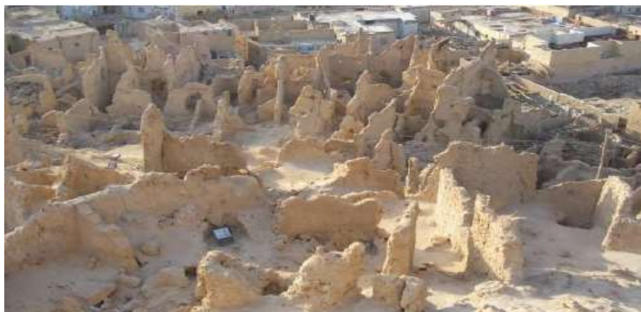
شكل (٥) أطلال شالي الكرشيف (الخضراوي، ريهام، ٢٠٠٣، ١٣٦)