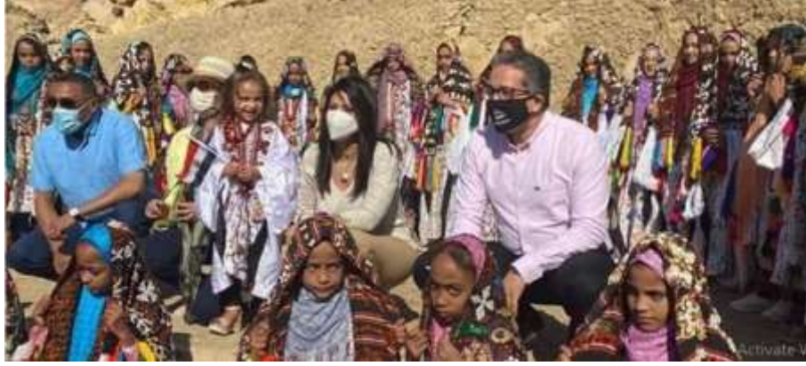
شكل (١٣) اثناء زيارة سيادة الوزير خالد العناني للمدينة اثناء عمليات التطوير