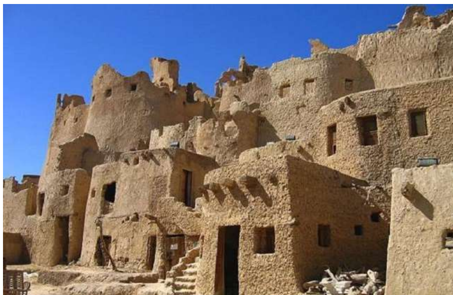
شكل (١٩) المنازل بعد عمليات الترميم