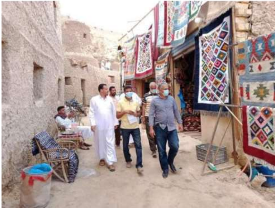
شكل (١٤) منظر اثناء زيارة المسؤولين بعد عملية التنظيف والتزيين