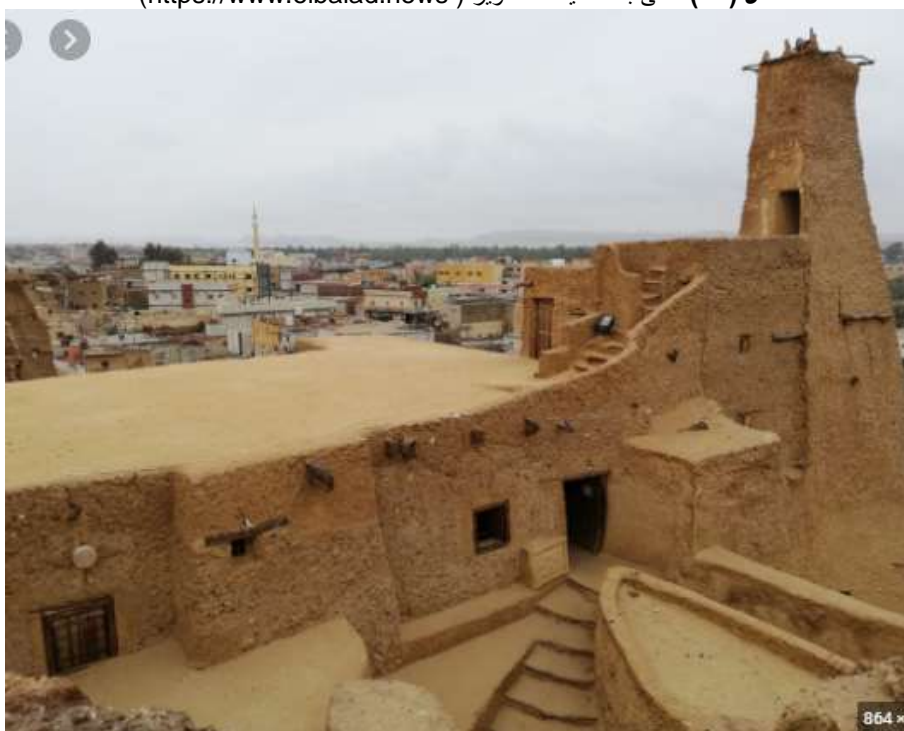
شكل (١٨) منظر للجامع العتيق بعد التطوير