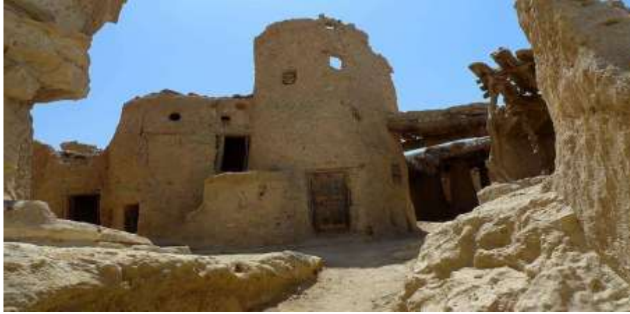
شكل (٨) (الخضراوي، ريهام، ٢٠٠٣، ١٣٢)