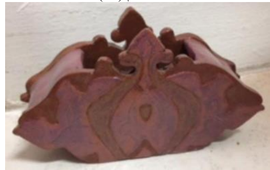
صورة رقم (٣٦)