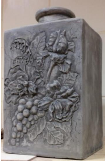
صورة رقم (٣٨)

وتم الحرق على مرحلتين حريق بسكويت ثم حريق جليز. الجليز : مطفي ملون.