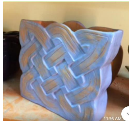
صورة رقم (٣٧)

- صورة رقم (٣٦): تمثل شكل خزف أسس في تشكيلة على أساس عنصر زخرفي اسلامي تم تشكيله يدويا على شريحتين من الطين بسمك ٠,٥ سم. والزخارف كانت على هيئة ريليف بارز وغائر. وتم التجسيم من خلال شريحة ذات بعرض ١٠ سم بين شريحتي الزخارف بحيث تكون اثناء مفرغ من الداخل ويحمل شكل العنصر الزخرفي في حدوده الخارجية. وتم الحرق على مرحلتين حريق بسكويت ثم حريق جليز. الجليز : شفاف ملون.