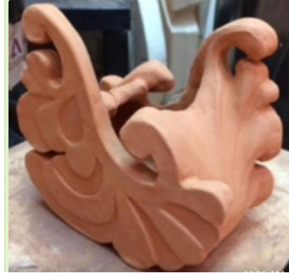
صورة رقم (٣٥)

بها الشكل الزخرفي من ائزان وتناغم وحركة وغيرها. صورة رقم (٣٥)