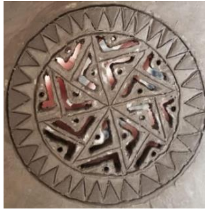
صورة رقم (٢١) شبك القلة

نسب الشكل: دائرة مقسمة بنسبة ٣:١ طريقة التشكيل: تفريغ يدوي وريليف بارز وغائر يدوي. الحريق: امكانية حرق واحدة ٩٠٠-٩٥٠ درجة مئوية. ثانيا : استخدام الزخارف الاسلامية بطريقة الغائر والبارز على أسطح الصحون المختلفة: