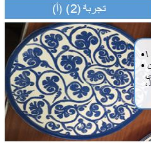
تجربة (2) (أ)

محاكاة لصحن من الخزف الإسلامي باللون الأزرق على خلفية بيضاء