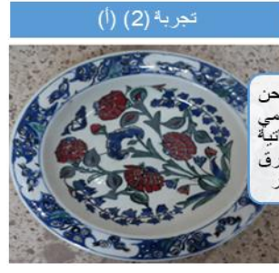
تجربة (2) (أ)

محاكاة لصحن من الخزف الإسلامي بأوان أحمر وأخضر وأزرق