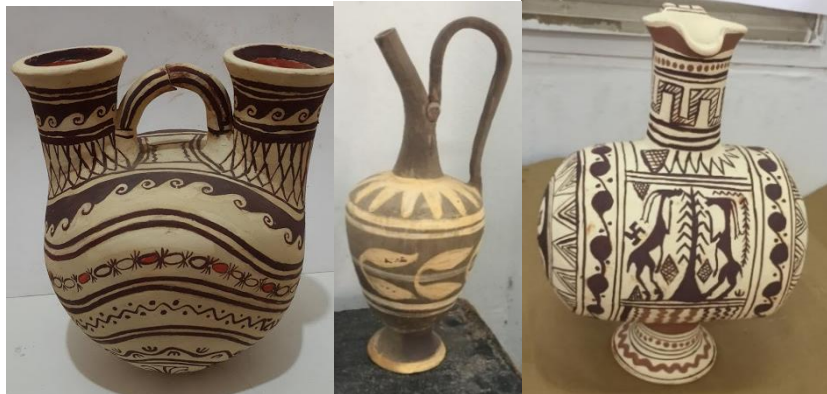
صور رقم (١٠،١١،١٢)

تجربة (٣) (ب): محاكاة لأواني اغريقية ذات أشكال متعدده : صور رقم (١٠،١١،١٢)