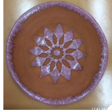
صور رقم (٢٩،٣٠)

منتجات مستوحاه من الفن الاسلامي مزخرفة بالخطوط الاسلامية والزخارف النباتية الاسلامية تحت الطلاء الزجاجي الشفاف :