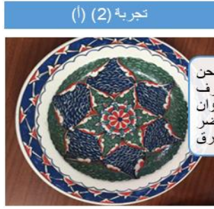
تجربة (2) (أ)

محاكاة لصحن من الخزف الإسلامي بأوان أحمر وأخضر وأزرق