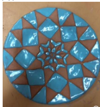
صور رقم (٢٧،٢٨)

ملحوظات: يمكن تطبيق العديد من التقنيات لمعالجة السطح لونها مثل: (الطلاء الشفاف _ اللون تحت الطلاء - البطانات - وغيره )