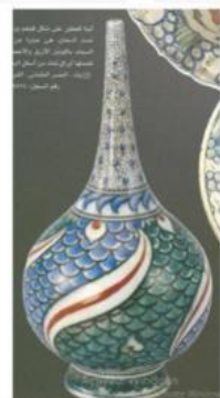
الصور رقم (٤،٥،٦)