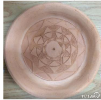
صور رقم (٢٢،٢٣،٢٤)