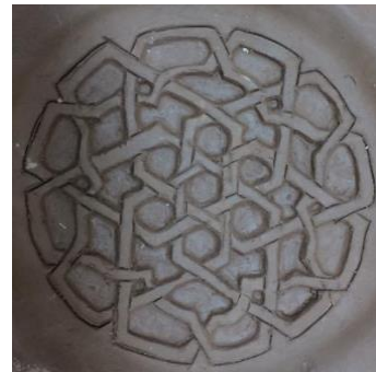
صور رقم (٢٥،٢٦)