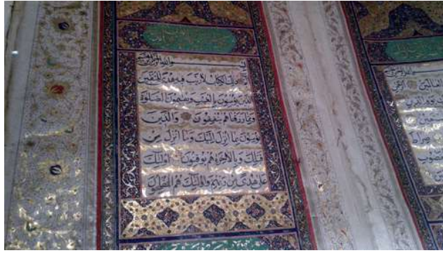
خط القران الكريم، بخط النسخ وزخارف جميلة وملونة ، رقم الحفظ 86/549