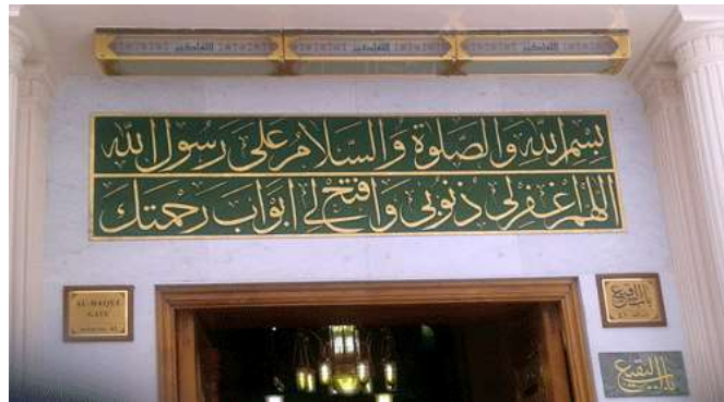
خط الثلث عبد الرحمن بن عثمان ال جلاجل 86/522