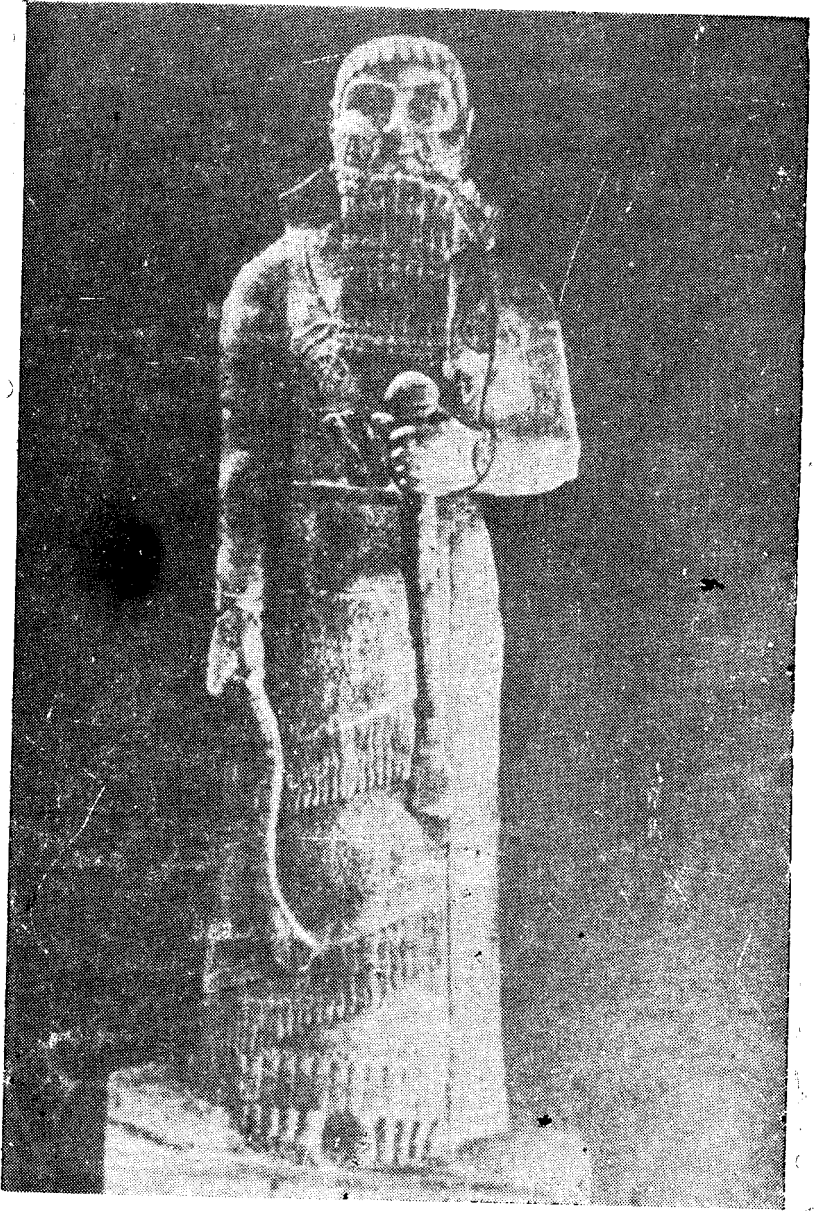
الملك « آشور - ناصر - بال » الثاني

عن : بارو ( أندرية ) بلاد آشور ، ترجمة وتعليق دكتور عيسى سلمان وسليم طه التكريتي - الجمهورية العراقية ، سلسلة الكتب الترجمة ١٩٨٠ ص ٣٣ .