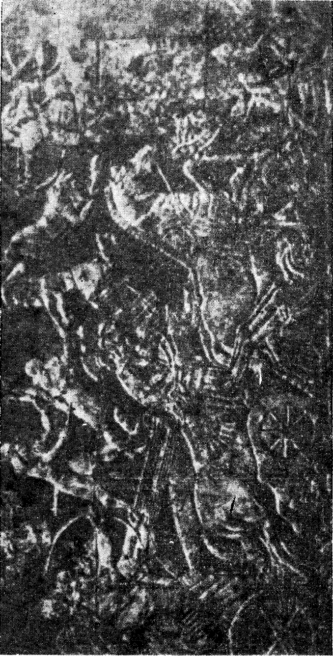
منظر من مدينة « كالخ » ( نمرود ) « آشور — ناصر — بال » الثانى يقود سلاح العربات فى ميدان القتال . عن : بارو ( أندريه ) المرجع السابق ، منظر رقم ١٨ ص ٣٠ .