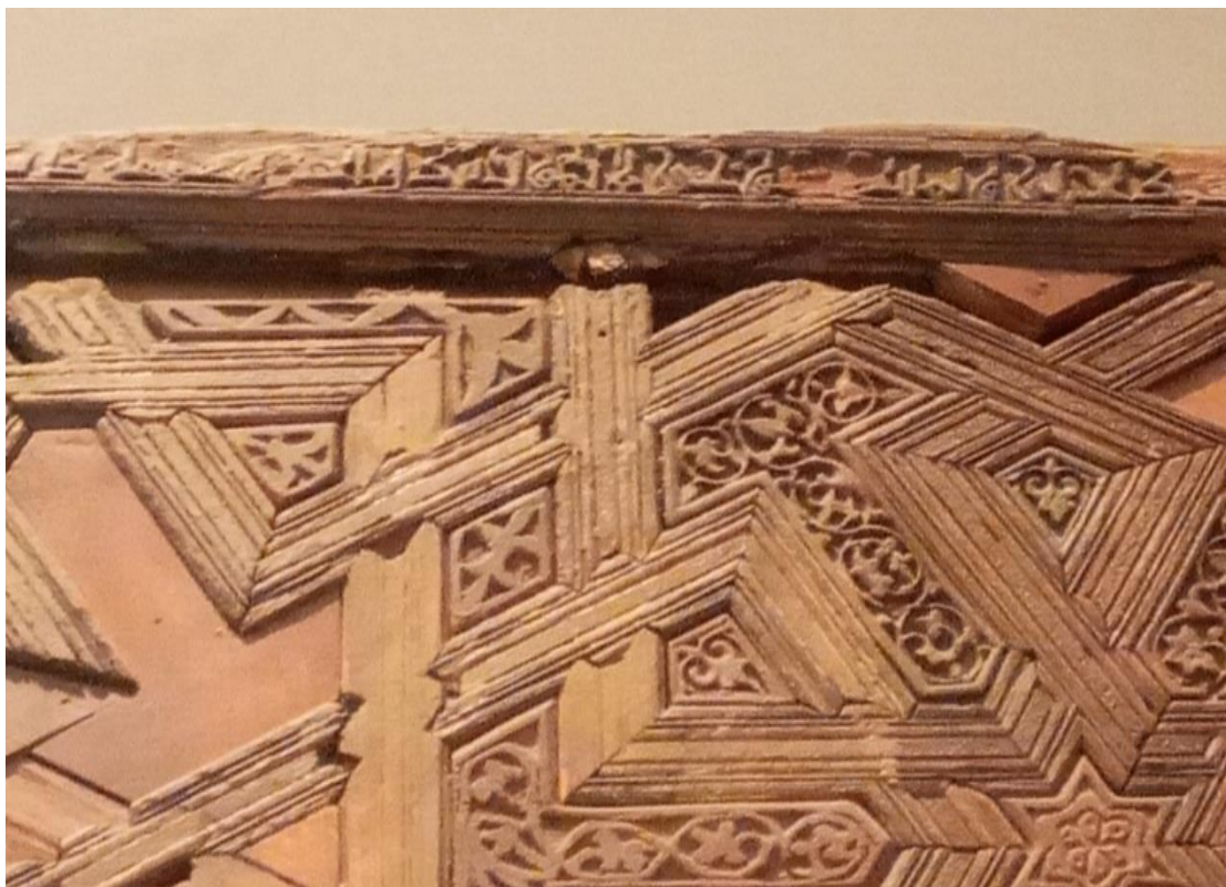
لوحة (4): تكبير لجزء من الحديث النبوي المسجل على الإطار الأفقي العلوي للمحراب السابق.