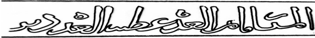
شكل (6): أحاديث "المستشار ماتمن"، و "العدة عطية"، و "العدة دبن" المسجلة على باب خشبي من المدارس الصالحية (عمل الباحث).