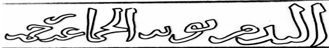
شكل (8): حديث "الندم توبة"، وحديث "الجماعة رحمة" المسجل على باب خشبي من المدارس الصالحية (عمل الباحث).