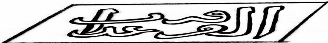
شكل (9): حديث "الفرقة عذاب" المسجل على باب خشبي من المدارس الصالحية (عمل الباحث).