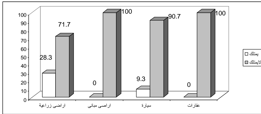
شكل (1) : يوضح إمتلاك أسرة المبحوثات لبعض الممتلكات.