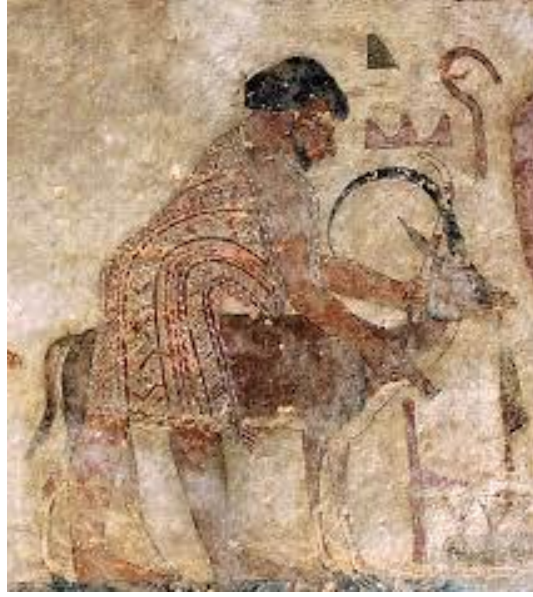
ابشا حقا خاسوت من مقبرة خنوم حتب - الاسرة الثانية عشرة بني حسن - المنيا