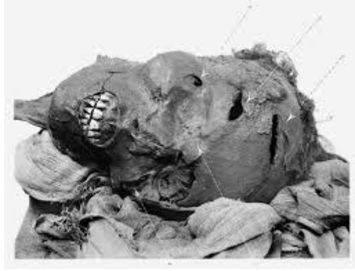
مومياء الملك سقنرع - المتحف المصري