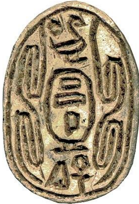
جعران باسم الملك ششي نقلا عن :

https://www.egyptologica.be/section_egyptologie_egyptologica/article_egyptologie.php?ID=18