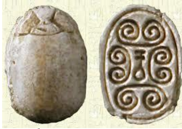
جعران من عصر الهكسوس يحمل العلامة nfr