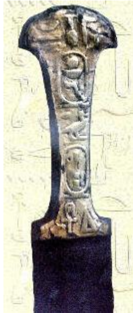
خنجر باسم الملك نب خبش رع - ايبب