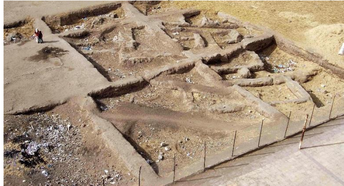
بقايا اثار عاصمة الهكسوس

مجموعة من النصوص لعصر الهكسوس منها لوحة لياناسي ابن خيان الأكبر، ونص لمذبح منزلي لابوفيس واخته ثاني