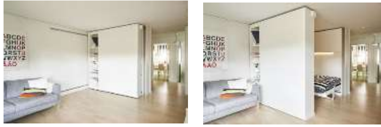
صورة (2) السرير المدمج في الحائط يتحرك على مجرى بحيث يمكن فتحه وغلقه تبعاً للحاجة مما يزيد من مساحة الفراغ.

كما توضح الأمثلة التالية صورة (2،3) أنه من خلال تصميم وحدات أثاث مدمج في الحائط المتحرك يمكن ضم أو توسيع أجزاء من الفراغ لإعادة استخدام المساحة الأصلية بأكثر من شكل تبعاً للحاجة. كما تمكن مساحات ثابتة للنمو من خلال الاستفادة من هذه الحوائط المتحركة لإعادة التقسيم الداخلي في حاله تغير الاستخدام.