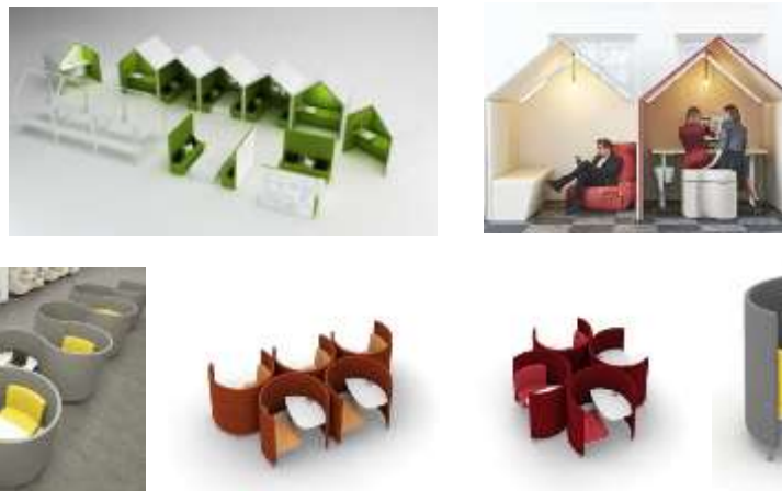
صورة(22) نماذج الأثاث الإدارى التطوري.

أولاً: نماذج الأثاث الإدارى التطوري كما توضح صورة(22) يمكن تصميم غرف عمل تطويرية على شكل أكواخ تستخدم لعدة أغراض كمناطق (للعمل والاسترخاء والاجتماعات، مصممة من خامات خفيفة من الأخشاب والنسيج المعالج العازل للصوت. أيضا الوحدات مصممة على شكل وحدات هندسية يمكن تكرارها في عدة اتجاهات لتتطور الى عدد أكبر من المكاتب ووحدات الجلوس. 26