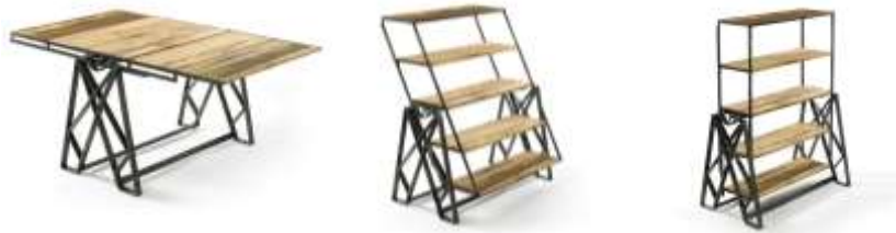
شكل (2) الأثاث التطوري التكراري حيث تنمو الوحدات في الاتجاهين الأفقي والرأسي 10

يعتمد الأثاث التطوري على مبدأ التكرار حيث يمكن استخدام شكل هندسي مثل المستطيل وتكراره في اتجاهات مختلفة مع تغيير أبعاده في كل من الاتجاهين الأفقي والرأسي كما يوضح شكل (2).