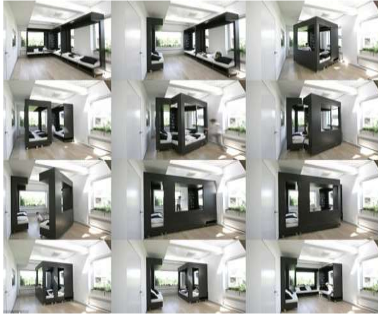
صورة(21) غرفة الجلوس المكعبة والأثاث التطوري المدمج في حائطها المتحرك. 25