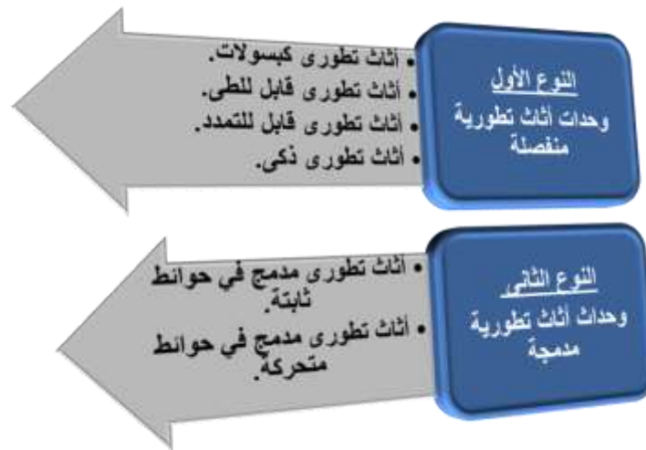
شكل(4)أنواع الأثاث التطوري. 13

تغير مفهوم تصميم الأثاث من الإستاتيكية إلى الديناميكية وأصبحت المرونة هي المبدأ الأساسي في تصميم الأثاث التطوري. وعلى أساس ذلك يمكن تصنيف أنواع الأثاث التطوري إلى نوعين كما يوضح شكل(4) التالي: