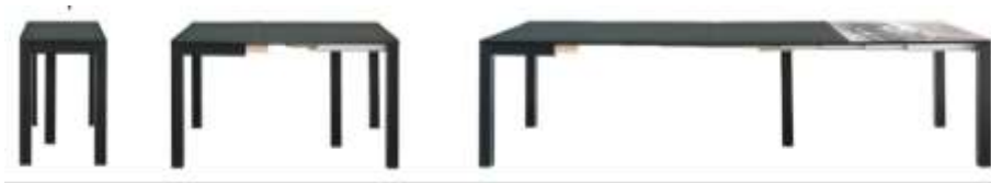
صورة (8) الأثاث التطوري يتميز بحرية حركة أجزائه المختلفة 9