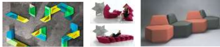
صورة(10) مجموعة صور لقطع أثاث تطويرية من أشكال هندسية غيرمنتظمة تتبع شبكه مديولية.