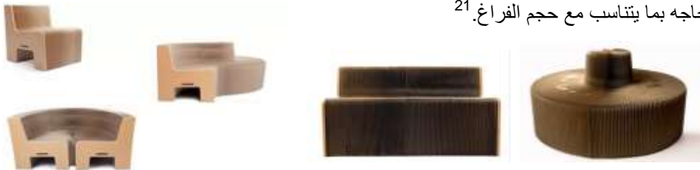
صورة (18) الكرسي المتطور لقابل للتمدد.

2- الكرسي المرن القابل للتمدد صورة (18) مصنع من الورق المقوى والنفائات الخشبية معاده التدوير. قطعة واحدة من الأثاث لها القدرة على التمدد لاستيعاب عدد أكبر من الأفراد، يمكن ببساطة سحب كل نهاية لخلق مقاعد قوية يتغير طولها وشكلها حسب الحاجة بما يتناسب مع حجم الفراغ. 21