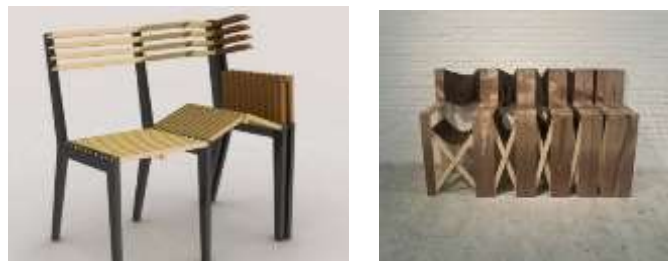
الصورتين (14،15) وحدات الكراسي المتطورة القابلة للطي.

1- مجموعة من الكراسي قابلة للطي عندما لا يكون هناك حاجة لاستخدامها مما يوفر المساحة كذلك يمكن تخزينها بسهولة أو نقلها، بسبب خفة الوزن النسبية. 18