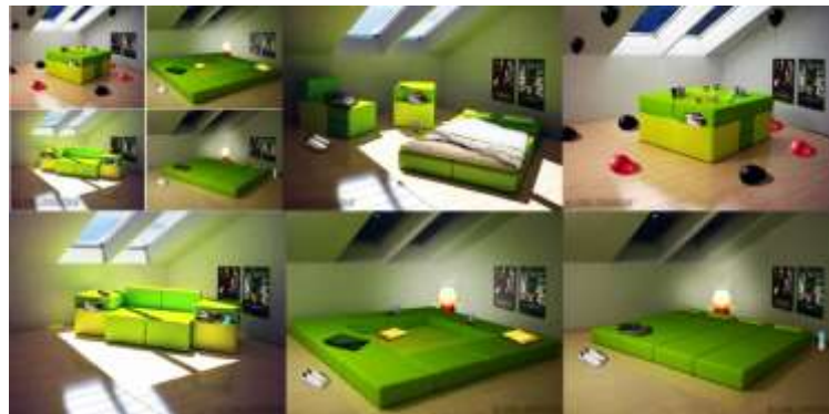
صورة(4) الأثاث المتحول يتغير شكله وحجمه ليصبح متعدد الاستخدامات كما يتطور في حاله زيادة عدد الأفراد.

يصلح الأثاث المتحول للاستخدام للأغراض المتعددة، كذلك للاستخدام في الحالة المفردة أو في حالة زياده عدد الأفراد في الفراغ الواحد كما في صورة (4) يمكن أن تستخدم قطعة الأثاث المتحولة في عدة أشكال لعدة استخدامات مثل كبنه جلوس لشخصين يمكن تطويرها لتصبح جلسة عربية تكفي 8 أشخاص ، أو غرفة نوم لشخصين وفي حالة زيادة عدد الأفراد يمكنها أن تتطور لتكفي 4 أشخاص.