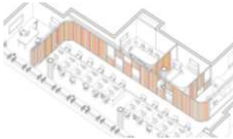
شكل (1) نظام الفواصل المنزلقة يسمح بزيادة المساحات الداخلية للفراغات وإعادة تقسيمها حسب الحاجة.

تطور التصميم الداخلي لأي فراغ يتطلب أن تكون عناصر هذا الفراغ مرنة وقابلة للنمو لذا لا يصلح تصميم الجدران الداخلية الثابتة التقليدية من الطوب بينما يمكن استبدالها بالفواصل المتحركة والتي من خلالها يمكن التحكم في مساحة الفراغ وزيادتها عند الحاجة.