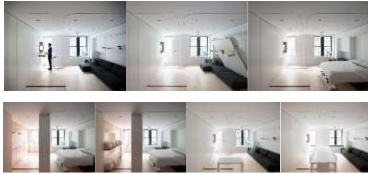
صورة (20) غرفة النوم المتطورة تضم مجموعة من الأثاث التطوري المدمج في الحوائط. 24

كما توضح صورة (20) في الحالة العادية تصلح الغرفة للنوم وأيضاً للمعيشة في نفس الوقت أما في حالة زيادة عدد الأفراد المستخدمين تتطور قطع الأثاث المدمجة في الحائط الثابت لزيادة عدد الأسرة فتصبح غرفتي نوم ، كما تتطور وحدة المنضدة لاستيعاب عدد أكثر من الأفراد.