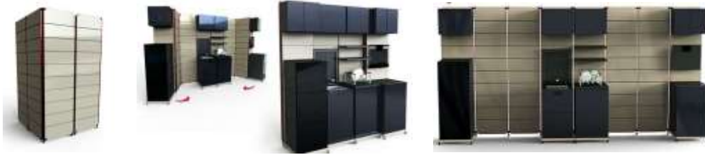
صورة (16) وحدة مطبخ المتطورة القابلة للطي. 19