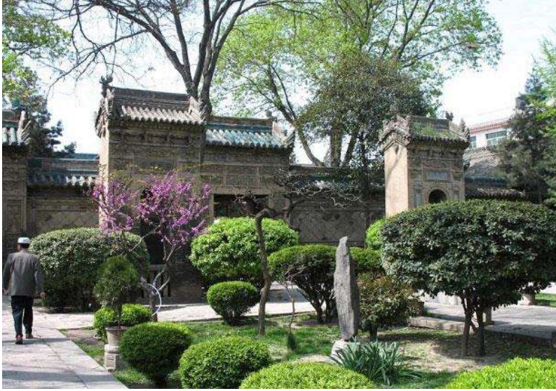
شكل (8) مسجد شيان الكبير من الخارج