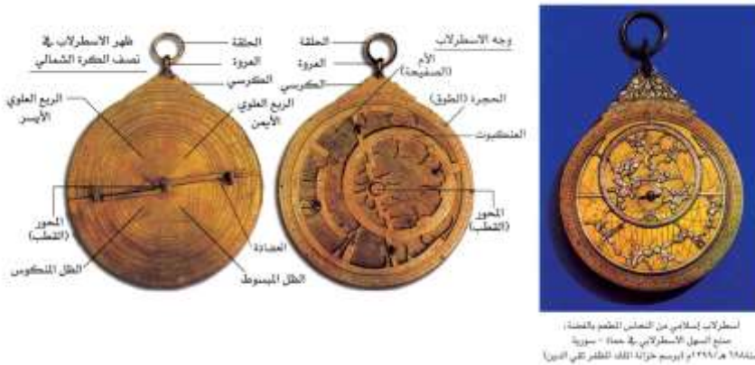
شكل (3) الإسطرلاب و الأجزاء المكونه له