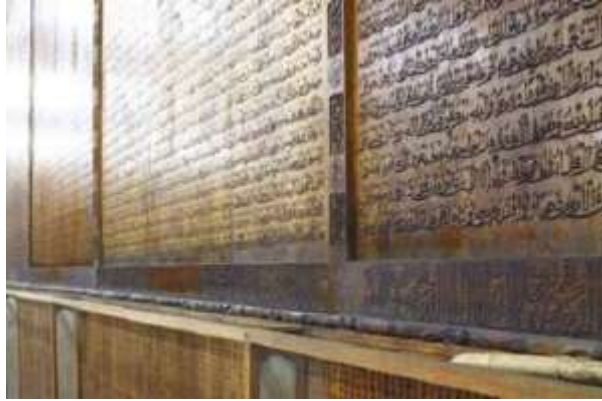
شكل (4) القرآن الكريم و قد كتب كاملاً على جدران مسجد شيان الكبير

و لقد أعيد بناء هذا المسجد على نفس شكله القديم بواسطة الأدميرال "الحاج شينج" المنحدر من عائله مسلمه و ذلك فى عام 1392 م ، كما جرى ترميمه لثلاثة مرات أخرى .