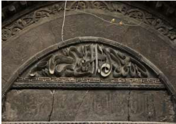
شكل (5) بعض الزخارف الخطيه و الآيات القرآنيه مسجد شيان الكبير (1)