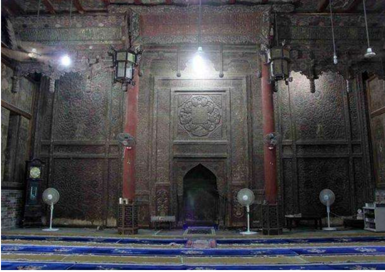
شكل (6) مسجد شيان الكبير من الداخل (1)