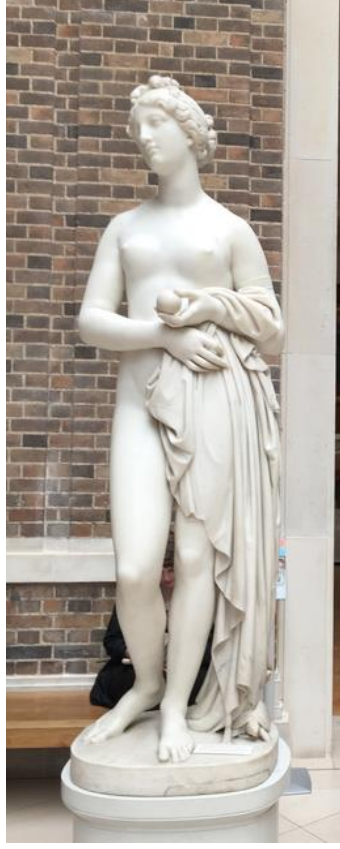
Venus Verticordia, by John Gibson. 1850.

ولعل أشهر ما تم تصويره للإلهة Verticordia هي لوحة من صنع الفنان Rossetti وفيها يصور الإلهة فينوس وهي تحمل في إحدى اليدين التفاحة الذهبية الشهيرة بينما في اليد الأخرى سهم، وهذا السهم الذي يُعتقد أن من خلاله تغير به فينوس القلوب إلى الفضيلة والعفة. (1)