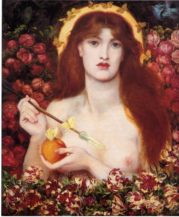
D. G. Rossetti (1828-82), Venus Verticordia (1864-68)

أما فيما يخص المصادر الأدبية التي تناولت الإلهة فينوس فهناك العيد من المصادر التي تناولت الإلهة Venus verticordia وكانت كلا منها تصور لنا جانبًا مختلفًا من الجوانب سواء سبب ظهور عبادة الإلهة أو طقوس العبادة ذاتها مثل بلينيوس الأكبر الذي تناول سبب ظهور عبادة verdicordia في عمله " التاريخ الطبيعي " Historia Naturalis (١) .