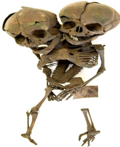
Squelette du monstre-chat trouvé dans le cabinet Pestalozzi.

Un cabinet très connu au XVIIIème siècle mérite une attention particulière : le cabinet de Monconys Pestalozzi. Jérôme-Jean Pestalozzi -médecin lyonnais- acquit le cabinet d'histoire naturelle de Monconys qu'il enrichit avec des « monstres ». 22