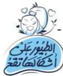
شكل (12): تشكيل من معالجة الخطوط لمثل (الطيور على أشكالها تقع)