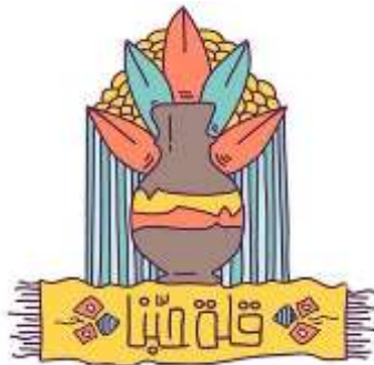
شكل (13): ليس مثل شعبي و إنما مصطلح للتعبير عن الحب (قله حبنا)