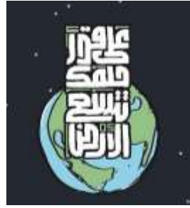
شكل (16): (على قدر حلمك تتسع الأرض)