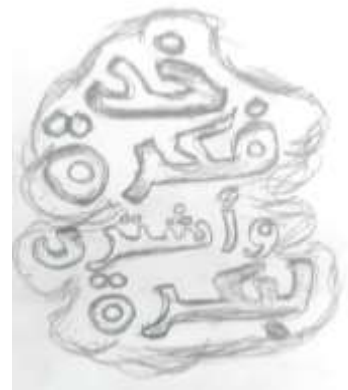
شكل (4): خذ فكرة واشترى بكرة (مثل شعبي)