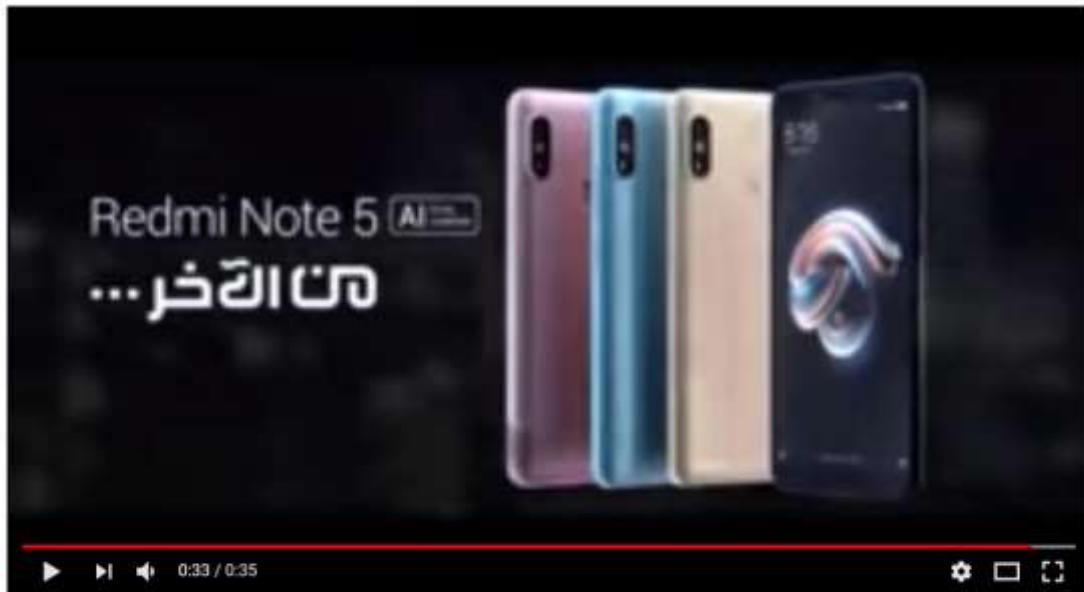
إعلان شاومي - احمد مالك - رمضان 2018