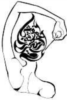
شكل (17): (مفيش حلاوة من غير نار)