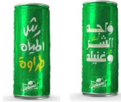
شكل (19): إعلان تليفزيونى لـ سبرايت لحملة (المثل اللي يعطك غيره). #هو_ده_الجديد