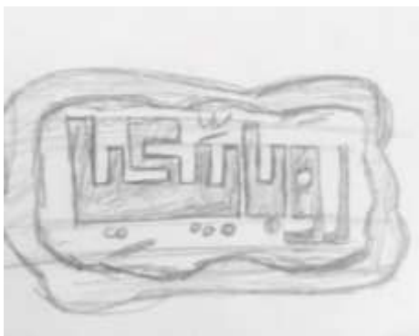
شكل (5): كلمة روبايكيا (مصطلح من الفولكلور)

مجموعة من الإسكتشات من تصميم طلاب الفرقة الرابعة كمرحلة مبدئية لمعالجة الخطوط العربية لتمثل الوظيفة: