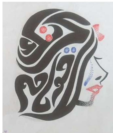
شكل (10): معالجة خطية لأية (لا يحزنك قولهم).