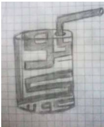
شكل (11): معالجة خطية لكلمة كوكاكولا.