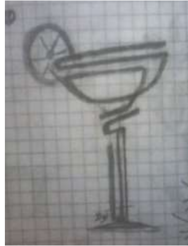
شكل (8): معالجة خطية لكلمة كوكاكولا.