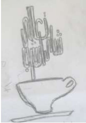
شكل (7): تعالى اشرب شاي (مصطلح من البيئة المصرية)