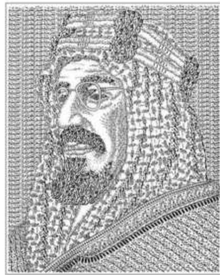
شكل (1): معالجة خطوط لصورة الملك عبد العزيز آل سعود - وأخرى عن اليوم الوطني للإمارات