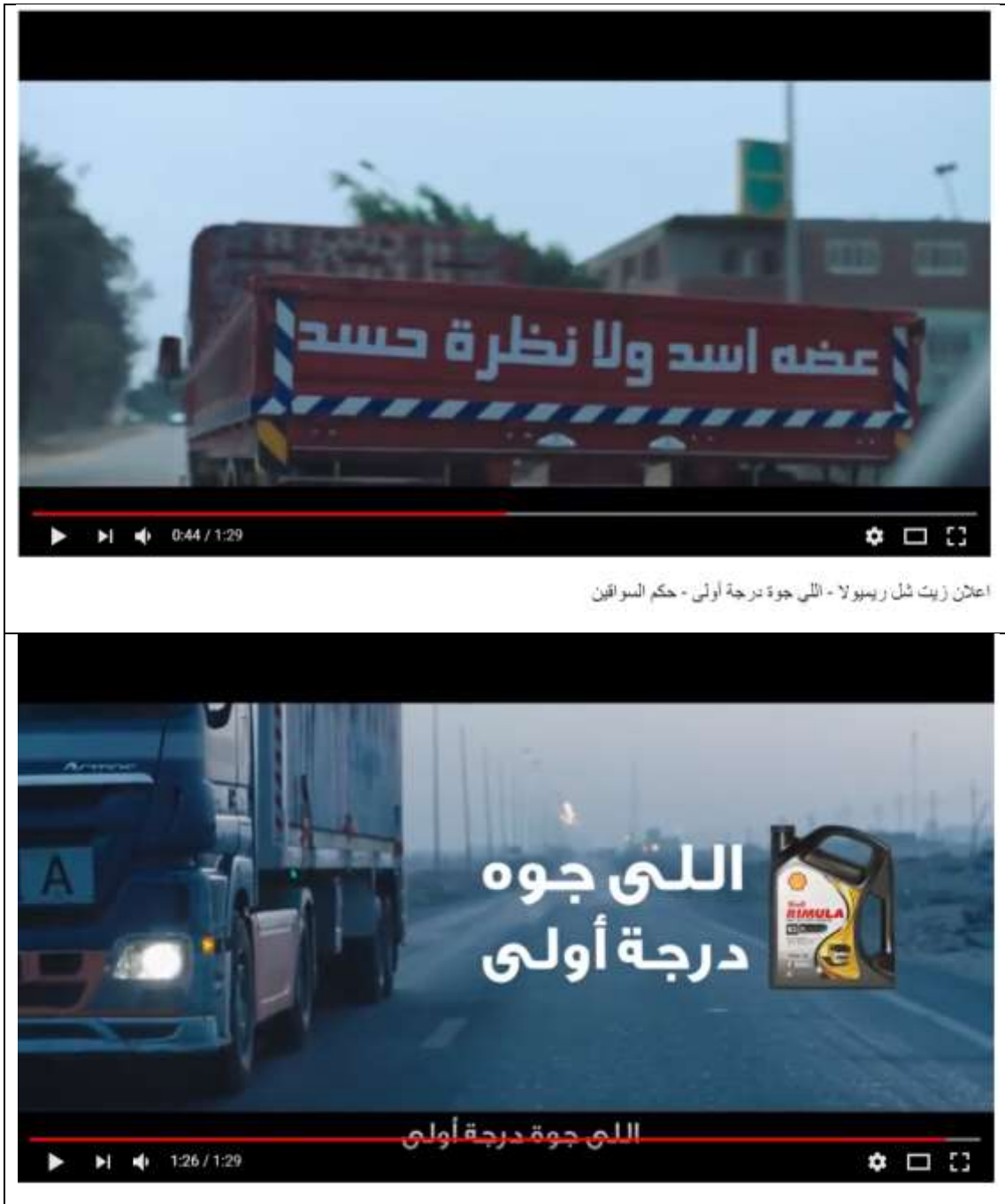
اعلان زيت شل ريمبولا - اللي جوة درجة أولى - حكم السواقين