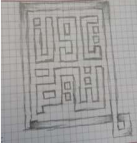
شكل (9): معالجة خطية لاسم منتج تون تيم.