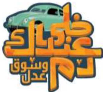
شكل (15): عبارة تقال كل يوم بالشارع