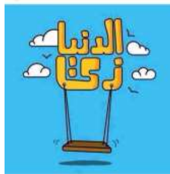
شكل (14): (الدنيا زي المريجحه)