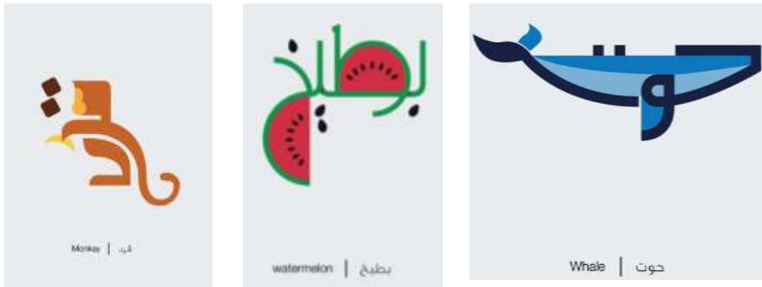
شكل (3): معالجة شكل الخطوط حسب شكل العنصر

مجموعة من الإسكتشات من تصميم طلاب الفرقة الرابعة كمرحلة مبدئية لمعالجة الخطوط العربية لتمثل الوظيفة: