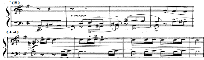
شكل رقم (١١)

الجملة الثانية بالفكرة الأولى من م(٨)-١ (١٥) في المقطوعة الرابعة