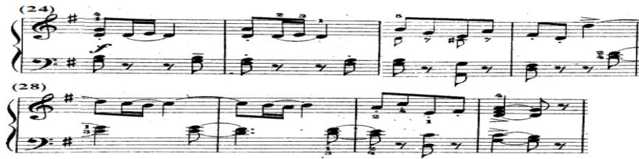
شكل رقم (١٢)

جاء اللحن بصوت قوى f في اليد اليمنى من م(٢٤-٢٧) عبارة عن مسافات هارمونية متقطعة يليها نغمات مفردة متصلة، ويصاحبها في اليد اليسرى مسافات هارمونية خاضعة لقوس لحنى قصير لعلامة البورتاتو (-) وعلامة الضغط القوي accent (>)، ويتكرر ذلك بالتصوير من م(٢٨-٣١)، وتنتهي بتألفات هارمونية بقفلة تامة سلم مي/ص، والشكل التالي يوضح ذلك.