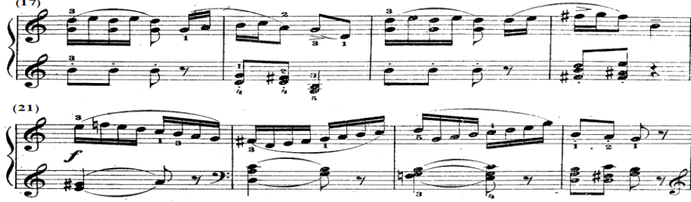
شكل رقم (٧)

هارمونية متقطعة، ومن م(٢١-٢٤) جاء لحن اليد اليمنى عبارة عن نغمات سلمية متصلة هابطة وصاعدة بصوت متوسط القوة f ، ويصاحبها في اليد اليسرى مسافات وتآلفات هارمونية خاضعة لقوس لحنى قصير slur ورباط زمنى، والشكل التالى يوضح ذلك.