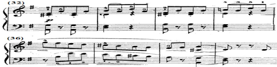
شكل رقم (١٣)

جاء اللحن بصوت خافت p من م(٣٢-٣٥) عبارة عن نموذج إيقاعي متكرر يحتوى على مسافة هارمونية يليها نغمة مفردة منقطعة بالتبادل، ويصاحبها في اليد اليسرى مسافات هارمونية، وفي م(٣٦)،(٣٧) ظهر نغمات سلمية متصلة على بعد مسافة سادسة لحنية بين اليدين تنتهي بمسافات هارمونية، وتنتهي الجملة بقفلة تامة سلم ري/ك، والشكل التالي يوضح ذلك.