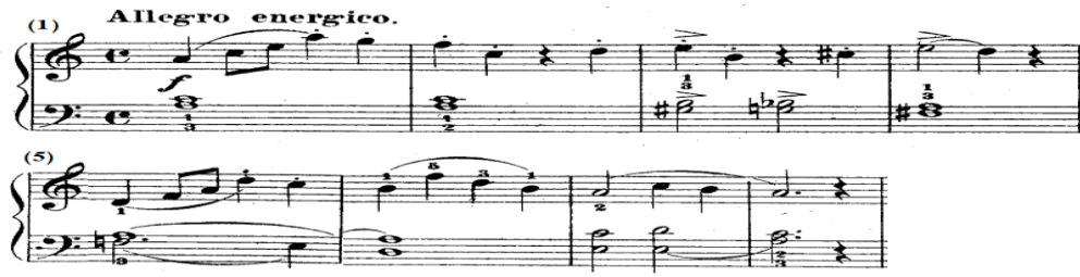
شكل رقم (٨)

جاء اللحن في اليد اليمنى بالعبارة الأولى من م(٤-١) بصوت قوى f عبارة عن أربع صاعد متصل Legato يليه مسافات لحنية متقطعة Staccato وخاضعة لعلامة الضغط القوي accent تنتهي بمسافة لحنية خاضعة لقوس لحنى قصير Slur ، ويصاحبه في اليد اليسرى مسافات هارمونية ممتدة وخاضعة لعلامة الضغط القوي، والعبارة الثانية من م(٨-٥) جاءت تصوير للعبارة الأولى مع إختلاف بسيط حيث جاءت المسافات اللحنية متصلة، والشكل التالى يوضح ذلك.