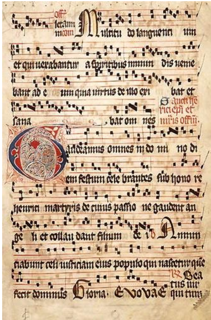
الحن الافتتاحي لإحدى الترانيم الجريجورية