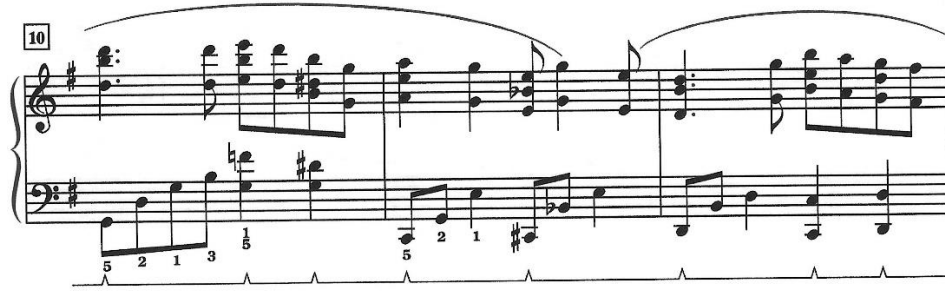
شكل ٤ (م ١٠-١٢)

٢. التدريب على الأوكتافات في اليد اليمنى بطريقة العزف المتقطع قبل عزفها ليجاتو حتى يمكن سماع أصوات متساوية في القوة. كما في م ١٠ : م ١٢ (شكل ٤)