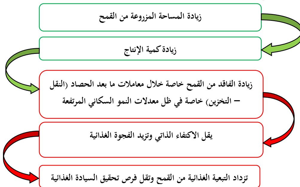
شكل 4. التبعية الغذائية لمحصول القمح في مصر

ومما سبق يمكن ان نخلص إلى أن تبعية مصر في محصول القمح وسيادتها في محصول الأرز إلى سلسلة من