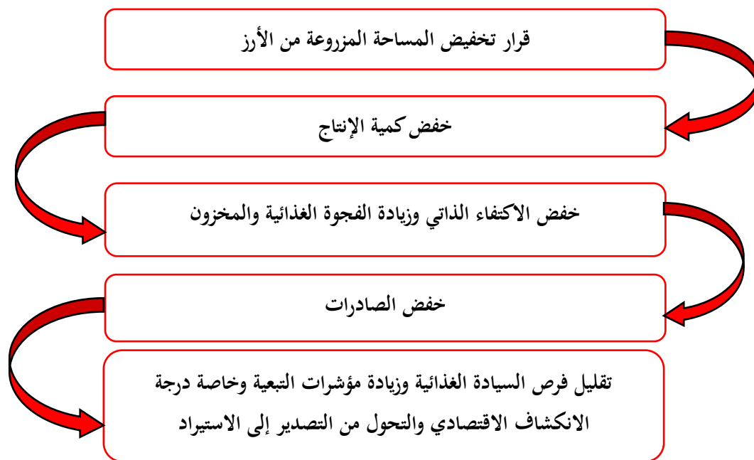
شكل 5. السيادة الغذائية لمحصول الأرز في مصر