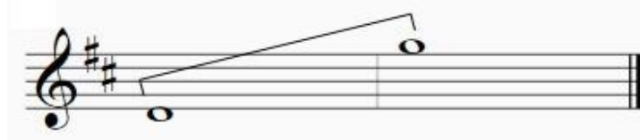
شكل رقم (٥)

المساحة الصوتية : لصوت السوبرانو ( جريتيل )