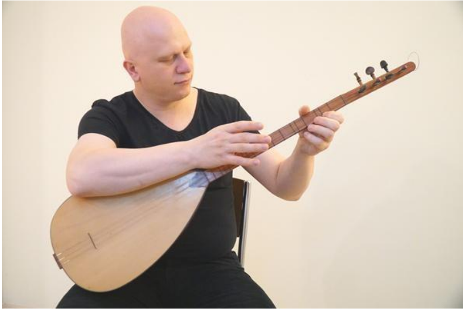
الشكل ٢.٤: الوضع النموذجي لتقنية PVT

(ج) على الوضع الأوسط / (د) على الجسر (لكنم النغمات) / (هـ) الجانب الخلفي للجسر . يتم تنفيذ تقنية PVT، وهو الموضوع الرئيسي لهذه الدراسة، باستخدام اليد اليمنى (RH) واليد اليسرى (LH) فوق العنق (الشكل ٢.٤). على الرغم من أن استخدام تقنيات العزف بدون ريشة، والتي كانت شبه منقرضة قبل ثمانينيات القرن الماضي، ودخلت فترة "إعادة اكتشاف" في التسعينيات منه، قد زادت في يومنا هذا، إلا أن أسلوب العزف بالريشة لا يزال هو أسلوب العزف السائد.