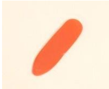
الشكل ٢.٥: مزراب أو تيزيني (ريشة البزق أو الساز أو البغلمه)

تتضمن تقنية العزف بالريشة التي تسمى مزراب أو تيزيني في الأناضول، والتي تُمسك باليد اليمنى (الشكل ٢.٥).