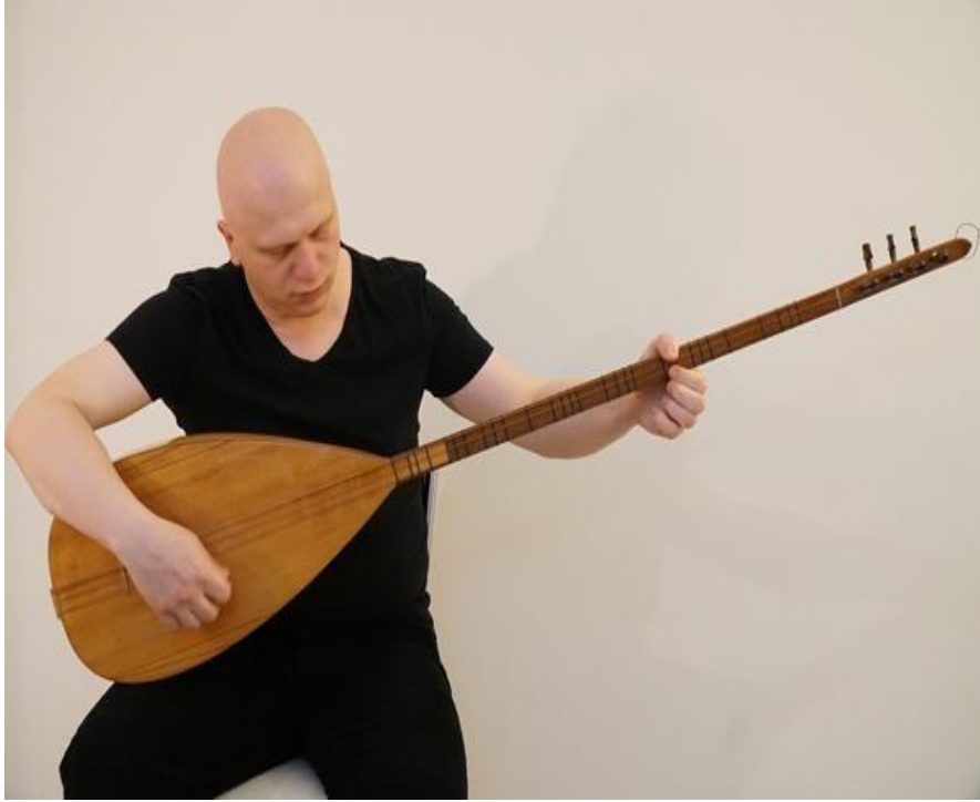
الشكل ٢.٦: الوضع النموذجي لتقنية العزف بالريشة (١) .

إن كلمة مضراب هي كلمة من أصل عربي، من الجذر (بيكين-١٩٧٥). وكلمة تيزيني هي كلمة تركية، وتسمى أيضا بالعامية تازاني، وترزيني، تايزيني، وتازاني، كان لتقنية العزف بالريشة عصرها الذهبي في القرن العشرين، وتم تطويرها من قبل العديد من العازفين في ذلك العصر للوصول إلى شكلها الحالي، على الرغم من أنها تختلف وفقا للتفضيلات الشخصية أو الرنين المطلوب في حالة العزف، يتم الإمساك بالريشة في المنتصف تقريبا (الشكل ٢,٦).