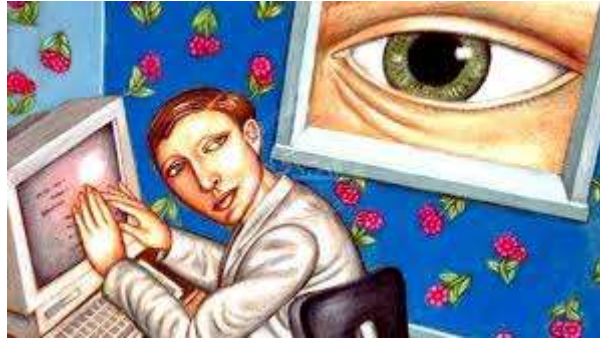
شكل (١) تعبر عن مراقبة السلوك الأخلاقي في التعلم الرقمي

وإذا كان المعلم مسؤولاً عن تلبية حاجات المتعلم: العاطفية، والاجتماعية، والأخلاقية في نظام التعليم المباشر، فقد اختلف الأمر كثيراً في فلسفة التعليم عن بعد، وفي الأجهزة التي تبرمج محتوى المنهج التعليمي رقمياً.