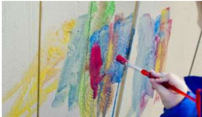
شكل (٢) يعبر عن تعليم الفنون

يعتبر تعليم الفنون لطلبة المدارس الابتدائية والمتوسطة والاعدادية من اهم طرق تربية النشأ الجديد وفق النظام الاجتماعي الذي يقوم عليه المجتمع المعين من النواحي العقلية والاخلاقية حتى يتمكن الفرد الناشئ من ان يحيا حياة سوية متوازنة في بيئته خالية من العقد والمشاكل ازاء الحياة.