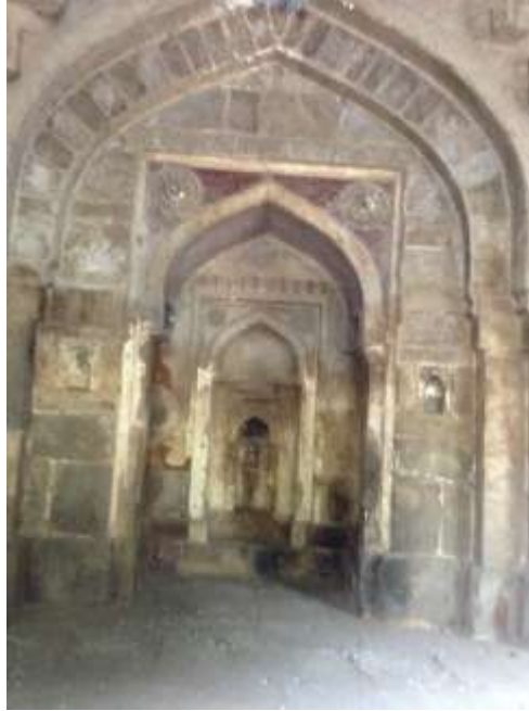
(لوحة رقم 2أ) المحراب الجانبي الأول من الجبهة الجنوبية الغربية بمسجد موزكي