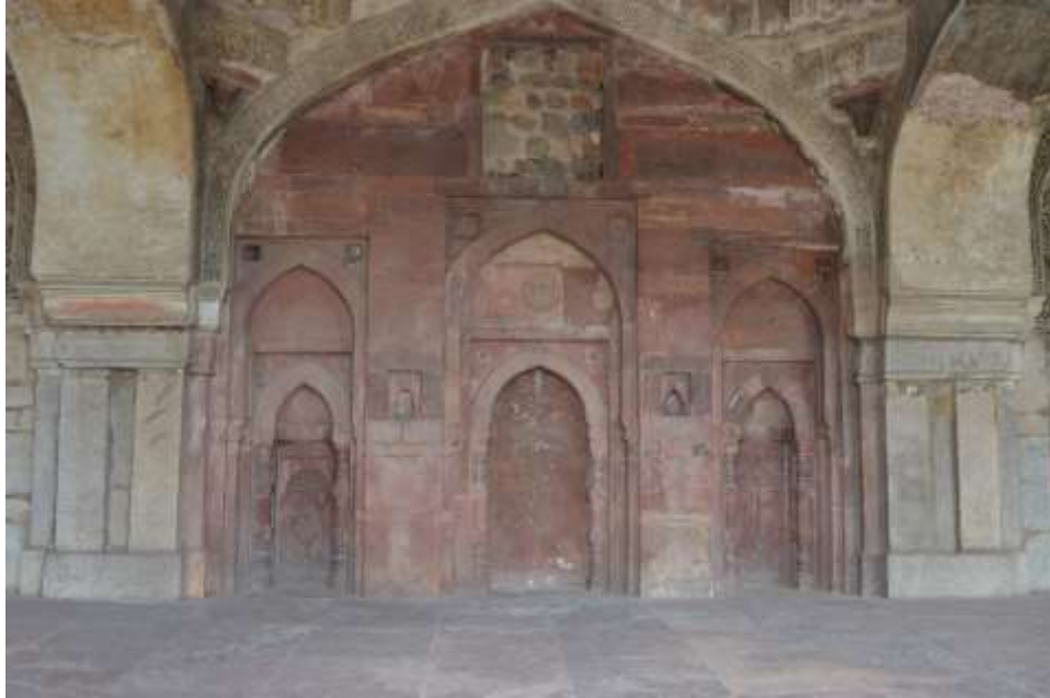
(لوحة رقم 1) المحراب الرئيسي بمسجد باراجومباد 900هـ / 1494م ، بحدائق اللودي ، نيودلهي، تصوير الباحثة .