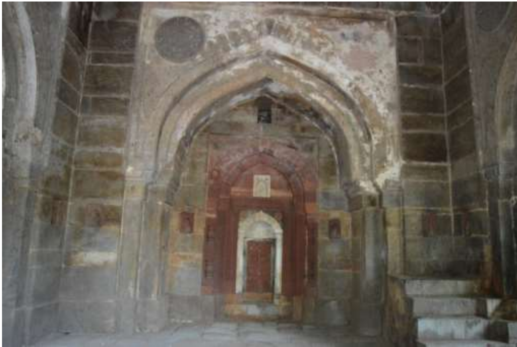
(لوحة رقم 2) المحراب الرئيسي لمسجد موزكى 906هـ / 1500م ويظهر من خلالها بروز المحراب من الخارج, دلهى , تصوير الباحثة .