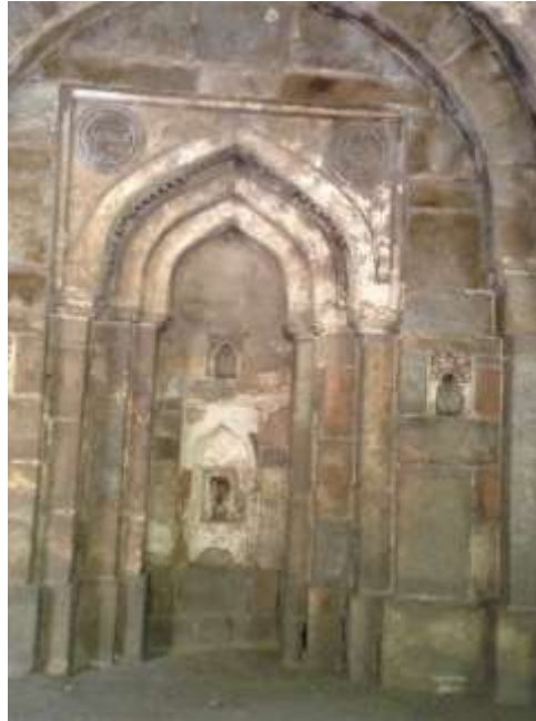
(لوحة رقم 2ب) المحراب الجانبي الثاني بالجبهة الجنوبية الغربية بمسجد موزكي