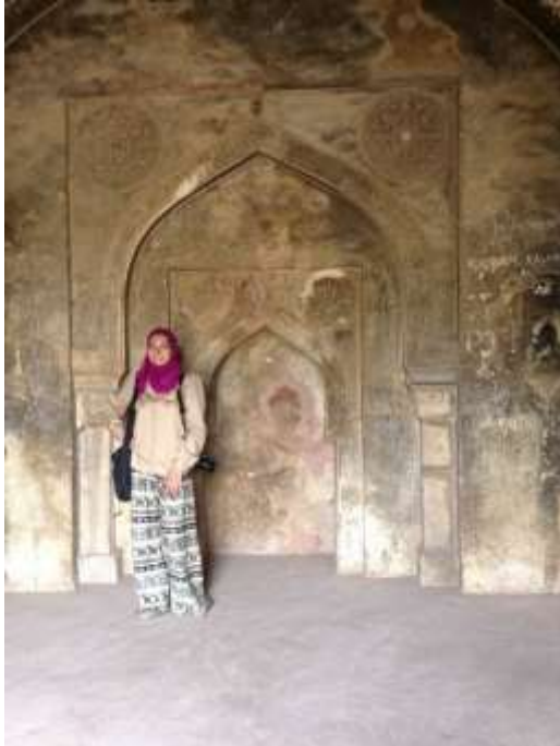
(لوحة رقم 3 أ) المحراب الجانبي بالجهة الشمالية الغربية من المحراب الرئيسي بمسجد راجون كي , تصوير الباحثة