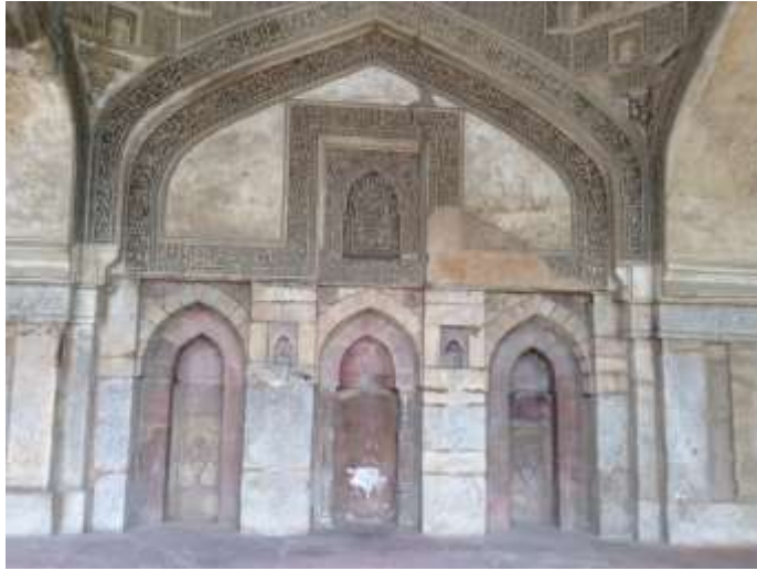
(لوحة رقم 1أ) محاريب المربعة الجانبية بالجهة الجنوبية الغربية من المحراب الرئيسي بمسجد باراجومباد