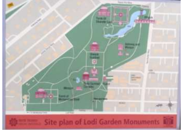
شكل (أ) خريطة توضح الأماكن الأثرية بحديقة اللودي ، تصوير الباحثة.