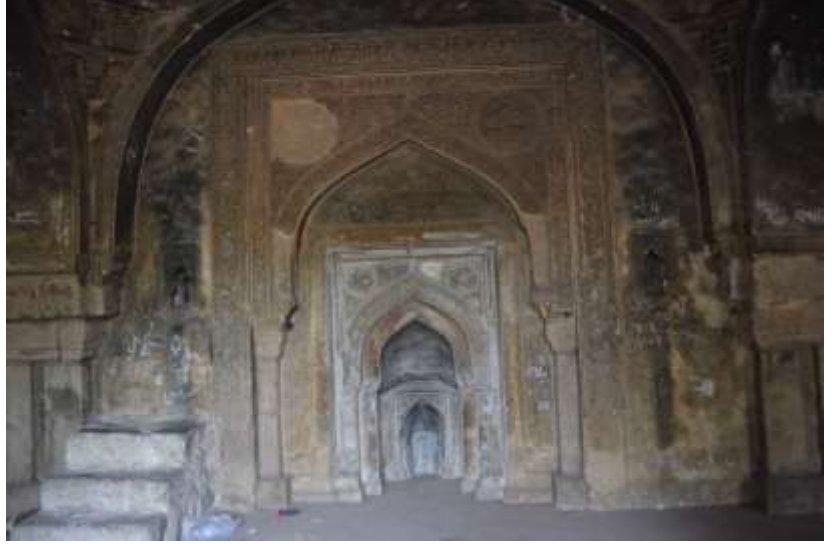
(لوحات رقم 3) المحراب الرئيسي لمسجد راجون كي بآئين 912هـ / 1506م , بحديقة مهرولى الأثرية