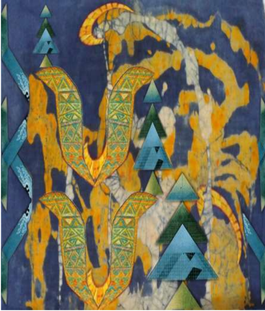
التصميم رقم 4