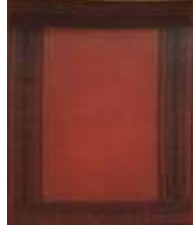
شكل رقم(2)سجادة اسلامية بخطوط هندسية تجريدية هندسية مجردة كما لو انها لوحة لمونديان

الفن الاسلامي منذ فترة ما قبل الفن الحديث و الاشكال رقم (1 و2 و3 و4) توضح بعض من اعمال الفنانين الاسلاميين في هذه النظرية الجمالية .