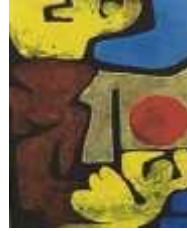
شكل رقم (6) تشكيلات مجردة من حرف السين والراء