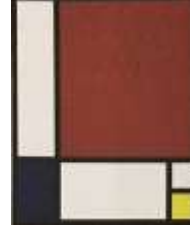
شكل رقم (12) اهم اعمال موندريان التجريدية الهندسية التي تأثر فيها بالخطوط العربية الكوفية الهندسية واصبحت مدرسة تجريدية خاصة به