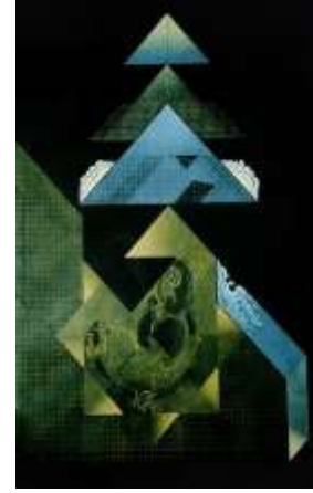
شكل رقم (19) الفنان احمد نوار