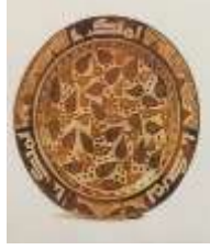
شكل رقم(4)طبق خزفي من الفنون الاسلامية بعناصر نباتية تجريدية وخطية مجردة وقد قلده كيرا مثل بيكاسو