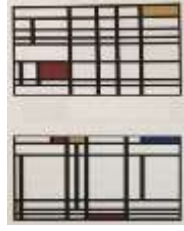
شكل رقم (11) بعض اعمال موندريان المستوحاة من الخط الكوفي الهندسي الاسلامي