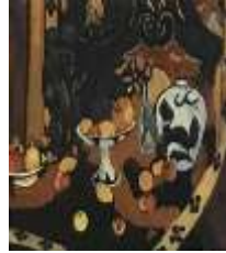
شكل رقم (14) الزخارف العربية الثراء و البذخ في المنزل العربي نجده في اعمال ماتيس