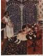
شكل رقم (15) تأثر ماتيس بالفنون الاسلامية من خلال فتحات الزجاج المعشق والسجاجيد المزخرفة

تأثر بالفن الاسلامي حينما شاهد معرض الفنون الاسلامية باللوافر في باريس ثم ذادت ثقله بهذا الفن بعد زيارته للمغرب وهناك كان ماتيس حافلا وشيقا مع الفنون والتقاليد العربية وقام بعمل عدة لوحات فنية رائعة . تأكد على بحث ماتيس عن المثلثات الاسلامية الذي قال عنها انها كل امكانياتي واحساساتي . وماتيس كفنانه تأثر وتعمق بروح الفن الاسلامي والزخرفة الشرقية العربية واستلهم منها فنا حديثا من عناصر وفلسفة هذا الفن الخالد وان اكتشاف الجذور العربية الاسلامية في فن ماتيس ليس يبعث على التعصب الاسلامي . وليس دعوة باطلة كالدعاوي التي يتناول بها البعض . وانما هو واقع افردته النقاد والفنان نفسه واعماله التي تدل على مدى ادراك الفنان للعناصر الشرقية ودمجها مع الشخصية في وحدة جمالية اسلامية مصورة و الاشكال من ( 13 الى 15) توضح هذا الدمج .