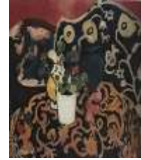
شكل رقم (13) الزخارف العربية النباتية المجردة في اعمال ماتيس في العصر الحديث