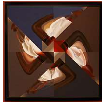
الفنان احمد نوار 2009 15