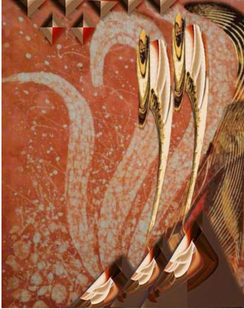
التصميم رقم 3