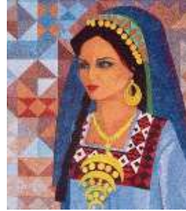
الفنان وفيق منذر 1999 12