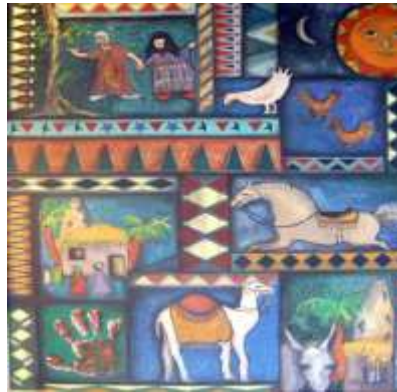
الفنان نبيل لحود 2001 19