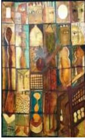
شكل رقم (21) عمر النجدي