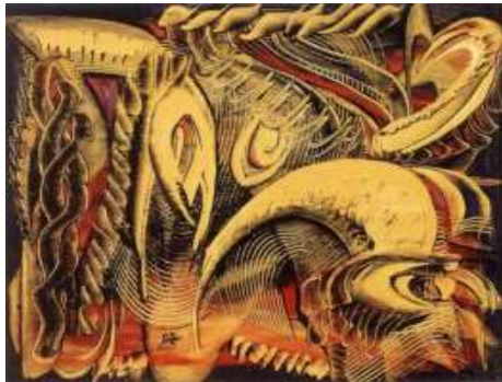
الفنان صلاح طاهر 1985 16