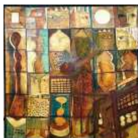
الفنان عمر النجدي 2010 14