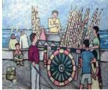
الفنان نبيل لحود 2002 13

اعتمد التصميم في بنائه على هيئة المستطيلات من توزيع الاشرطة ذات الزخارف الهندسية والمتنوعة المستوحاه من احد لوحات الفنان نبيل لحود والمتراصة باحجام وكثافات مختلفة بالاتجاه الراسي مع الاشرطة المطبوعة بأسلوب الباتيک في الاتجاهين ( الافقي والراسي ) مما اعطى التصميم مسارا حركيا لعين المتلقي وجاء الشكل الدائري في الجزء العلوي للتصميم ليكون كعامل تثبيت ليحد من خروج العين عن التصميم كما ان التنوع في توزيع درجات الالوان ( الساخنة و الباردة ) اعطى التصميم ككل نوعا من الاتزان والحركة