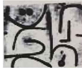
شكل رقم (8) تشكيلات من حرف التاء والنون واللام في مقروءة من اعمال بول كلي