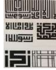
شكل رقم (10) الخطوط العربية الكوفية وكيفية استفادة موندريان من تقاطعاتها الهندسية