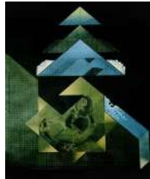
الفنان احمد نوار 17