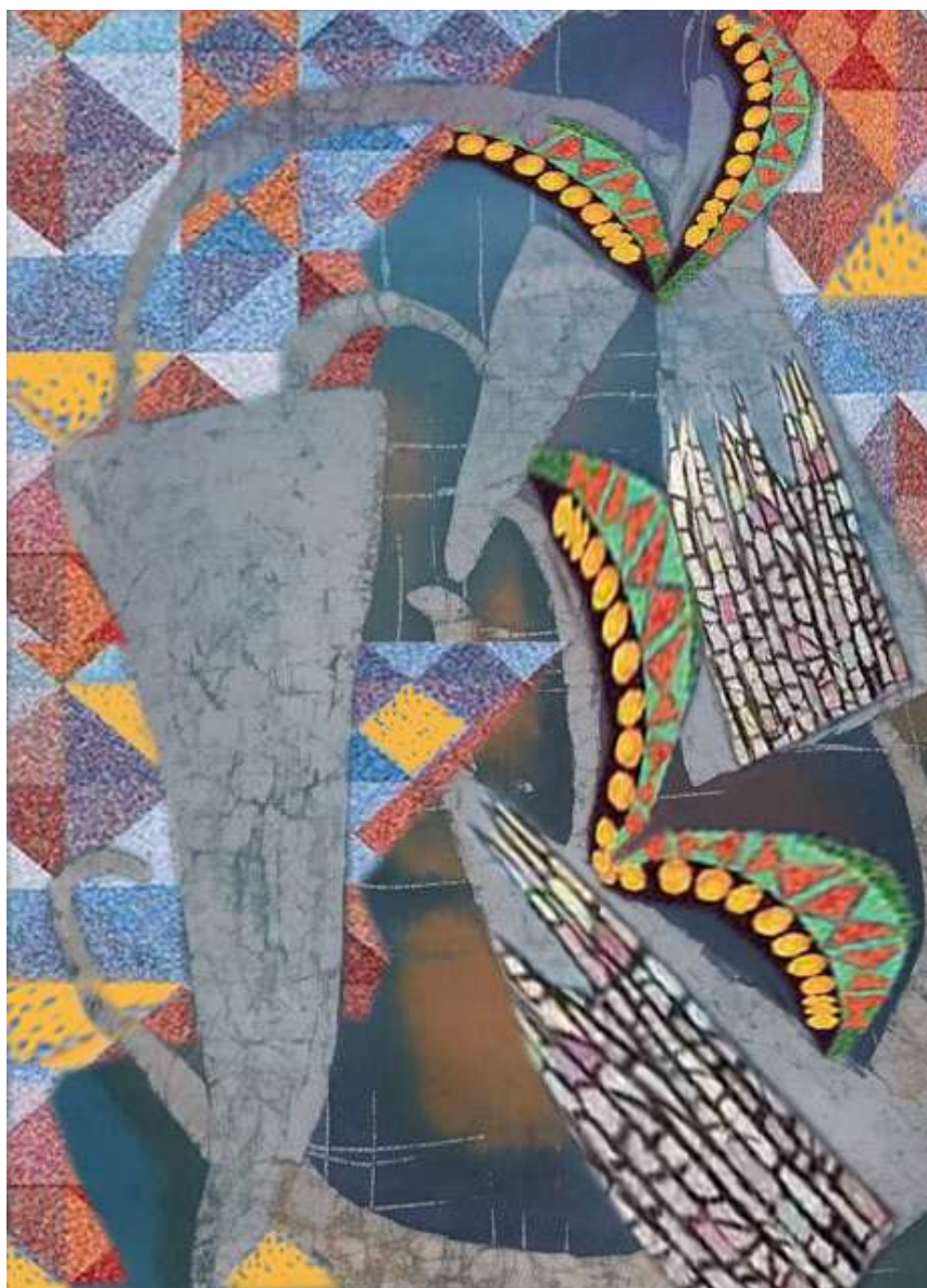
التصميم رقم 1