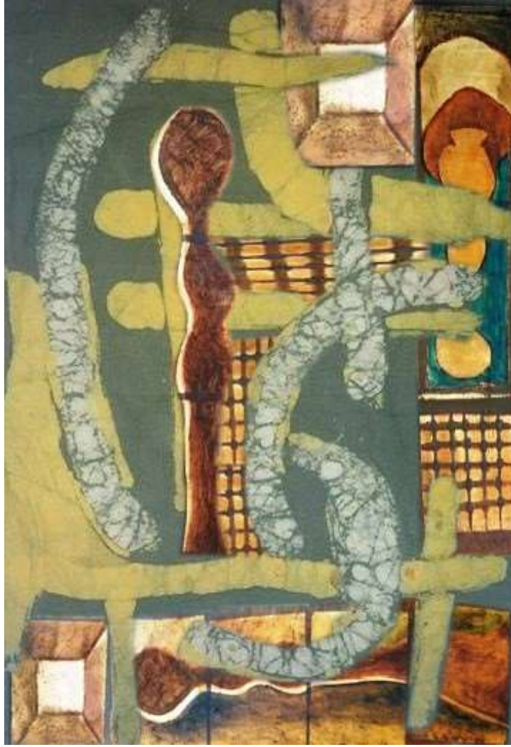
التصميم رقم 2