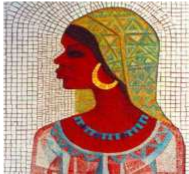
الفنان وفيق منذر 1987 18