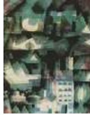
شكل رقم(7)المباني العربية والقباب والمآذن تشكيلات مستحدثة لبول كلي

تمكن بول كلي من فهم الفن العربي الاسلامي واعادة صياغته بما يتناسب و ايقاع العصر الحديث وكذلك وضوح رؤية اللون الشرقي وصفاته نتيجة لوجود الشمس الساطعة التي تؤكد على اظهار اللون وذلك على عكس الفنان الغربي الذي اعتمد كثيرا على طمس اشعة الشمس في لوحاته في هذه الفترة كذلك الاثر الناتج من زيارته للدول العربية جعلته يستفيد من عناصر العمارة الاسلامية من حيث التكتل المعماري الهندسي والقباب والمآذن ونرى ذلك مؤكدا في الكثير من اعماله الفنية والشكل (7) يعد من اهم اعمال بول كلي التي استوحاها من التراث المعماري الاسلامي كذلك هنالك العديد من الاعمال الفنية له تظهر مدى تاثره بالكتابة والفنون الاسلامية العربية منها كما في الشكلين (8,9)