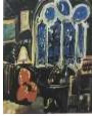
شكل رقم (18)

اما الشكل (18) فنلاحظ ارتباط بيكاسو بالعمارة الاسلامية من خلال الفتحات الزجاجية واستفاد منها في تكوينات تجريدية في اعمال حديثة ونجد الكثير من العناصر والرموز الفنية الاسلامية وقد استفاد منها بيكاسو في اسلوبه ومدرسته الخاصة .