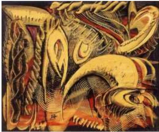
شكل رقم (23) صلاح طاهر