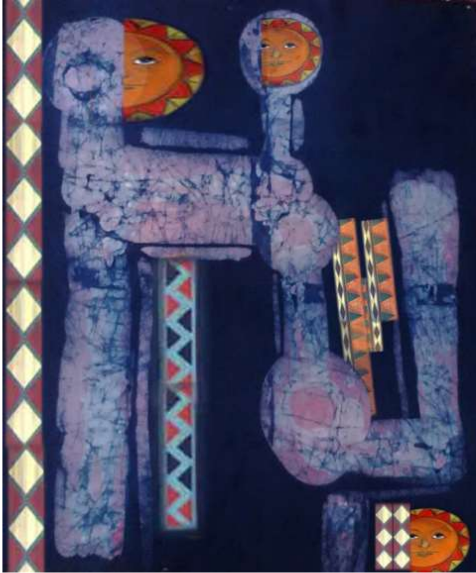
التصميم رقم 5