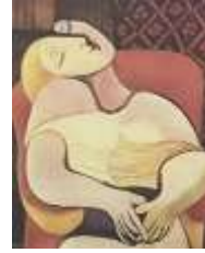
شكل رقم (16)

قليل جدا من الفنانين من يضعون لحياتهم مشروعا ابعد من حدود ابداعهم وطموحاتهم الخاصة ومحيطهم الضيق , مشروعا يرتبط برسالة عليا تخص الوطن او المجتمع الذي ينتمي اليه الفنان دون ان يكون ثمة انفصال بين المشروعين الذاتي والعام بل يعضد كل منهما الاخر ومن هؤلاء الفنانين المحليين الذين ينتمون الى القرن العشرين الفنان احمد نوار و الفنان نبيل لحدو والفنان وفيق منذر والفنان عمر النجدي والفنان صلاح طاهر لذلك فالبحت الحالي قد ركز على الزخارف الهندسية المستوحاة من بعض أعمالهم التي تحمل الهوية المصرية وهذه الاشكال هي رقم (19 و 20 و 21 و 22 و 23) وفيما يلي نبذة تاريخية مختصرة عن هؤلاء الفنانين :