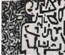
شكل رقم(9)الحروف العربية في تكوين حديث لاعمال تكوينات بول كلي