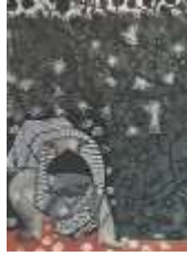
شكل رقم (17)