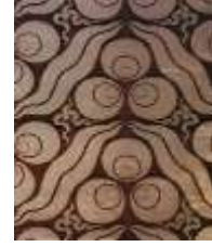
شكل رقم (3) بلاطات من القيشاني كانت عملا فنيا مستحدثا