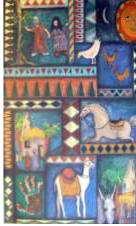
شكل رقم (20) الفنان نبيل لحدود