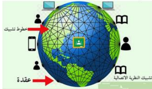
شكل (1) عملية التعلم وفق النظرية الاتصالية (من تصميم الباحثين)

ت. هناك من يسميها بالنظرية الترابطية لأنها تربط التعلم والمتعلم بالبيئة والاقتران وايضا تربط عمليتي التعلم والتعليم بالأجهزة والانترنت، فالتعلم يكون شبكة مترابطة. و نظرية التعلم في العصر الرقمي هي نظرية تعمل على التكامل بين التطبيقات التربوية لمبادئ نظرية الفوضى/الشواش، Chaos ونظرية الشبكات Networks ونظرية التعقيد Complexity ونظرية التنظيم الذاتي؛ Self- Organization، لتفسير التعلم في العصر الرقمي الراهن، واعتبر Siemens في نظريته أن التعلم هو المعرفة الإجرائية Actionable knowledge التي يتم تحصيلها من خارج أنفسنا (في قواعد البيانات أو منظمة الأعمال أو وسائل التواصل الاجتماعي مثلا) ، وإن تلك المعرفة موزعة بين الناس والأشياء ولا يملكها فرد واحد، ولا يمكن تحصيل تلك المعرفة إلا من خلال الاتصال مع تلك المصادر البشرية وغير البشرية، ويمكن تمثيل تلك المصادر بشبكة من العقد Nodes تمثل كل عقدة مصدرا من مصادر المعرفة، وتتمثل المعرفة الإجرائية بعنصرين أساسيين، أولهما المعرفة ذاتها التي تتنوع من المعرفة الضمنية، وثانيهما، العمل أي القيام بأداء المهام بالطريقة المناسبة، وتعتبر أن التعلم يمثل عملية إدراك وبناء الترابطات المختلفة خلال البيانات والمعلومات المقدمة، ومن كون البيئة التعليمية تمثل شبكة تعليمية حقيقية افتراضية يستطيع من خلالها المتعلم ممارسة أنشطة التعلم الذاتي والتعاوني لاكتشاف ذاته وبناء قراءته واكتشاف نواحي تميزه في الجوانب الأكاديمية لاستثمارها في علاج أوجه القصور لديه ( الكنانى، 2020:108-109).