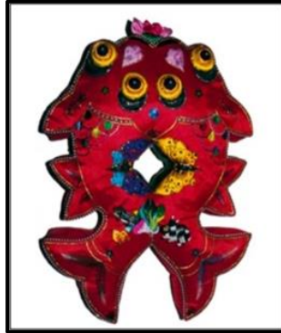
شكل (٣) (٢) ، وسادة على شكل "زوج من الأسماك هدية من عائلة الأم.