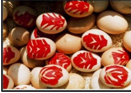
شكل (٢) (١) صورة توضح البيضة الحمراء ملصوق عليها شجرة الحياة.