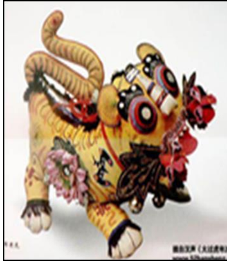
شكل (٨) (١)