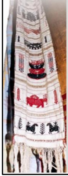
شكل (٧) (١) ، سلم إلى السماء.

إكليل الزهور يستخدم كمظهر قرنانى للدفن .