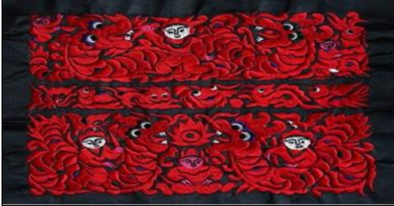
شكل (١١) (١) .

https://www.davidleffman.com/miao-embroideries- ١