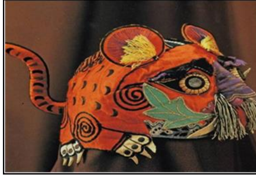
شكل (٤) (٣) ، قبعة على شكل نمر .

"ومن منطلق جذب الحظ السعيد يرتدى الطفل قبعة على شكل نمر شكل (٤) ، معبراً عن أمل الأم في نجاح الطفل في المستقبل ، وأملها أن يكبر ليكون قوياً" (٢).