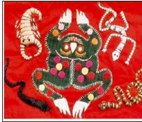
شكل (١٠) (١) .