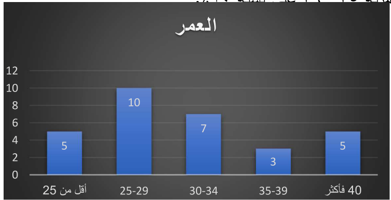
جدول رقم (٣) المؤهل العلمي

وحصلت الفئة العمرية ٣٥ - ٣٩ على نسبة ١٠٪.