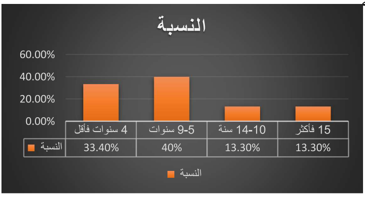
شكل رقم (٤) يوضح سنوات الخبرة