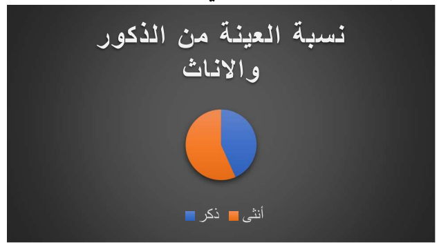
شكل رقم (١) يوضح نسبة العينة من الذكور والاناث.

من الجدول رقم (١) اتضح ان معظم فئات العينة من فئة النوع انثى بنسبة ٥٧٪ بينما حصلت فئة النوع ذكر بنسبة ٤٣٪ نظراً لأن ممارسة مهنة الأخصائي الاجتماعي يسيطر عليها العنصر النسوي في كثير من البلدان. كما وأن مهنة الاخصائي الاجتماعي في المجتمع السوداني مازالت حديثة نسبياً بالإضافة الى أن إقدام الذكور على العمل في مجال الصحة النفسية ما زال ضعيفاً.