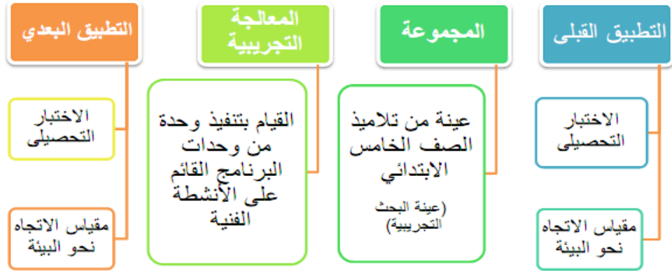
التصميم شبه التجريبي للبحث

استخدم الباحث المنهج شبه التجريبي ذي المجموعة الواحدة (المجموعة التجريبية)، وذلك من خلال عينة من تلاميذ الصف الخامس الابتدائي، تدرس باستخدام البرنامج القائم على الأنشطة الفنية، كما هو موضح بالشكل الآتي: