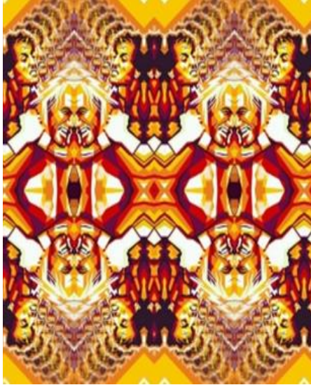
صورة رقم 17. العمل الفني الخامس لوحة زخرفية للباحثة للاعب سيلفستر ستالون وهولك هوجان، رياضة المصارعة، منفذة برنامج الفوتوشوب، طباعة بخام الفيينيل.