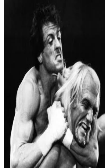
صورة رقم 15. الصورة الأصلية للاعب سيلفستر ستالون وهولك هوجان