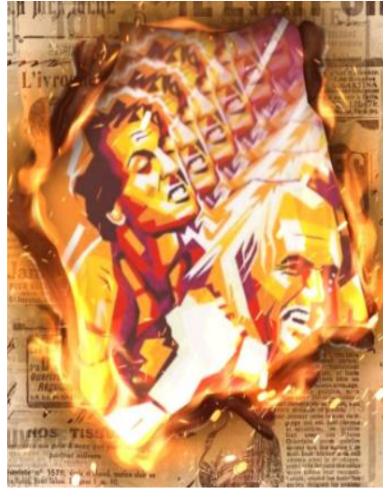
صورة رقم 16. العمل الفني الرابع تجربة عملية للباحثة للاعب سيلفستر ستالون وهولك هوجان، رياضة المصارعة، منفذة برنامج الفوتوشوب والكوريل درو، طباعة بخامة أوراق الفوتوغراف مع الكولاج بأوراق الجرائد