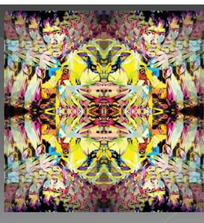
صورة رقم 13. العمل الفني الثاني تجربة عملية للباحثة للاعب بروس لي، رياضة الفنون القتالية، منفذة ببرنامج الفوتوشوب والكوريل درو، طباعة بخامة أوراق الفوتوغراف