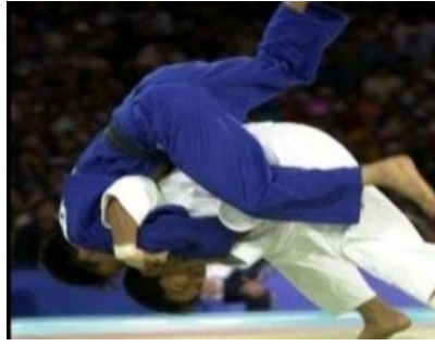
صورة رقم 5. توضح حركة لرياضة الجودو (حلمى، 2020)