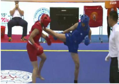
صورة رقم 6. توضح حركة للاعبي الكونغ فو (حلمى، 2020)