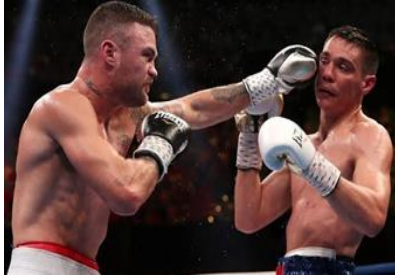
صورة رقم (2) توضح حركات مختلفة من رياضة الملاكمة [14]

تسمى برياضة الفن النبيل وتكون لرياضيين ذوي الوزن المماثل كما تتطلب قفراً في الهواء، كما " تعد تطور حركة الملاكمة خطوة مهمة لتحقيق الصلاحية البيئية في تحليل أداء الرياضيين فمحدودية التصميم في قياس قوة اللكمات أدت إلى قيم لا تعكس كامل القوة ومكونات متعددة الاتجاهات في اللكم، وتتميز في طبيعة شكل الأداء الفني والتكتيكي الذي يظهر أثناء المباريات في انسجام عضلي وحركي وفكري مستمر مع القدرة على سرعة اتخاذ القرار تبعاً للموقف والظروف المتغيرة والمفاجأة. " (عبد الحميد، 2020).