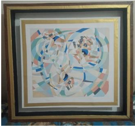
صورة رقم 11. العمل الفني الأول تنفيذ الباحثة للاعب ستيف موكسون، رياضة كيك بوكسينغ، مساحة العمل 55&50سم، بخام ألوان الجواش