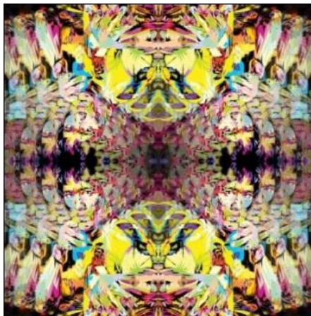
صورة رقم 14. العمل الفني الثالث تجربة عملية للباحثة للاعب بروس لي منفذة ببرنامج الفوتوشوب والكوريل درو، خامطة طباعة على كانفس