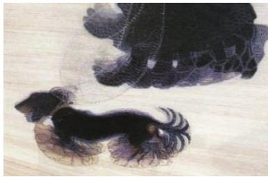
صورة رقم 8. توضح لوحة الكلب في سلسلة للفنان جياكو " (عنانى و عبد الحميد، 2019).