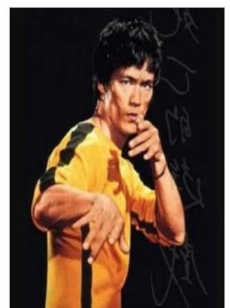
صورة رقم 12. توضح الصورة الأصلية للاعب بروس لي