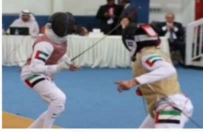
صورة رقم (1) توضح الصورة حركات مختلفة لرياضة المبارزة [12]

ومع تقدم العصور بدأت الشعوب تهتم بكل جزء من أساليب الرياضات القتالية فطوروها بعدما حذفوا منها الحركات الخطرة حتى أصبحت لعباً رياضية ووضعت لها قوانين للتدريب عليها وأصبحت فناً له أصول وقواعد توازي أي فن من الفنون الأخرى كالرسم والنحت وغيرهم من الفنون، حتى أصبحت رياضة تعني بالنواحي النفسية والفكرية بعدما كانت تهتم بالنواحي الجسدية والقوة العضلية، كما تعددت أنواع الرياضات القتالية فمنها المبارزة، الملاكمة، الكاراتيه.. وغيرهم.