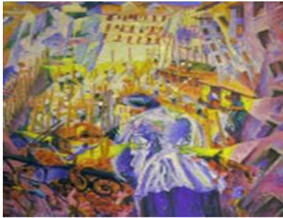
صورة رقم 7. لوحة الشارع يشق البيوت للفنان بوتشيني 1911 (أبو العيون، 2018)