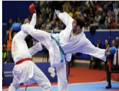
صورة رقم (3) توضح حركات مختلفة لرياضة الكاراتيه [16]

تعد رياضة قتالية يابانية من فنون الدفاع عن النفس غير المسلحة وهي رياضة دفاعية تحظى بأقبال وشغف لكثير من الشباب والنساء في الدول العربية ويتم تطوير لاعبيها عن طريق أداء تمارين بدنية، كما تعد " تطور لحركات الجسم لخلق نوع من التناسق الحركي بين الأيدي والأرجل، ولعمل الانسجام بين العقل والجسم فنجد العامل المؤثر هو العقل والاستجابة وردود الأفعال فهي لعبة فردية تعتمد على الفرد بشكل أساسي أفضل من الجماعية " (عيسى، 2020).