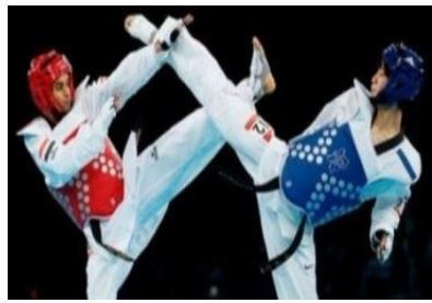
صورة رقم (4) توضح حركة لرياضة التايكوندو [18]

تعد التايكوندو رياضة قتالية كورية ذات شعبية كبيرة تستخدم للدفاع عن النفس فتعرف برياضة اليد والقدم أي فن قتالي مشابه للكاراتيه والكونغ فو " يستخدم الأيدي والأرجل في الصمد والضرب وتعتمد أكثر على الرجلين وتوفرها لوسائل الضمان للاعب فيرتدي الواقيات للرأس والصدر والبطن والذراعين والساقين لحمايته من الضربات الخطرة والحزام للأمان مما ساعد على إدراجها كلعبة أولمبية رسمية من ألعاب الدفاع عن النفس " (شاهين، 2018).