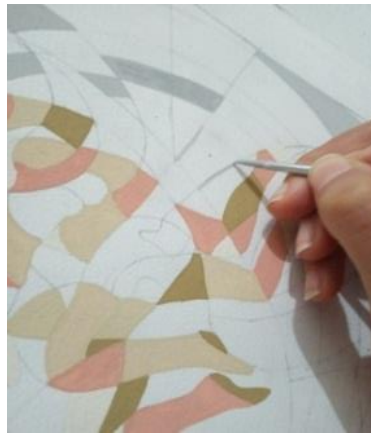
صورة رقم 10. التحليل اللوني للعمل الفني تنفيذ الباحثة بألوان الجواش على أوراق الكانسون الأبيض