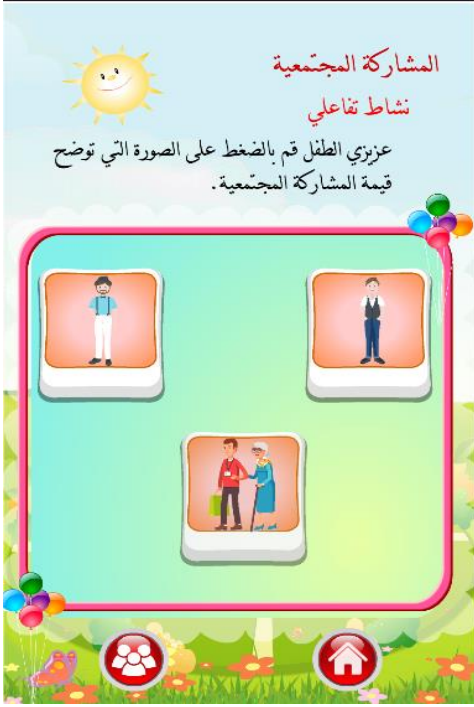
شكل (٢) صورة النشاط داخل التطبيق الإلكتروني

من الأجهزة اللوحية للأطفال لكي يتم تحميل التطبيق عليها وإستخدامها، حيث قاما الباحثان بتقسيم الطلاب الي مجموعات كل مجموعه ٥ طلاب وتزويد كل مجموعه بجهاز تابلت لكي يتم تحميل التطبيق علنه وتنفيذ تجربة البحث.