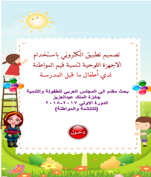
شكل (٣) الشاشة الرئيسية للتطبيق الإلكتروني

في هذه الخطوة تم برمجة محتوى التطبيق الإلكتروني ودمج الوسائل السمعية والبصرية به، وتفعيل النصوص والصور واللقطات المتحركة في صفحات تعليمية عبر الإنترنت، مع مراعاة البساطة وعدم الإكثار من التفرعات التي تشتت انتباه الطفل، وكذلك تم مراعاة ان تكون صفحات محتوى التطبيق مريحة للعين، مع توفير عناصر الجذب والتشويق بعيدا عن التشويش، مع توفير عنصر الوحدة والتوازن بين