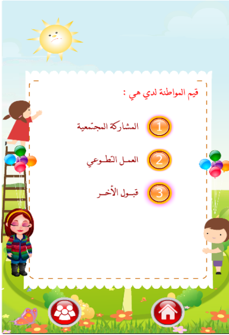
شكل (١) قيم المواطنة المراد تنميتها لدى أطفال ما قبل المدرسة